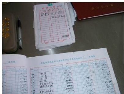
图 16 原始凭证