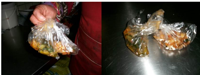
图 11 留样

关于扣分说明:“食品留样”取分值“1”,原因为有留样却存放不合规,也没有相应的文字记录。