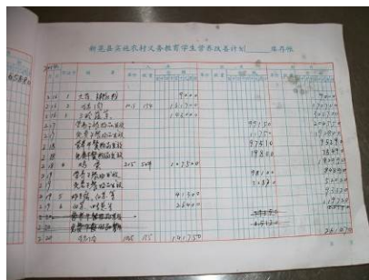
图 17 入库登记簿