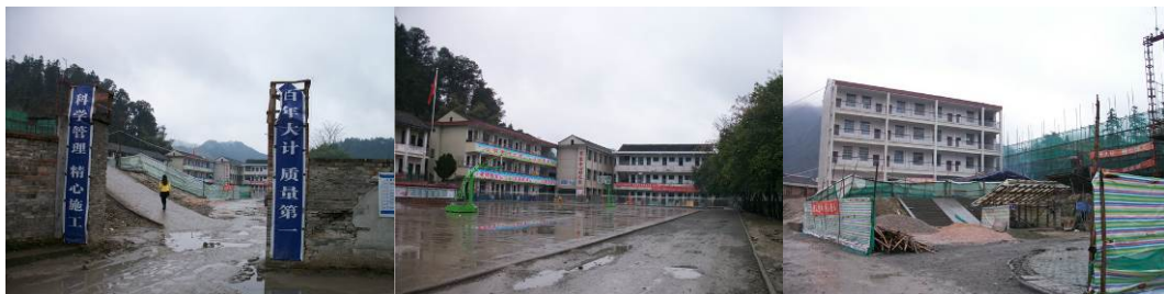
图 2 学校组图