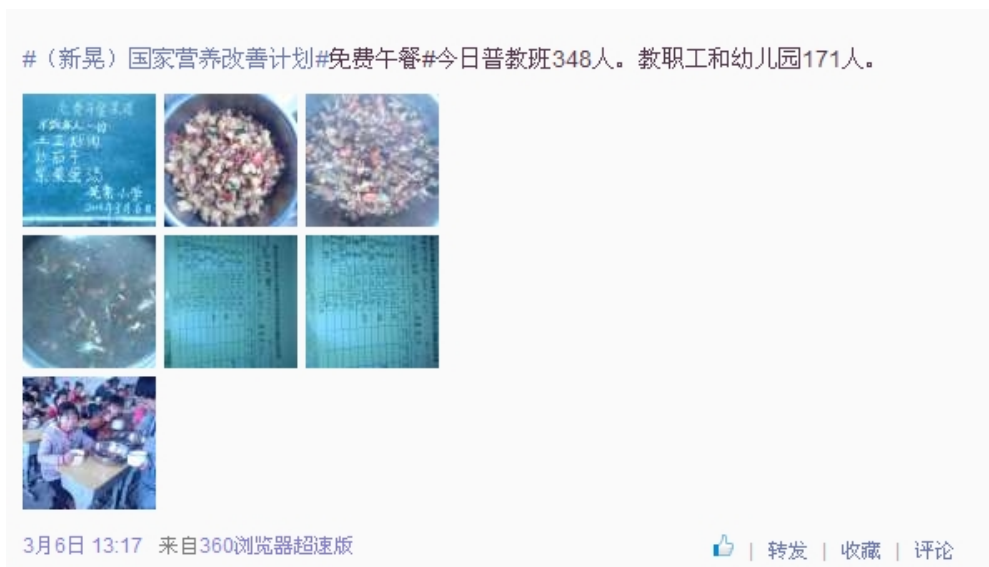
图 3 就餐人数的微博截图