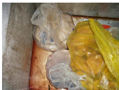
图 4 冰柜

(2) “易变质食物是否妥善保存”取分值“3”，原因为使用了冰柜却未及对冰柜内部进行清洁且有异味。