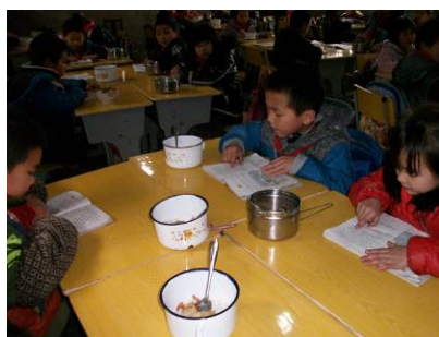
图 10 学生用餐