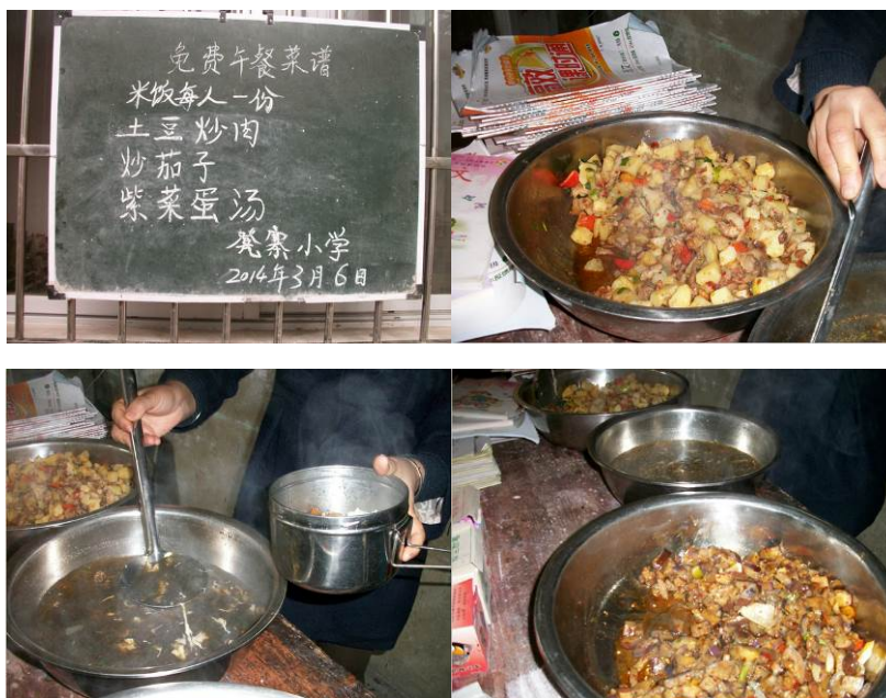
图 9 当日供餐