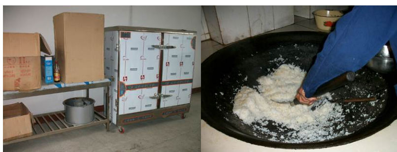
图 12 蒸饭机

(1) 该校各项设备基本齐全,且大部分尚未启用,如消毒柜和蒸饭机,现在做饭仍然使用大锅,据老师解释蒸饭机尚未使用是因为电线尚未完成改装。