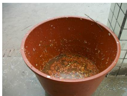
图 15 餐余