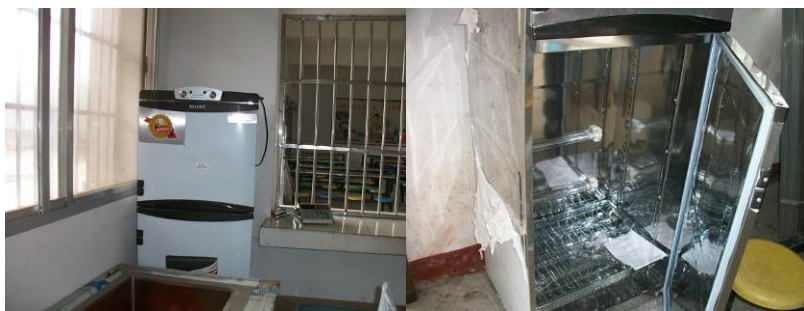
图5 储藏室和餐厅的消毒柜（仍未启用）