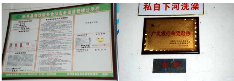
图 9 相关证照