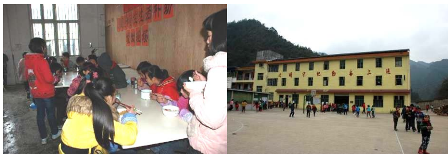
图 11 学生用餐图组