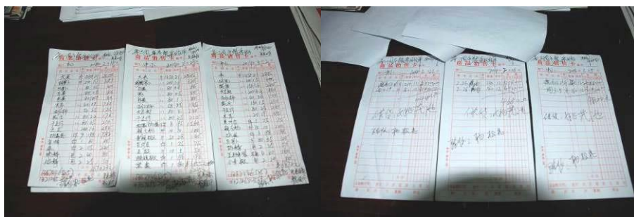
图 13 原始凭证