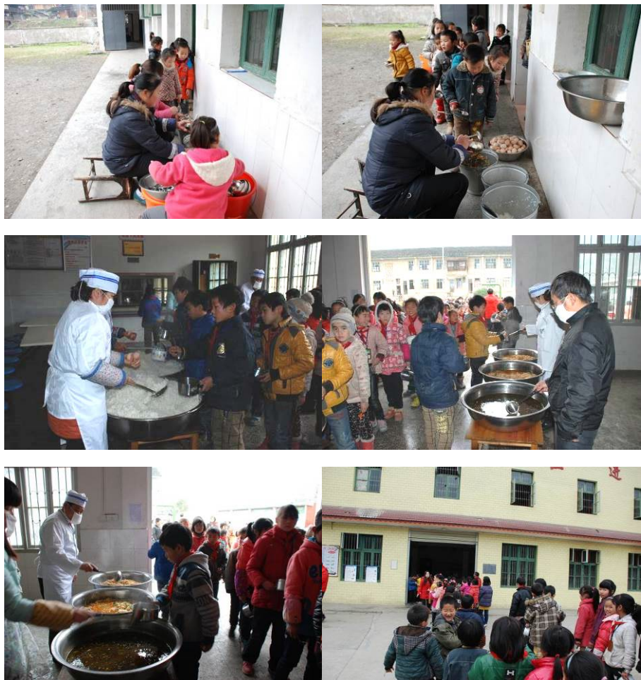
图 10 学生打餐组图