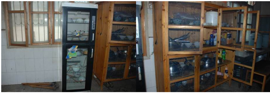
图 3 厨房图组