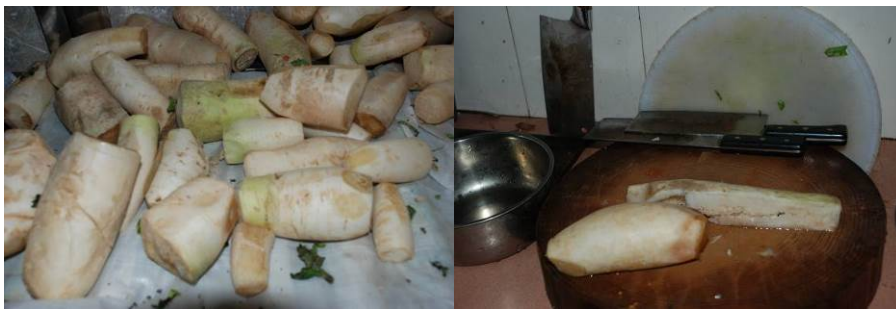
图 5 白萝卜有腐坏变质现象