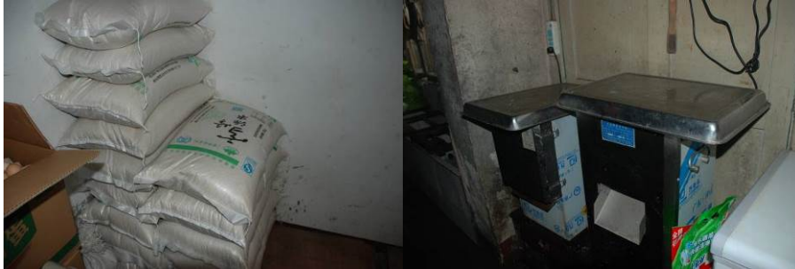
图 4 储藏食物摆放整齐有序