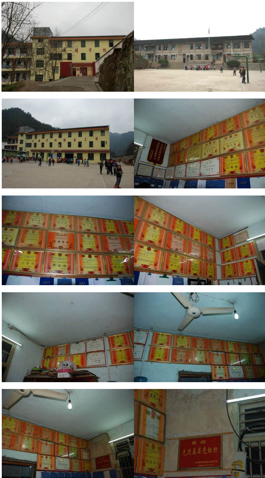
图 2 学校内景及荣誉组图

学校因有寄宿生,早、午、晚餐都开餐,发给厨师工资 1300 元/人/月;收取寄宿生早、晚餐 3 元/餐,午餐不收取费用。