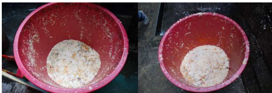
图 12 剩饭菜较少