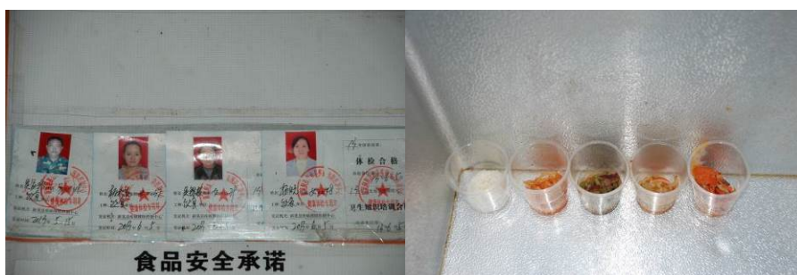
图 8 健康证及菜品留样