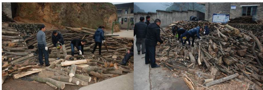
图 15 学校老师在蒙蒙细雨中砍柴火