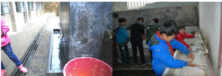
图 6 学校只有两个小洗手池（餐后学生自己在用凉水洗碗）