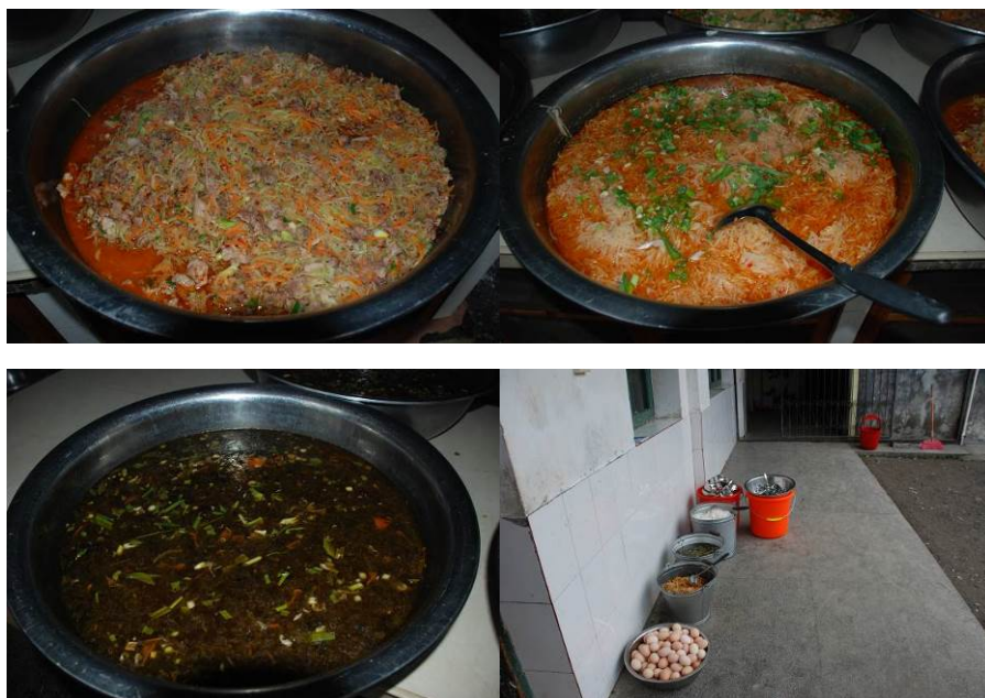
图 7 当天菜品