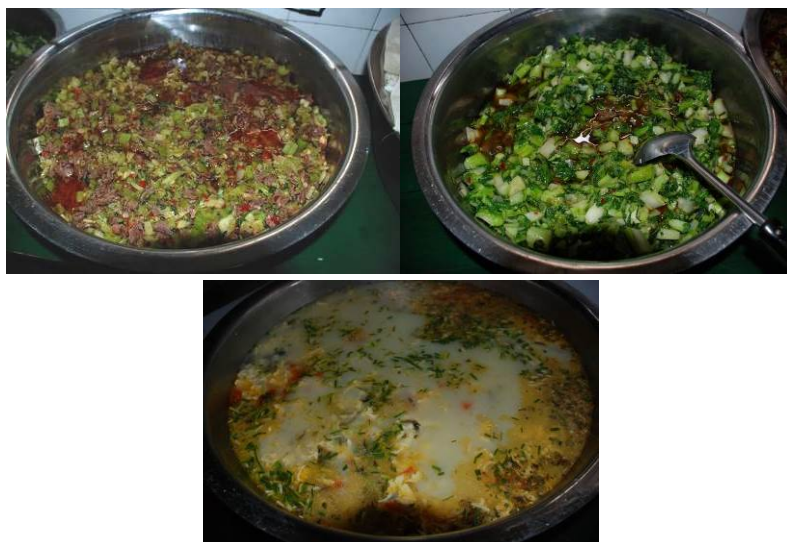
图 11 当天菜品

学校当天菜品是芹菜炒牛肉、炒白菜及鸡蛋汤，主食为米饭。菜品味道还好。(见图 11)