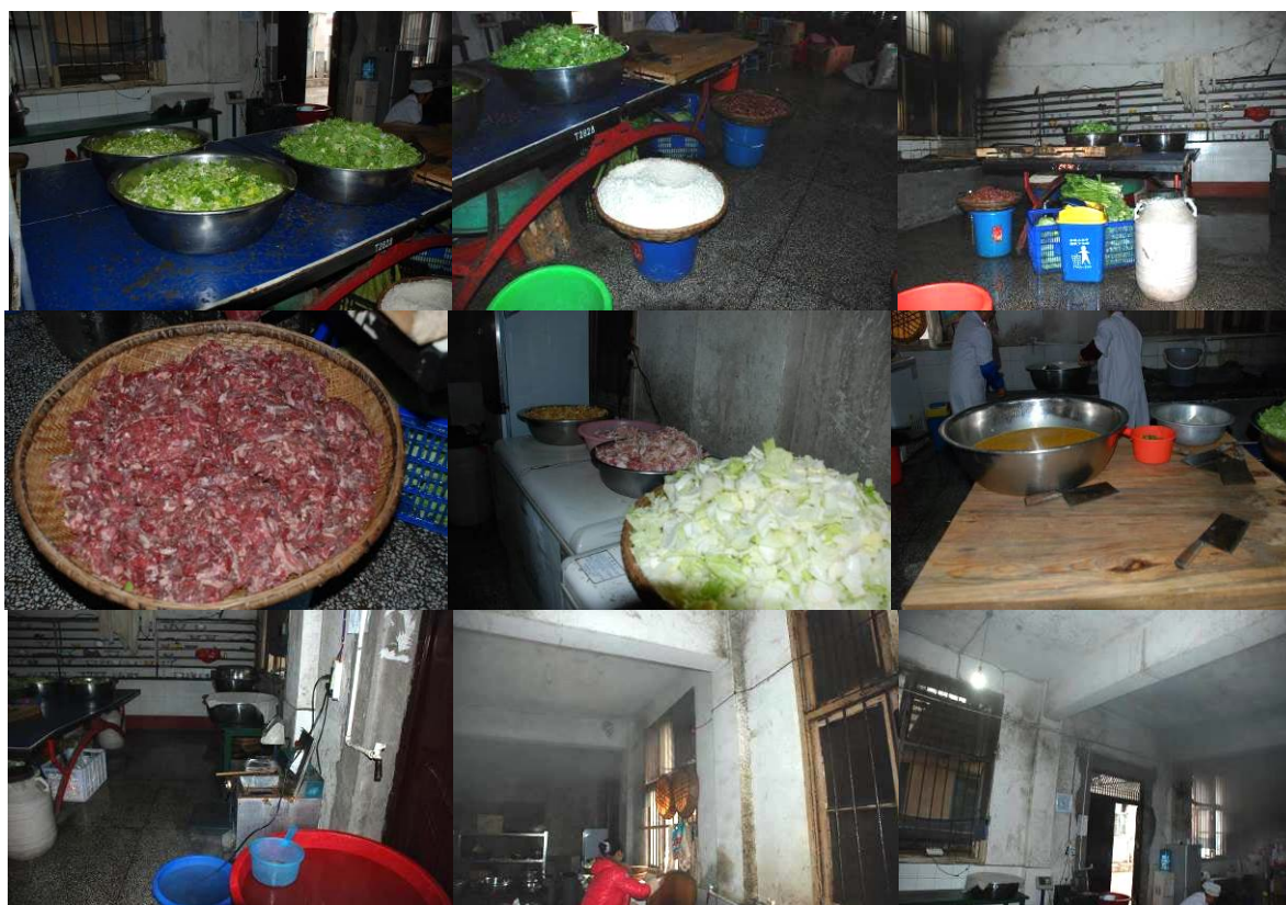
图 7 厨房及厨师图组