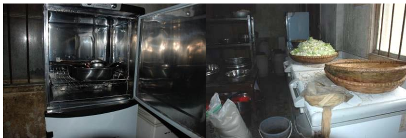
图 14 设备正常使用