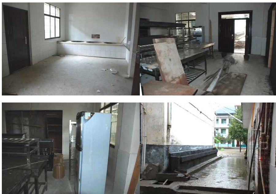
图4 新建食堂尚未竣工