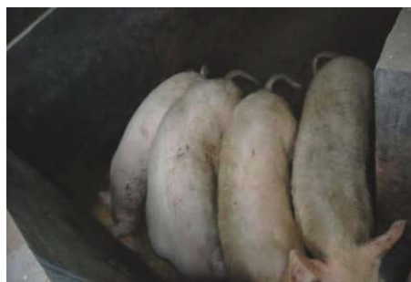
图 10 学校养了 4 头猪