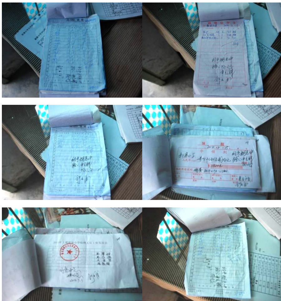
图 19 原始凭证