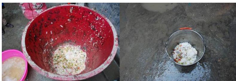
图 17 700 多人的剩饭菜（为调查者所去过学校最少，该校创造了一个奇迹）