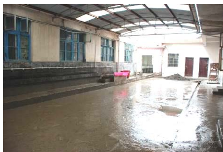
图 9 只有一个洗手池