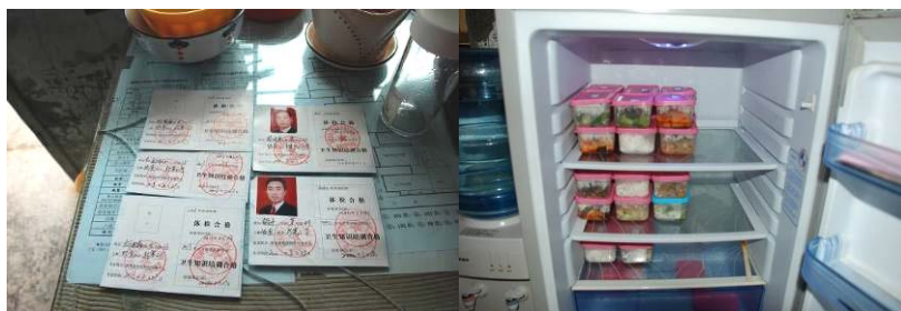
图 12 健康证 (大部分的都已过期)

“健康证”项扣除 4 分,扣分原因为大部分人的健康证都已过期,且未补办。(见图 12)