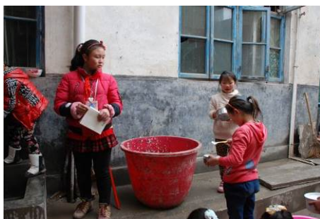
图 18 有值日生在泔水桶边登记浪费情况