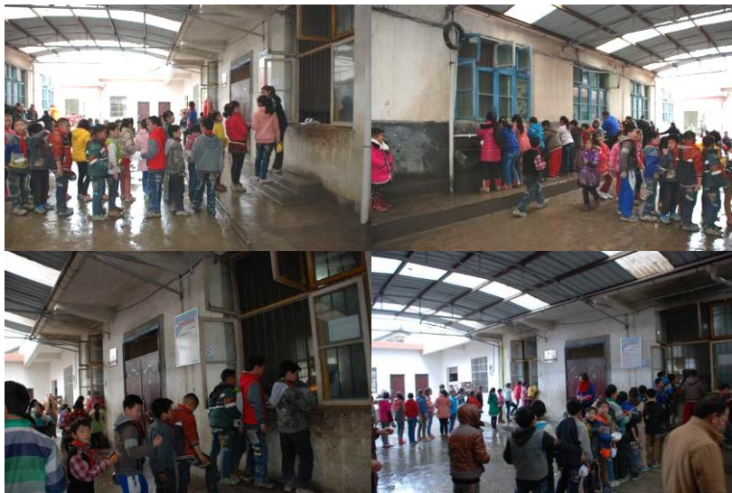
图 15 学生分餐时秩序井然