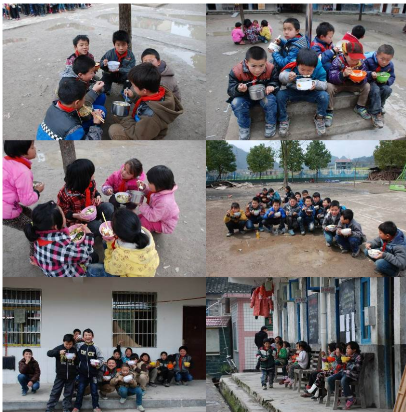
图 16 学生用餐图组