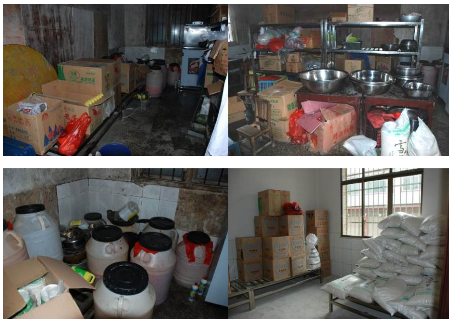
图 8 食物储藏图组 (未见腐败变质食材)