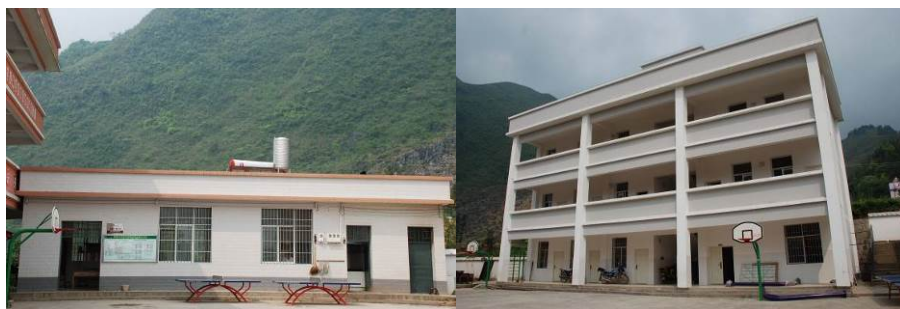
图 1 学校外观组图