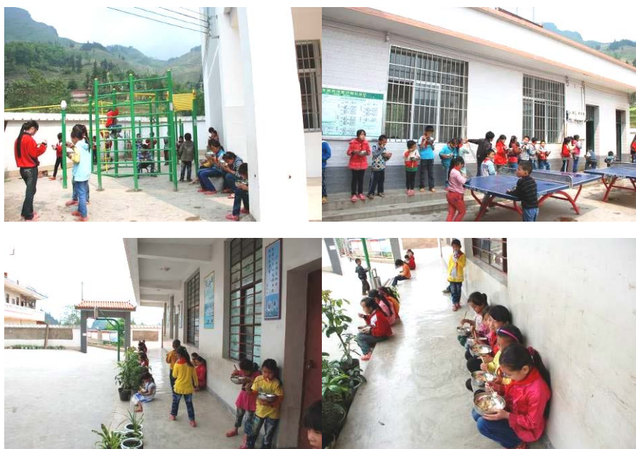
图 8 学生用餐图组