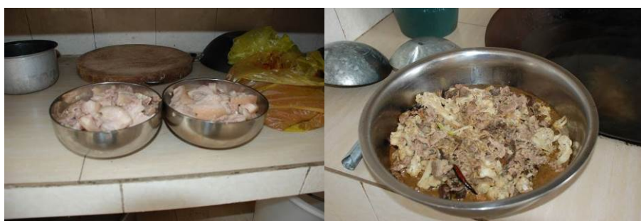
图 9 老师另加了两个菜