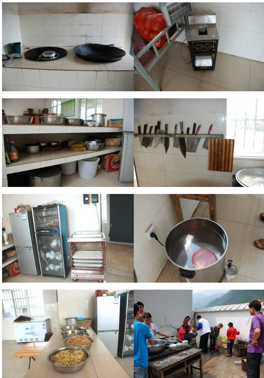
图 2 厨房及厨师图组（穿白衣者为厨师）