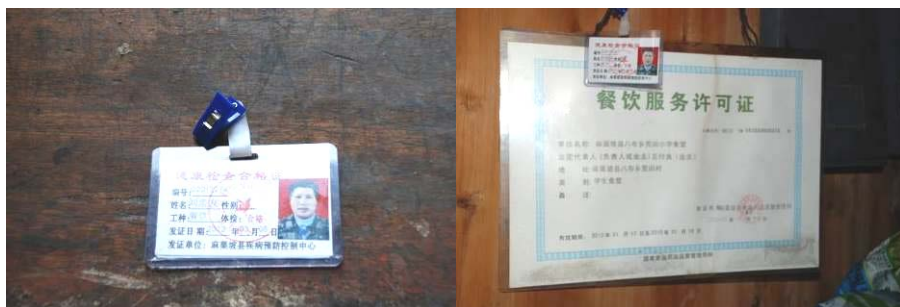
图 4 厨师健康证及相关证件 (有位厨师刚请来, 证未办)

(4) “师生同餐”项扣除 2 分, 扣分原因为学校老师另加了两个菜。校方解释说其中有个菜是猪内脏, 是买猪肉时商家赠送的, 猪内脏不适合给学生吃。(见图 9)