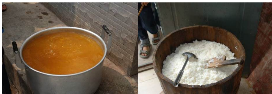
图 4 当天菜品