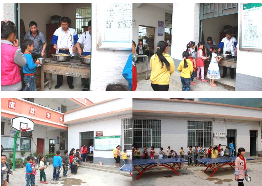
图 7 学生排队分餐图组