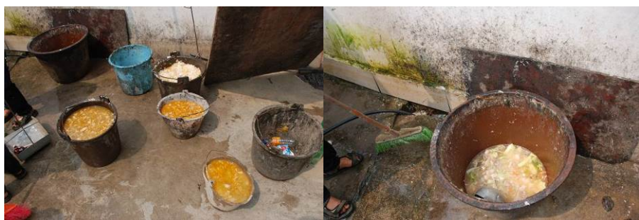
图 10 剩饭菜在正常范围