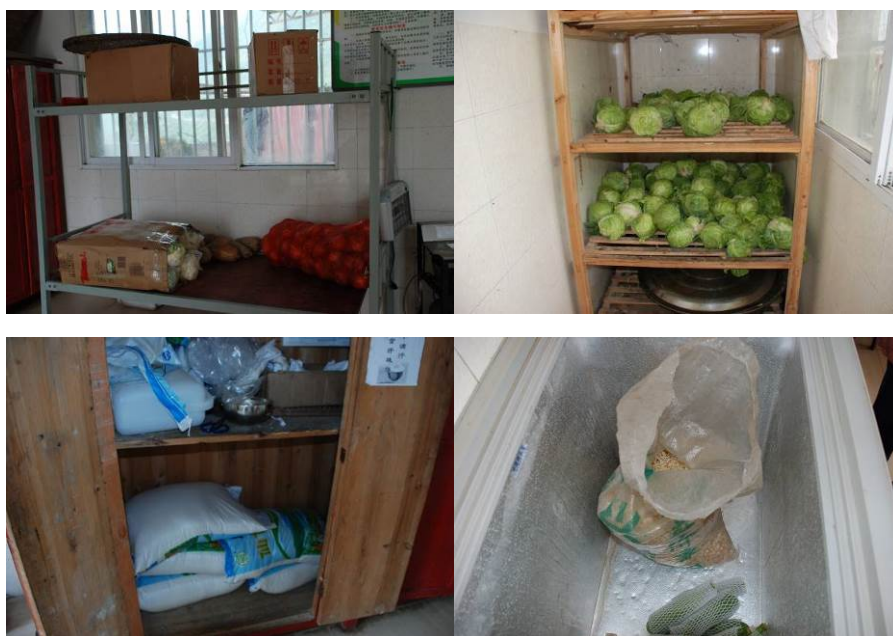
图 3 食材储存情况（未见腐烂变质食材）