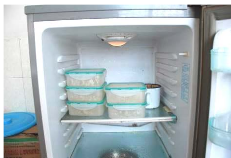
图 6 菜品留样不合规范 (没有贴标签)