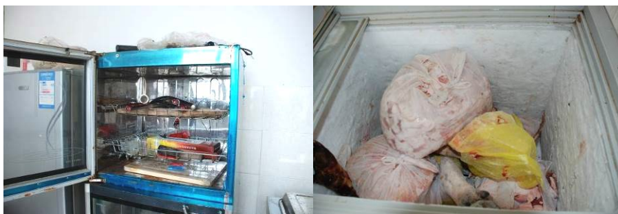
图 5 设备维护情况 (消毒柜未正常使用, 未接电当成了碗柜)