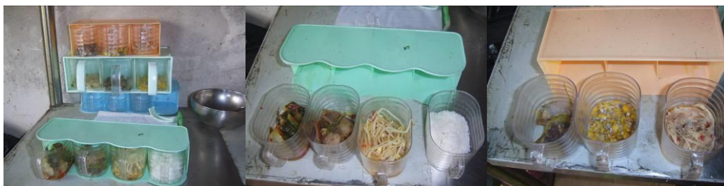
图 16 该校近期留样菜品组图

(1) “菜品留样”扣除 4 分, 扣分原因为菜品留样没有在冰箱冷藏存放, 存放在厨房货架上, 上一周的菜品留样也没有及时清理, 且已发霉长毛, 给厨房招来许多苍蝇和蚊子, 不同程度影响了厨房的环境卫生 (附图片)。