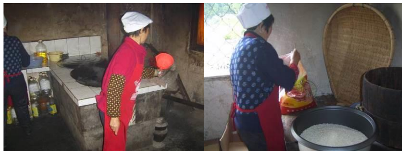
图10 厨师正规着装工作组图