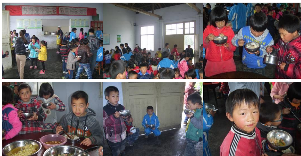
图 22 学生的用餐组图