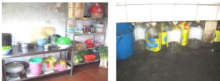
图 6 厨房工作台环境组图

(1) “厨房工作台”项得 1 分, 扣分原因为厨房有食材腐烂和三天前菜品留样仍放在货架上, 已变质发霉, 造成苍蝇蚊子乱飞。工作台下方有多个用完的空油桶没有及时清理 (附图片):