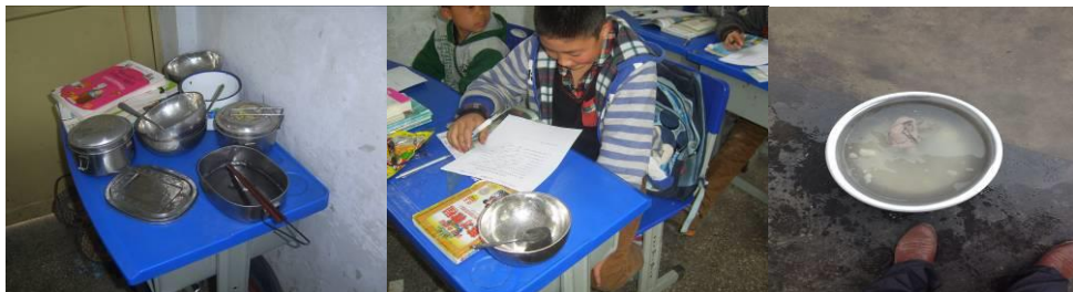
图8 学生餐具存放与清洗盆组图

(3) “是否消毒”项得3分, 扣分原因为学生餐具均由自己保存在教室或课桌里, 存在一定安全隐患, 且厨房工作人员为学生准备的洗碗盆里的抹布不太干净(见下图)。