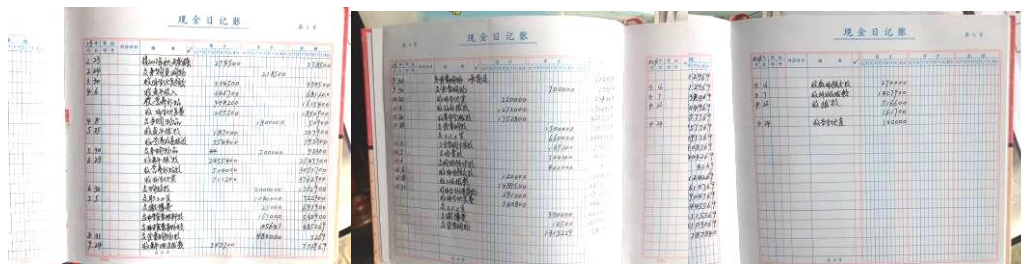
图 25 现金流水账

(4)“现金流水账”扣除 2 分,扣分原因为有现金流水账但不完整,今年的账目只有支出,没有其它信息(附图片)。