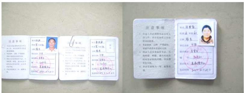
图 18 后勤主任与厨师的健康证组图