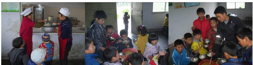
图 21 学生井然有序分餐组图