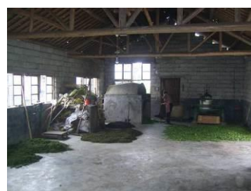
图 3 鹤峰县的农家茶业组图

五里乡六峰小学建校于 1957 年, 学校坐落在上六峰村, 原名为上六峰小学。2006 年动工修建了一栋学生食堂和一栋学生宿舍, 2009 年又新修了两层八间教学楼。投资 4 万余元把学校环境整改成一所花园式的学校。学校距五里乡政府约 20 公里左右, 距县城约 70 公里。全校共有学生 94 人, 其中寄宿生占 70 人。24 名走读生步行上学距校最远的约 2 公里, 距校 2 公里以外的学生每日由家长用摩托车接送。