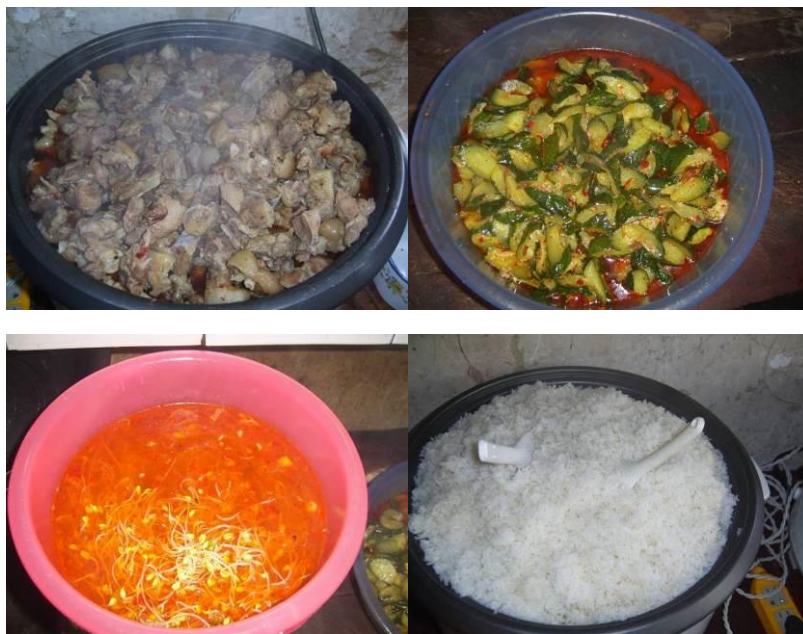
图 15 当日午餐菜品组图