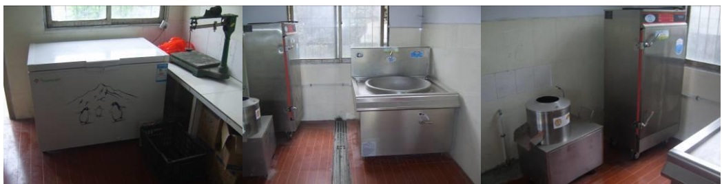
图 19 厨房的新设备组图

(只有冰箱在使用中, 其余设备暂无投入使用, 校方回应电压小带不动, 正在协调中)