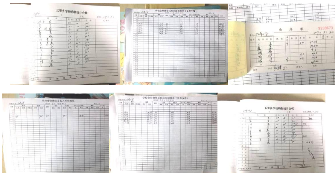
图 24 入库与出库登记组图

(3)“入库登记”和“出库登记”各扣除 2 分,扣分原因为出入库登记有好几份记录都不太完整,主要是相关责任人签字不完整(附图片)。