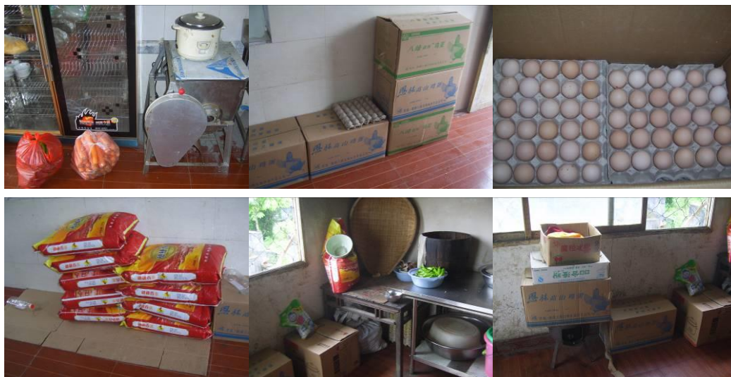
图 13 食材隔离储存组图