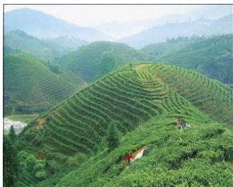
图 2 鹤峰县的茶山图

鹤峰县位于恩施州东南部与湖南省毗邻, 又称“湘鄂西”。县域面积 2892 平方公里, 人口 22.02 万, 辖六乡两镇和一个开发区。古称拓溪、容米、容阳, 曾是容美立司治所, 1735 年改土归流后先后设置为鹤峰州、鹤峰县。鹤峰水资源人均占有量、茶叶产量、磷矿蕴藏量位居湖北省首位, 古生物化石、百鹤玉世界罕见。是“华中天然药库”的重要组成部分, 有各种中药材 1800 余种; 有丰富的野生动植物资源, 是第四纪冰川孑遗植物保留地, 森林覆盖率达到 46.4%; 还有世界独有的人间珍品“葛仙米”。鹤峰文化底蕴丰厚: 以明清之际“田氏诗派”为代表的文人创作使土家族文学发扬光大; 撒尔嗬、摆手舞、柳子戏、穿号子、四道茶、傩戏等民俗文化源远流长。