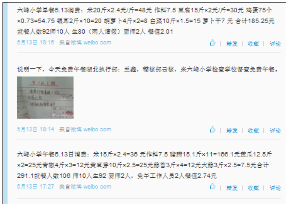
图5 该校调查当天微博公示截图