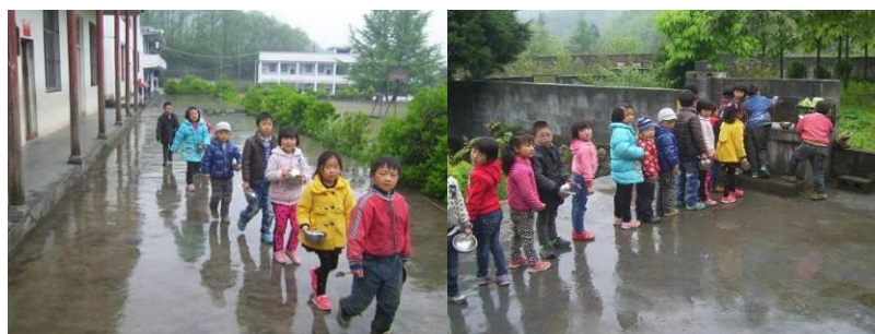
图 14 学生餐前自觉洗手洗碗组图