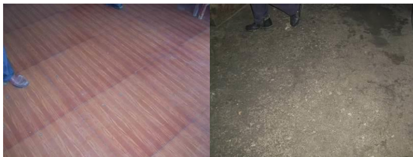
图 12 厨房地面卫生比较干净整洁