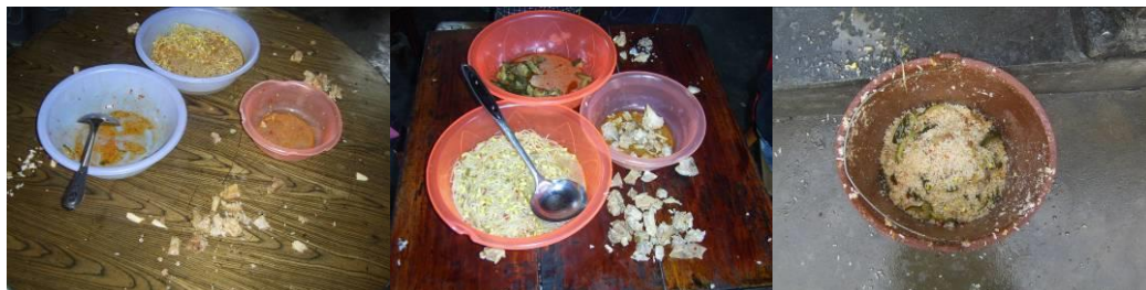
图 17 剩菜剩饭情况组图

(3) “浪费情况”扣除 2 分, 扣分原因为泔水桶内的剩菜剩饭不是太多, 但餐桌上的剩菜 (豆芽) 较多, 证明大多数学生不太喜欢吃豆芽 (附图片)。