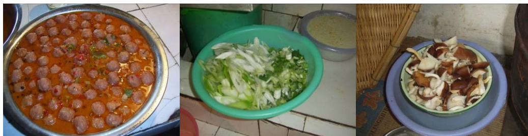
图 11 工作台生熟食分离存放组图