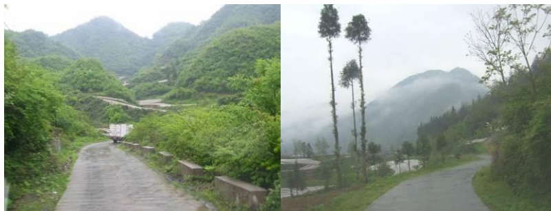
图 1 路况图

5 月 13 日, 上午 7:00 与执行人员兰鑫一同从鹤峰汽车站乘发往走马镇的乡村班车至五里乡 (车票 25 元), 转乘至六峰的乡村班车 (车票 10 元), 10:30 到上六峰村, 进六峰小学, 对该校进行调查。下午 13:30 是末班车, 提前留了司机电话, 让司机等到 14:00 调查结束后乘乡村班车至五里乡 (10 元), 再转乘至鹤峰的班车返回县城 (票价 25 元), 夜宿万豪酒店 (住宿费 138 元/天)。