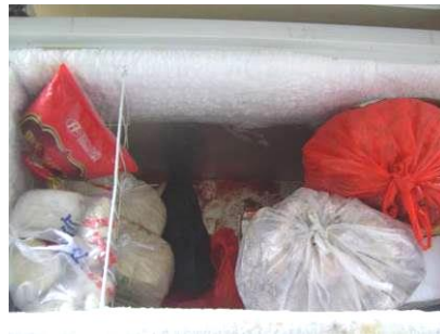
图7 冰箱食材储藏图

(3) “是否消毒”项得3分, 扣分原因为学生餐具均由自己保存在教室或课桌里, 存在一定安全隐患, 且厨房工作人员为学生准备的洗碗盆里的抹布不太干净(见下图)。