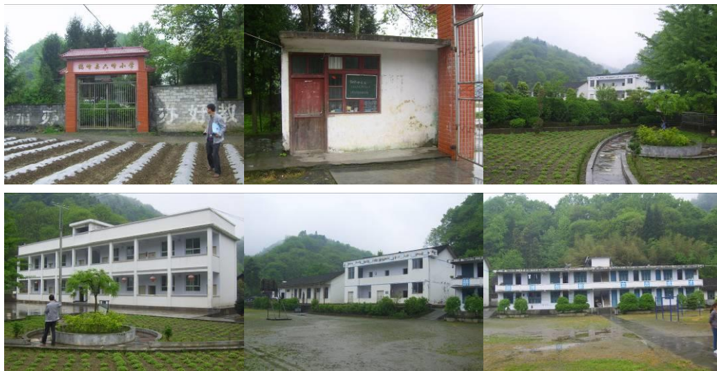
图 4 学校环境组图

该校现有 6 个年级, 7 个教学班, 为一至六年级和学前班, 共有学生 94 人; 教师 10 人, 厨师 2 人。