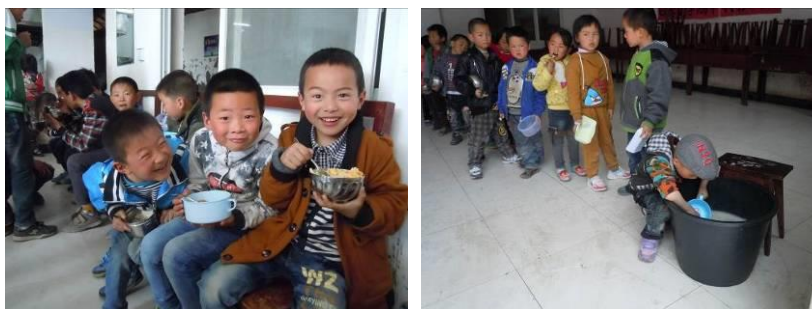
图 8 午餐就餐组图