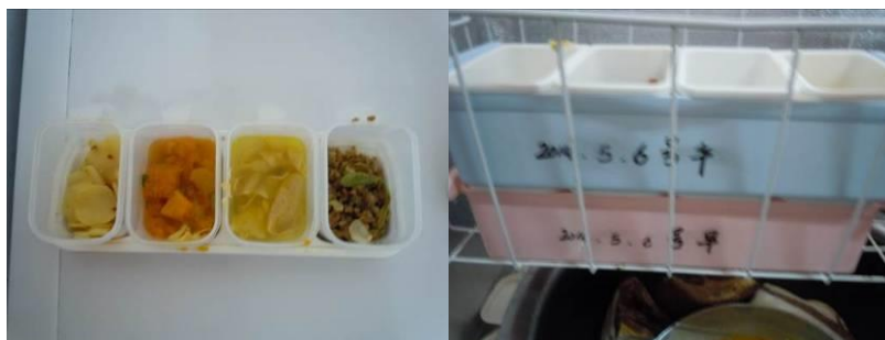
图 10 调查当日查见的食品留样

关于“菜品留样”,调查当日,调查人员查看了该校调查前一日食品留样,注意到该食品留样取样不规范,未对米饭进行取样,用于取样的留样盒均没有盖上盖子,存污染隐患,同时未建立食品留样工作记录表,视为无效留样,根据评分规则该项评分取 1 分(图 11,同时有现场沟通录音);