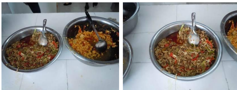
图 9 午餐就餐结束后剩下的菜品