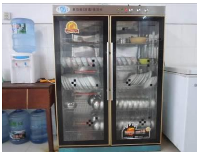
图 4 存放着教职工餐具的消毒柜

关于“餐具消毒”，调查当日，调查人员注意到该校厨房有一台双门高温消毒柜，但消毒柜里面的餐具主要为教职工餐具，其余少量餐具为学前班餐具。陪同调查人员的老师称消毒柜暂不能承担全校餐具统一消毒，故实行轮流消毒，每个班每周可轮流消毒两次，但因为未能出示消毒记录，暂不能认定该校日常执行了餐具消毒，故根据评分规则该项取 1 分（见图 4）；