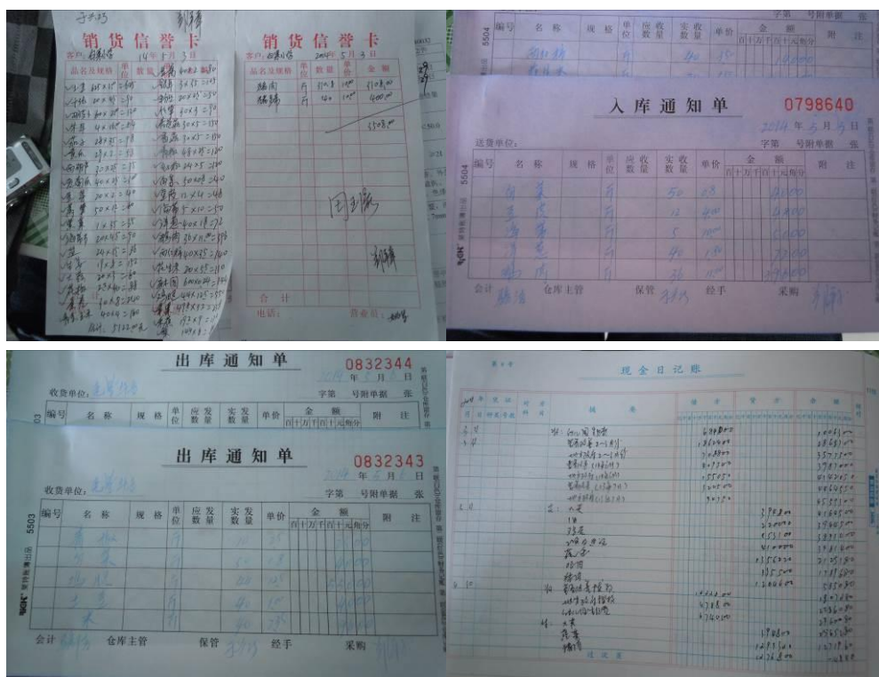
图 12 食堂日常管理账目