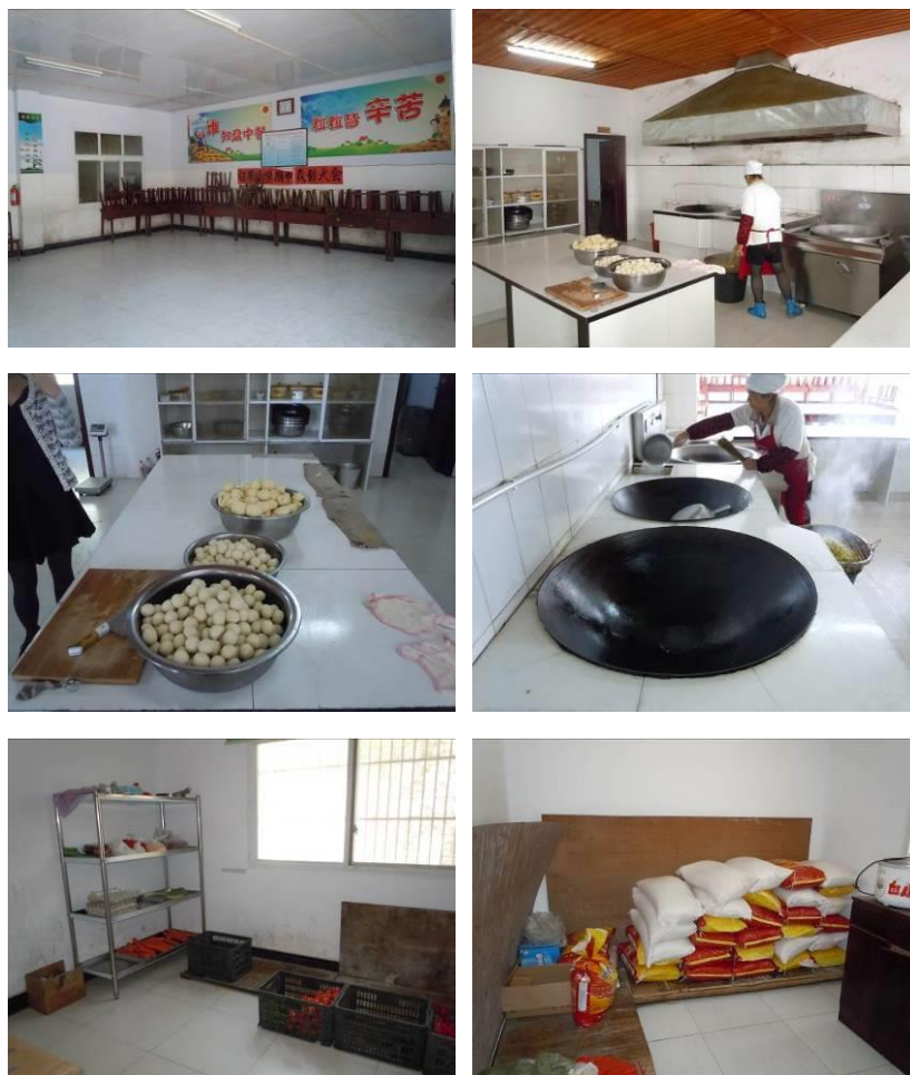
图 6 厨房及储藏室组图