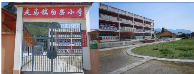
图 2 学校大门及校园环境