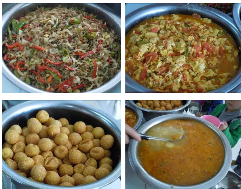
图 7 调查当日午餐饭菜