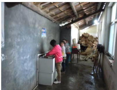
图 5 学生就餐结束后正在清洗餐具

关于“餐前洗手”，调查当日，调查人员注意到该校学生就餐前均未进行洗手，在该校食堂餐厅后面有一排水龙头，用水正常，但只是供学生就餐结束后自行清洗餐具使用，就餐前均没有学生前去洗手，故根据评分规则该项评分取 1 分（见图 5）；