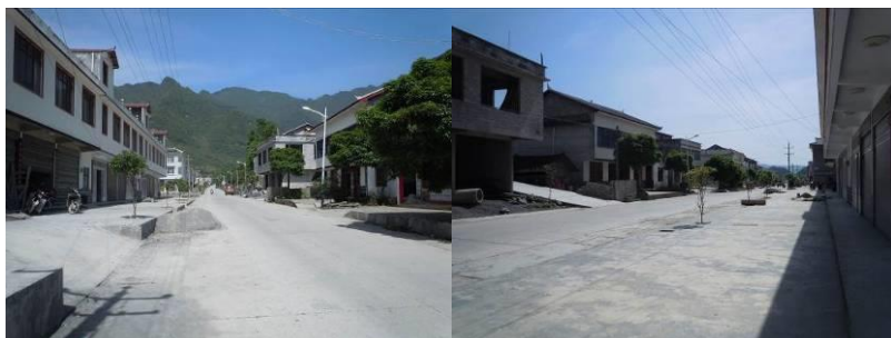
图1 白果小学周边路况

5月7日上午,调查人员步行至鹤峰县益通客运站,乘坐前往走马镇的客运班车,约2小时左右抵达走马镇(30元),随后换乘三轮摩托车前往走马镇白果小学,约10分钟后抵达学校门口。自走马镇至白果小学方向路况良好,全程硬化路面。结束对该校的调查后,因离校时没有车经过,遂步行了大约5公里后搭乘到一辆三轮摩托车回到走马镇,换乘客运班车回到鹤峰县城(30元)。