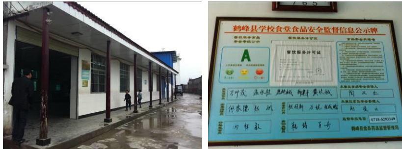
图 3 厨房外景及食品安全公示牌组图

该校的餐具消毒工作，学前班和一至三年级学生的餐具是由学校统一保管消毒，四、五和六年级等六个教学班学生的餐具是自行保管，无相关消毒环节。