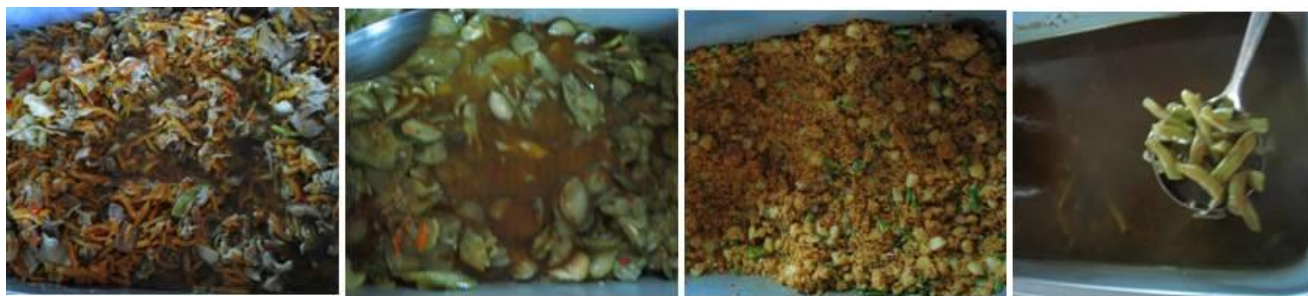
图 8 当天菜品组图

调查当天，该校的菜品是胡萝卜炒肉、炒黄瓜、土家炸辣椒、四季豆汤和米饭，与该校当天微博公示的菜品一致。调查人与老师、学生共餐。调查人查看了该校的微博公示菜品和本学期的菜品留样登记表，发现该校的菜品的种类丰富。就餐过程，并在校园随机咨询了若干学生，都反映每天都能吃饱。调查当天，用餐人数 741 人，使用肉 82 斤、米 150 斤，人均分别为约 55 克、约 101 克，即肉人均达到 1 两、米饭 2 两。