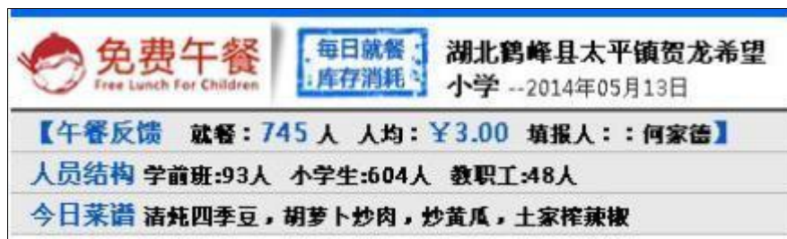
图 2 就餐人数的微博截图

当日就餐人数: 学生 694 人+厨师 6 人+老师 41 人=741 人。学生应到人数比该校微博公示的人数少 4 人。调查当天实际就餐人数与该校当天的微博公示人数也不一致。