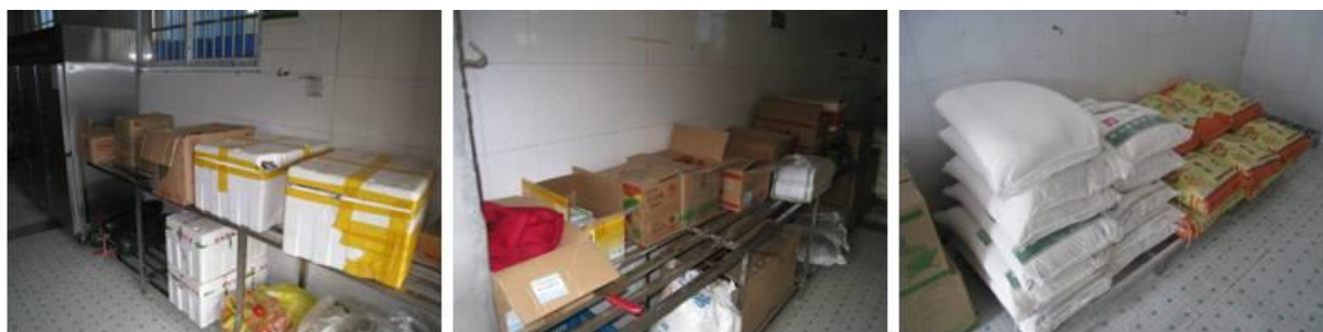
图 6 该校食材储藏间情况组图