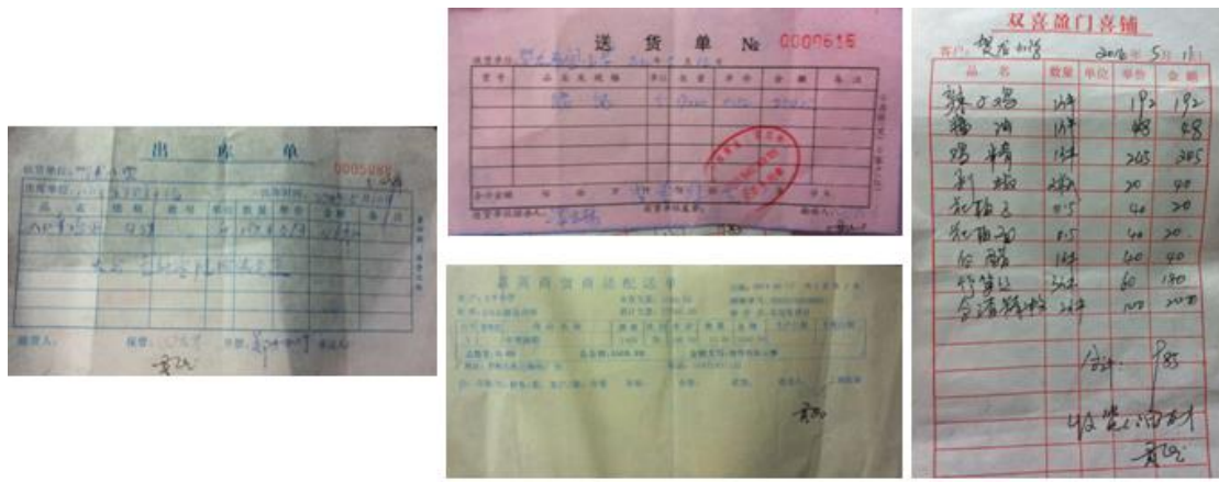
图 11 该校采购原始凭证组图