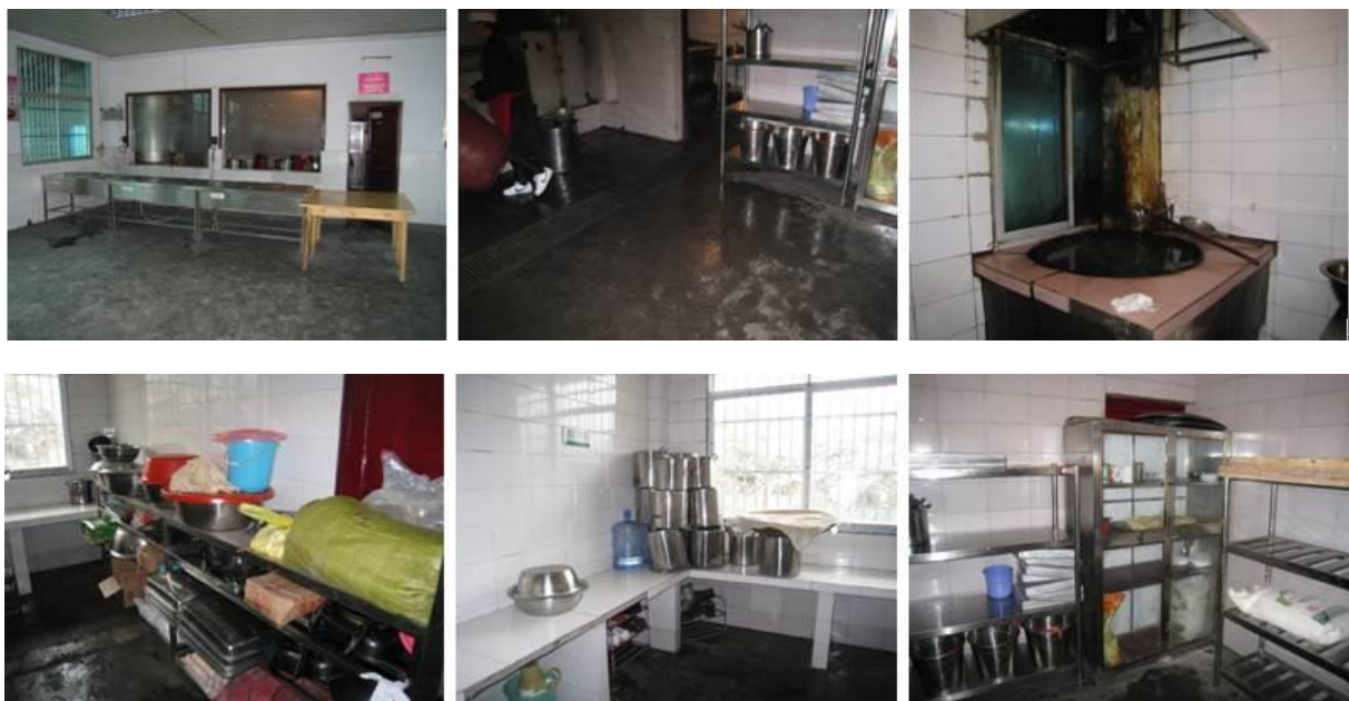
图 5 厨房情况组图