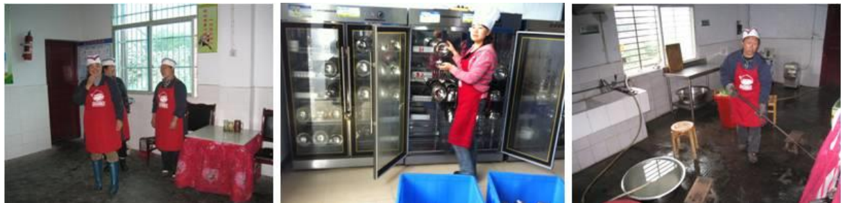
图 4 该校厨师情况组图