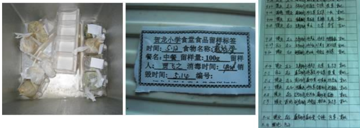
图 10 该校菜品留样情况组图