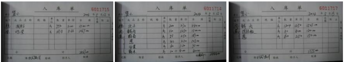
图 12 该校入库登记表组图