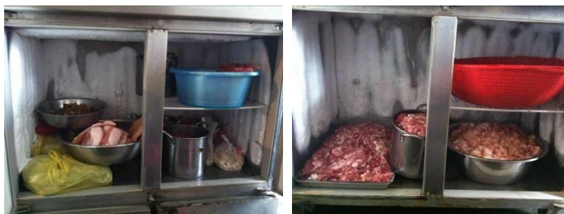
图 7 该校工作台食材存放情况组图

(7) “餐前洗手”项得 3 分，理由是校园内具备餐前洗手的条件，但调查人观察，学生下课后，到排队领餐过程，只有为数不多的学生进行了餐前洗手。