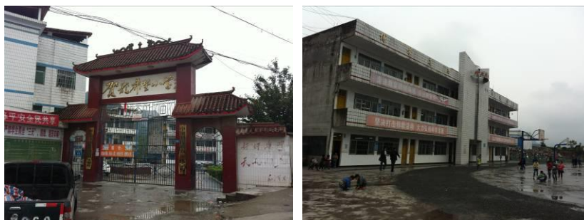
图 1 学校内景外景组图

该校校长：陶双红，全面负责该校免费午餐项目工作；赵凌云，后勤主任，学校会计岗，负责项目账目管理工作；何家德，教师，负责学校微博公示工作；贾飞之，教师，学校财务出纳岗，负责项目资金支持、食材采购和食品留样监督等工作；田有才，教师，与贾飞之老师一起负责食材采购工作。