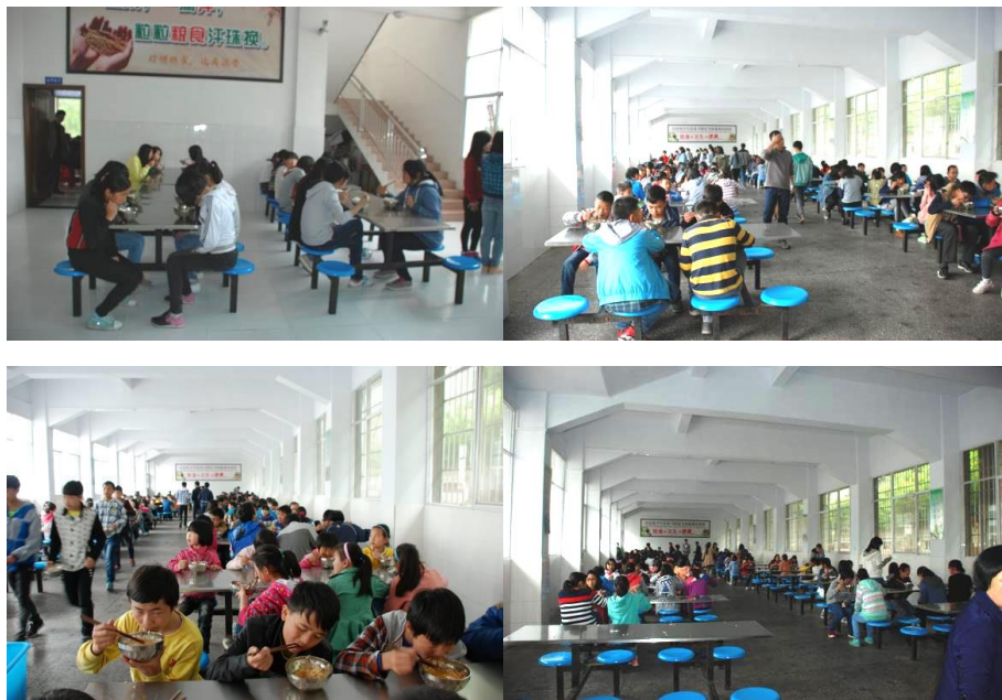
图 13 学生在餐厅用餐图组