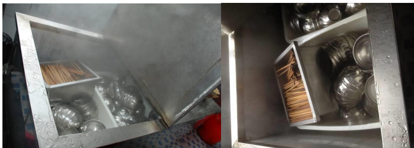
图 4 蒸汽消毒柜

(2) “餐前洗手”项扣除 2 分，扣分原因为学生人数众多，洗手条件有限，只有小部分学生自觉餐前洗手；（见图 6）