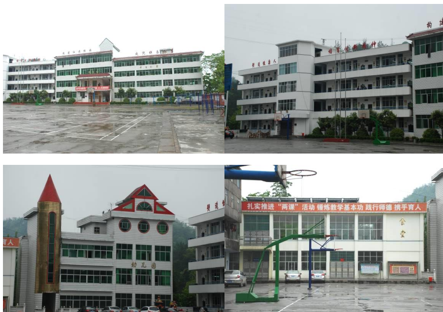
图 1 学校外观组图