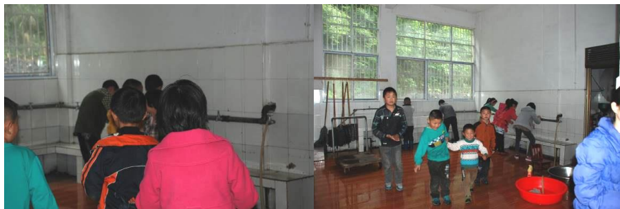
图 6 少部分学生餐前自觉洗手