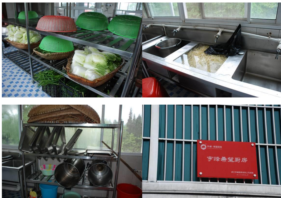
图 5 厨房及厨师图组