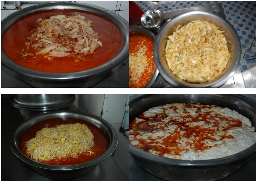
图 8 当天菜品