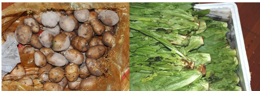
图3 发芽土豆和腐烂的油麦菜