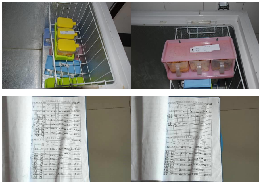
图11 菜品留样不合规范（有留样记录）