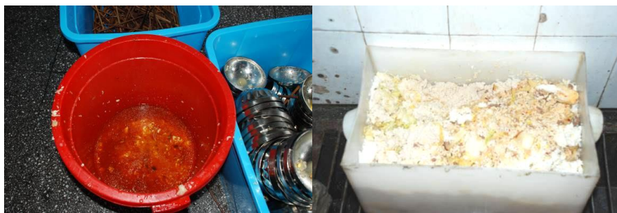
图 15 剩饭菜在正常范围