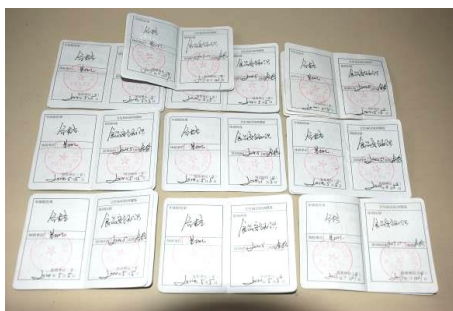
图9 健康证（10位厨房工作人员健康证齐全且在期内）