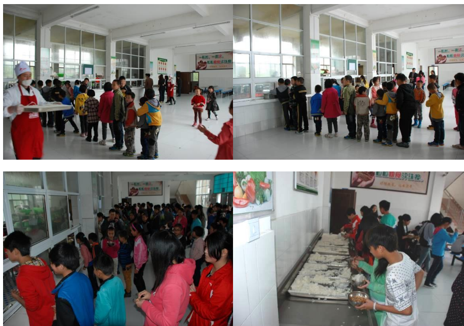
图 12 学生排队分餐图组（秩序良好）