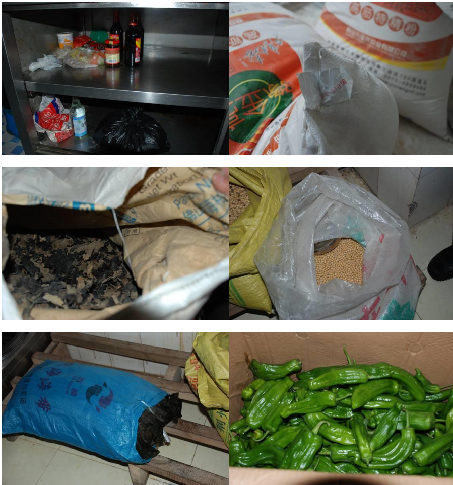
图7 食材储存图组（储存环境良好）