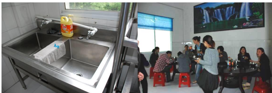
图 14 教师厨房及餐厅（教师有厨房但当餐未启用，教师在自己的餐厅用餐）