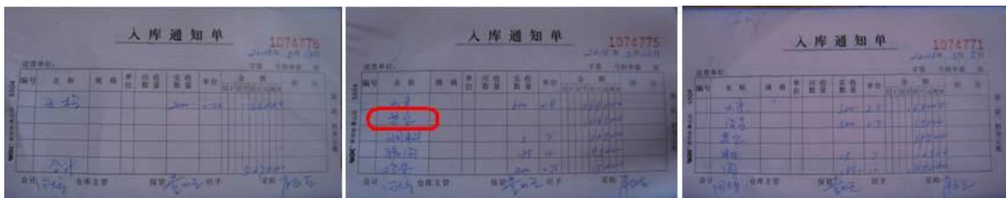
图 9 该校入库通知单组图

该校的大米和食用油等大宗采购的食材均是从上级教育主管部分指定的商家采购。调味品、干货和时令性蔬菜一般在附近集镇采购，一般为一周采购一次。调查人在该校调查期间，该校提供的涉及本环节的登记表有《入库通知单》、《出库通知单》、《采购单》和现金支付凭证等四个。