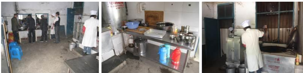
图 2 厨房情况组图

着工作服, 卫生情况良好。该校的食材储藏间位于操作间隔壁, 双人双锁管理, 储藏间采光、通风条件良好, 所藏食材均做了简单的分类、隔离和地面防潮处理。学生餐前洗手环节, 校园有专门的洗漱池, 供学生餐前洗手和清洗餐具。学生餐具自行清洗, 学生自行保管。