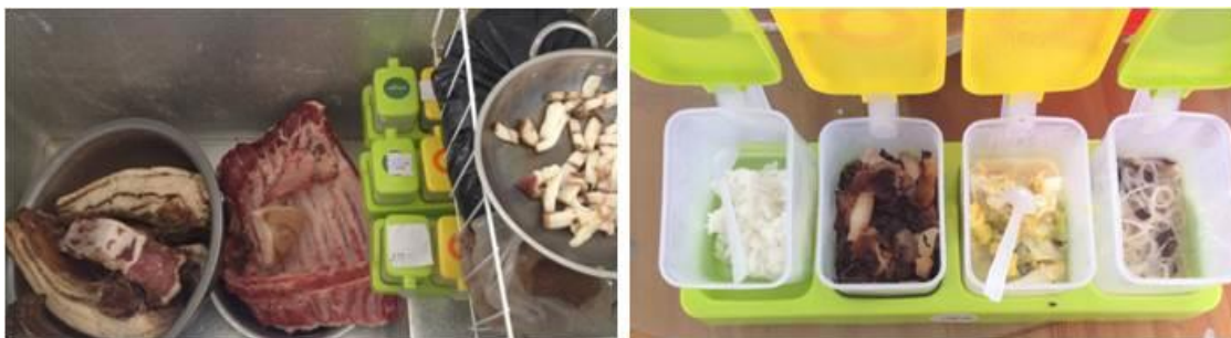
图 7 该校食品留样情况组图