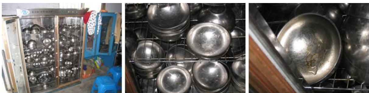
图 4 消毒柜情况组图