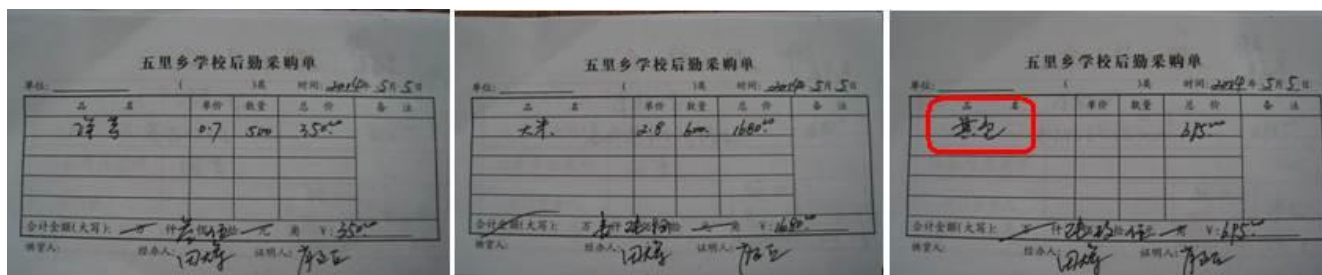
图 11 该校采购单组图