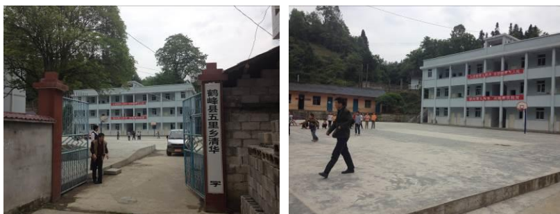
图 1 学校内景外景组图

该校校长: 朱美琼, 全面负责该校免费午餐项目工作; 田大军, 后勤主任, 学校会计岗, 负责项目账目管理工作; 王洪霞, 副校长, 负责学校微博公示等工作; 文峰, 教师, 学校财务出纳岗, 负责项目资金支持工作; 董明光, 负责食材储藏室食材管理和出入库等工作。