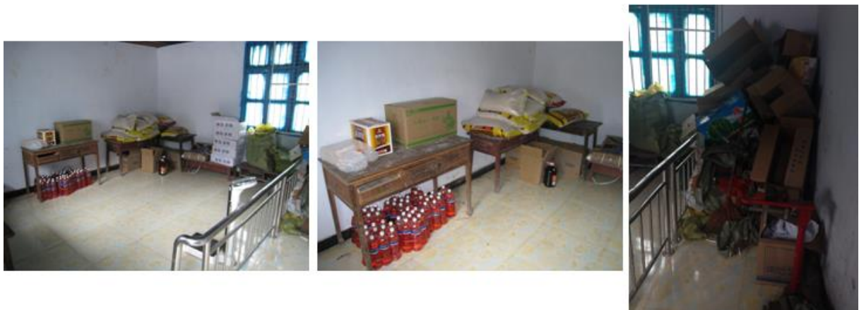
图 3 食材储藏间情况组图