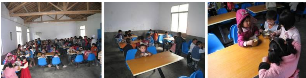
图 6 学生洗手、排队、领餐和用餐情况组图