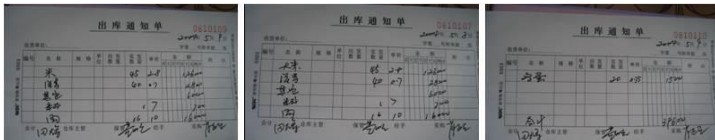
图 10 该校出库单组图