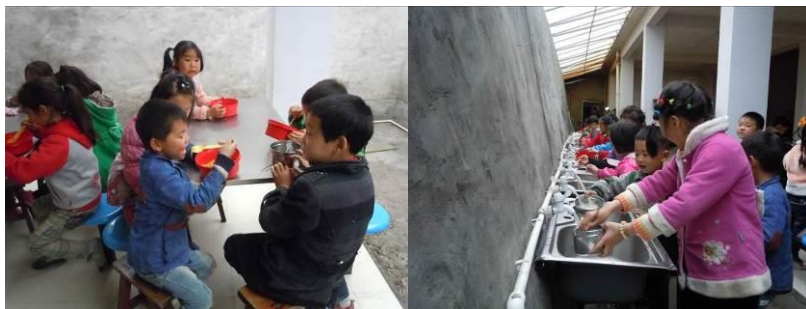
图 8 午餐就餐组图