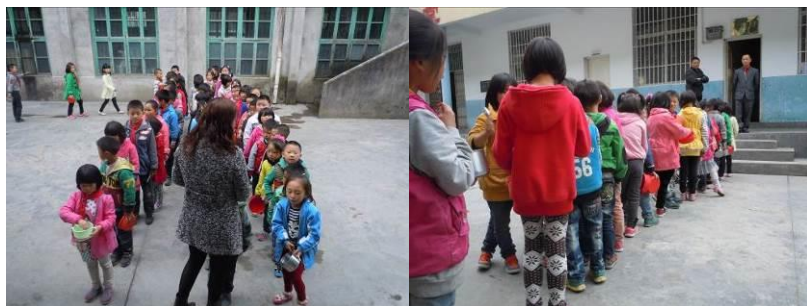
图 5 正在排队等待就餐的学生

关于“餐前洗手”，调查当日，调查人员注意到该校学生就餐前均未进行餐前洗手，现场维持就餐秩序的老师也没有引导学生就餐前洗手，故根据评分规则该项评分取 1 分（见图 5）；