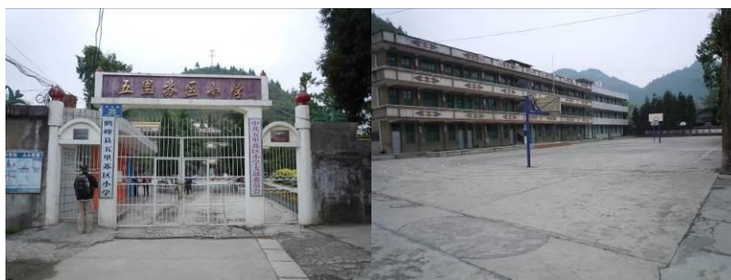
图 2 学校大门及校园环境