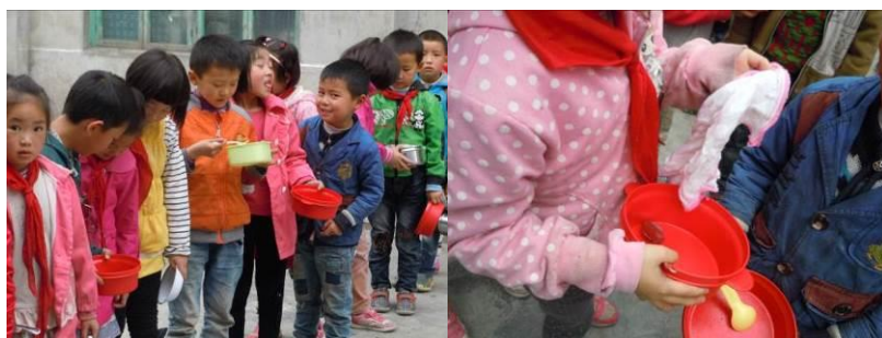
图 4 自带餐具就餐的学生

关于“餐具消毒”，调查当日，调查人员在该校食堂餐厅见到一台双门高温消毒柜，但里面存放的餐具均系教职工餐具，调查人员注意到该校所有的学生餐具均系自行清洗自行保管。在当日午餐就餐时，调查人员注意到部分学生还带了洗碗布，就餐结束后自行清洗餐具并带回教室保管。据此，调查人员认为该校日常没有执行餐具消毒，根据评分规则，该项评分取 1 分（见图 4）；