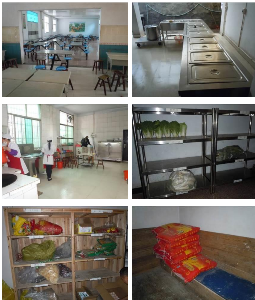
图 6 食堂餐厅、厨房、储藏室组图