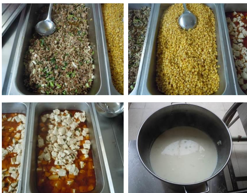
图 7 调查当日午餐菜品