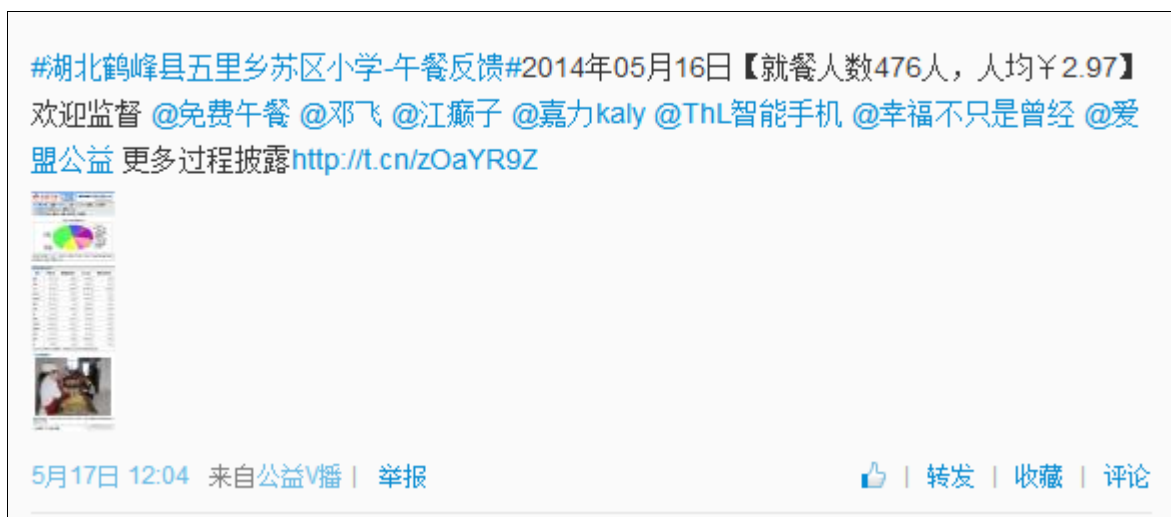
图 3 调查当日学校微博午餐就餐反馈公示截图

调查人员现场见到炊事员 4 人, 该校负责后勤管理的朱永怀老师向调查人员提供了该校教师应到人数 36 人, 当日在岗 35 人。该校当日午餐实际就餐人数为: 学生 436 人 + 教师 35 人 + 炊事员 4 人 = 475 人, 该校微博发布的调查当日午餐就餐反馈显示实际就餐人数 476 人, 与调查人员现场清点人数基本一致, 微博截图如图 3;