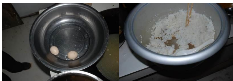
图 6 当天菜品