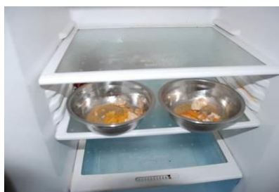
图9 菜品留样不合规范