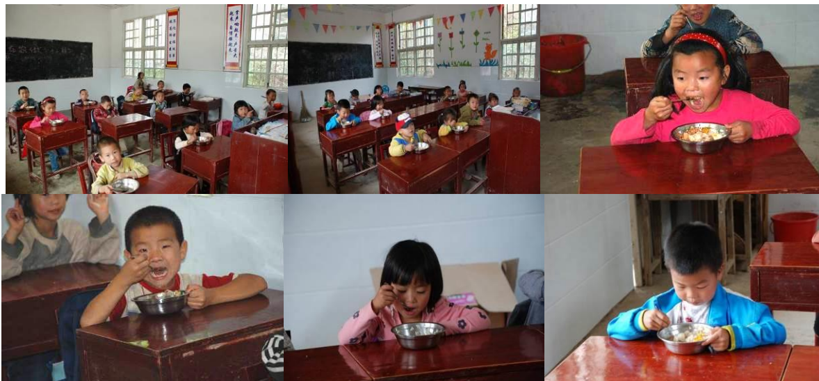
图10 学生在教室用餐