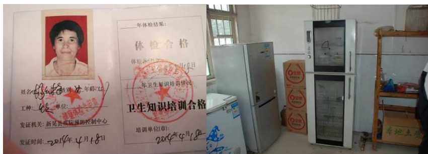
图 7 厨师健康证在有效期内

“菜品留样”项扣除 5 分，扣分原因为学校菜品留样为无效留样，所有菜品都只留一点点，且同放在同一器皿中，没有密封，主食没有留样。