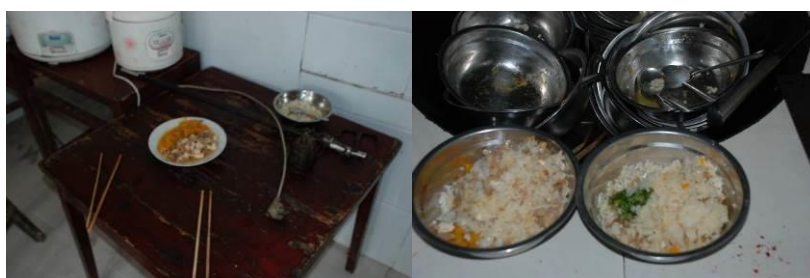
图11 老师和学生吃同样的菜品