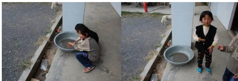
图 5 学生餐前自觉洗手