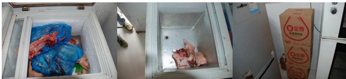
图 4 食材储存