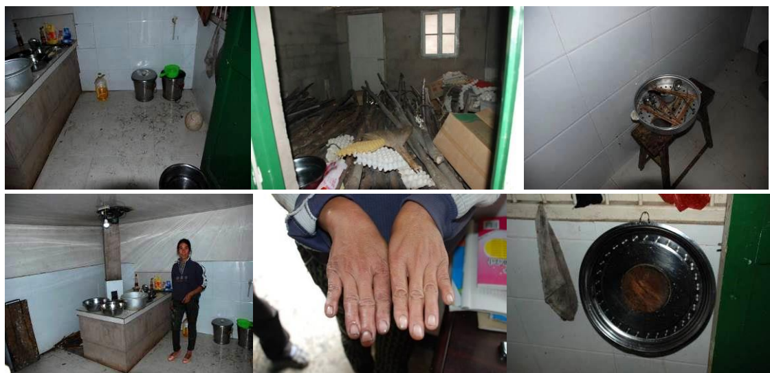
图 3 厨房及厨师

(2) “墙面地面卫生”项扣除 2 分，扣分原因为厨房地面不太干净。（见图 3）