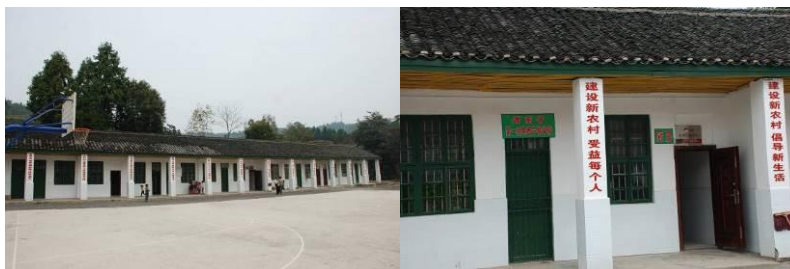
图 1 学校外观

免费午餐于 2011 年 4 月 27 日在该校正式开餐，是湖南省第一所免费午餐开餐学校。中国社会福利基金会免费午餐基金向该校提供一笔开餐资金（用于购置冰箱等或厨房用品等），以及现在 1 名厨师 800 元/月的工资及 3 名教职工 3 元/人/餐的午餐费。现 13 名小学生有由国家营养改善计划提供 3 元/人/餐的午餐费，免费午餐向 16 名学前班儿童提供 3 元/人/餐的午餐费。