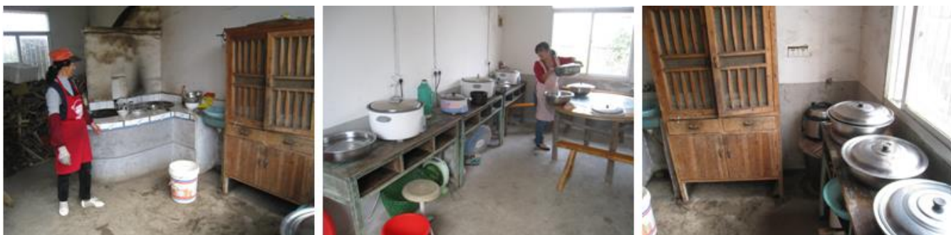
图 3 厨房工作间情况组图

该校的厨房是位于教学楼一侧的两间平房, 一间为灶台所在的操作间, 另一间是辅操作间, 也是备餐间、电饭锅等电器炊具的使用间, 同时还兼具教师简易餐厅功能。到校后, 调查人查看了学校的厨房, 灶台所在的操作间由于是柴火做饭, 墙面有部分灰尘, 地面干净整洁, 灶台、工作台等均干净。查看期间, 两位厨师着标准工作服在备餐、个人卫生情况良好。学生餐具是由厨房统一清洗、统一消毒、统一保管。蔬菜类食材在辅操作间存放, 做了隔离处理, 肉类食材在冰箱中存放, 做了密封处理, 无腐败变质情况。学生餐前洗手环节, 教学楼中设有专门的洗手池, 学生们在餐前主动洗手。