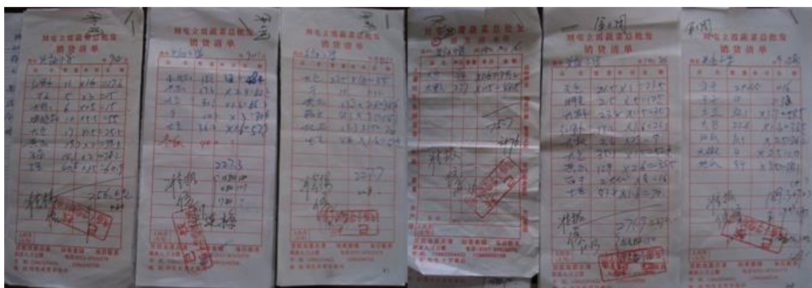
图 6 该校新学期以来原始凭证组图

该校涉及资金管理环节的凭证只有一种，但是核算和管理方式兼具了入库和现金流水账的功能，做法值得肯定和推荐。该校的采购原始凭证有两种，一是如图 7 由砖桥镇集市相对固定供货商提供的《食材销售清单》，二是如图 8 从本村农户采购的，由校方自行设计的《购菜清单》。两种凭证都有售货人信息、校方经手人信息和学校负责人审核、开支的确认信息。据介绍，该校的原始凭证都是一周一对账、及时审、结算，学校还专门制作了食堂资金核算合格的印章。从现场查看该单证实物的情况看，真实度很高。该校的出库环节是微博公示进行登记，据介绍，该校是根据每周的食谱安排进行采购，一周采购两次，除土豆、肉以外，每种食材只做一餐，便于核算出库。