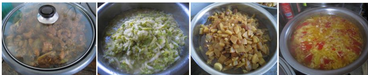
图 4 学生当天菜品组图