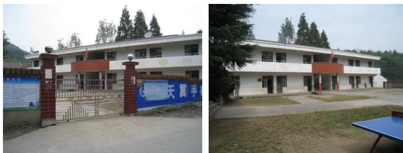
图 1 学校内景外景组图