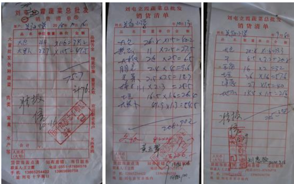
图 7 砖桥镇集市采购原始凭证组图