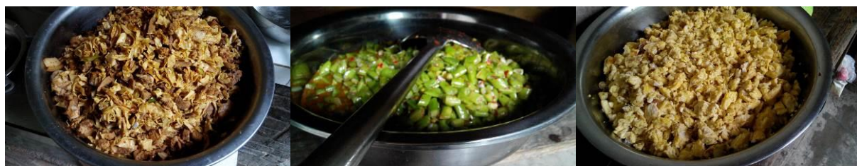
图 10 当日午餐 (学生)