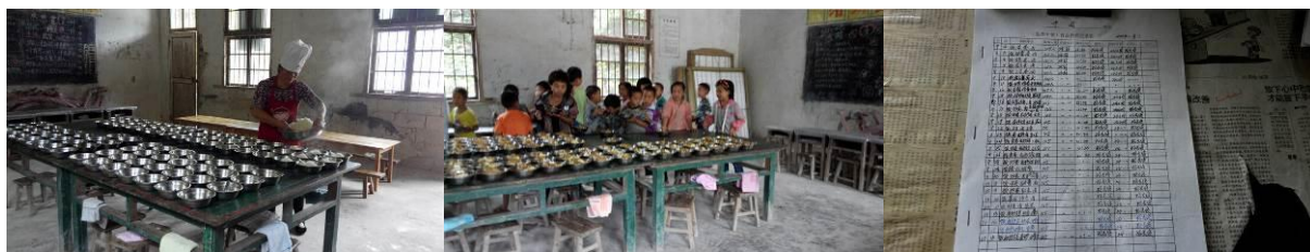
图 13 分餐