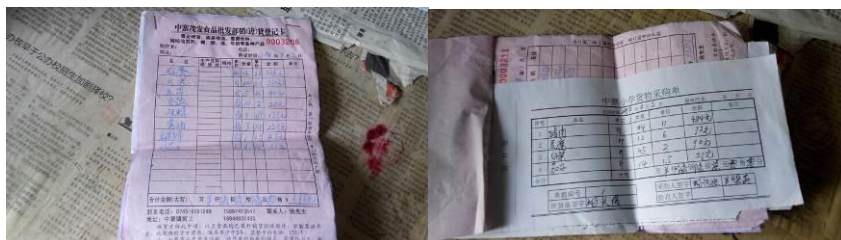
图 18 原始凭证