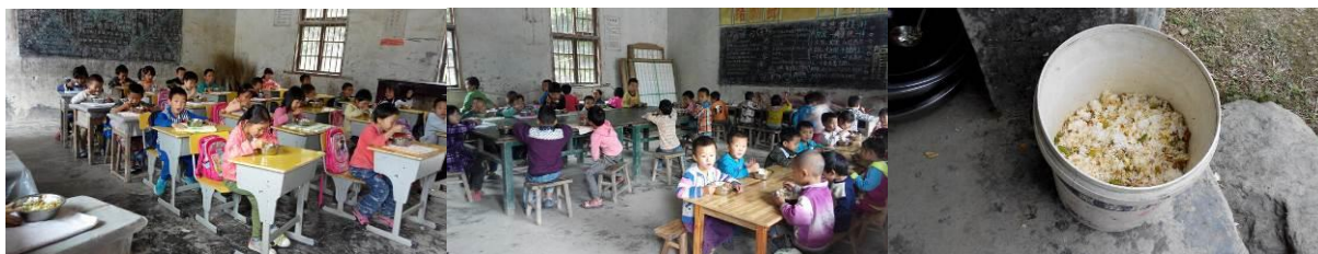
图 15 用餐