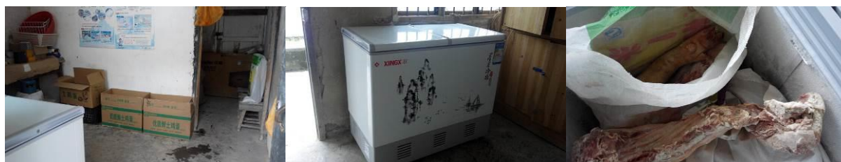
图 6 储藏室及冰柜