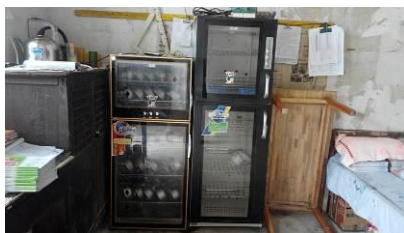
图 7 消毒柜