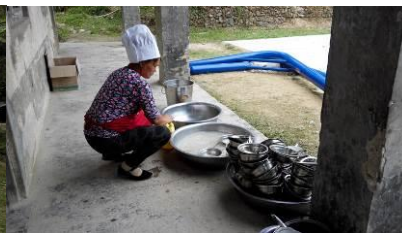
图 9 餐具清洗