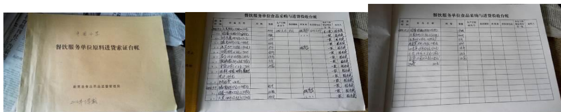
图 17 进货台账