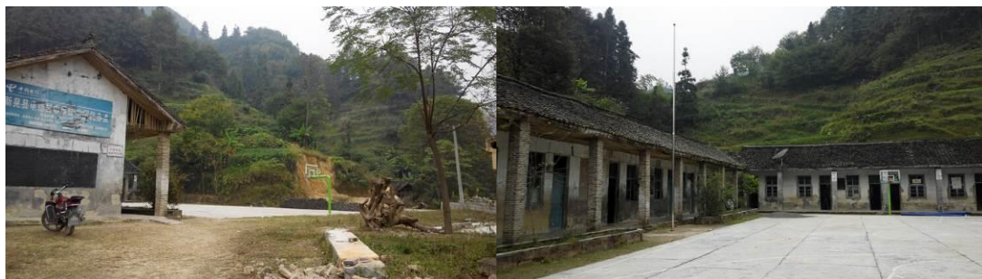
图 2 学校