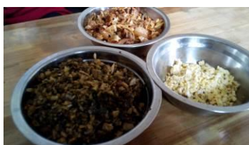
图 11 当日午餐（老师）