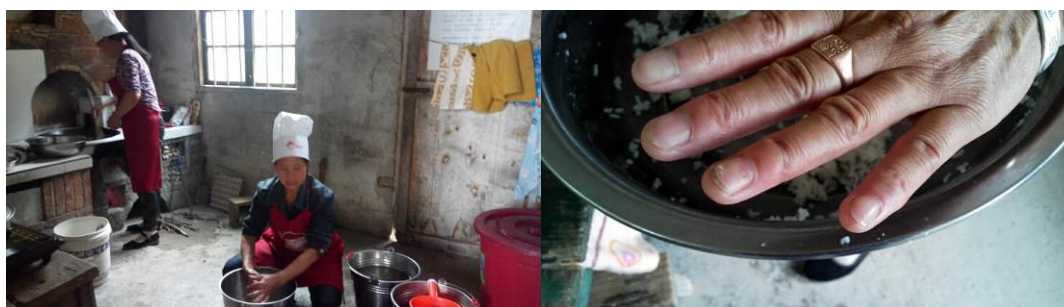
图 4 厨师仪容着装及其手部卫生情况组图

(6)“餐前洗手”取 5 分, 原因为: 该校与别校不同, 用餐从高年级开始, 学生自觉从课室排队走出, 先在餐厅门口的大盆洗手, 再进餐厅领餐。