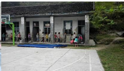
图 8 餐前洗手