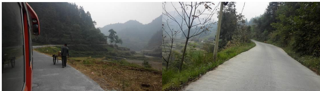
图 1 路况

中团小学，位于中寨镇中团村，没有班车直达，需从中寨镇包面包车或搭乘摩托车前往。该校虽位于深山，但水泥路面到校门口，路况良好。该校只有学前班及小学一年级和二年级，学生 100 人，老师 3 人，配有厨师 2 人。经了解，杨长俊老师负责记账，杨顺波老师负责资金，杨顺波及吴碧英老师同时负责采购，实行双人监督采购制。