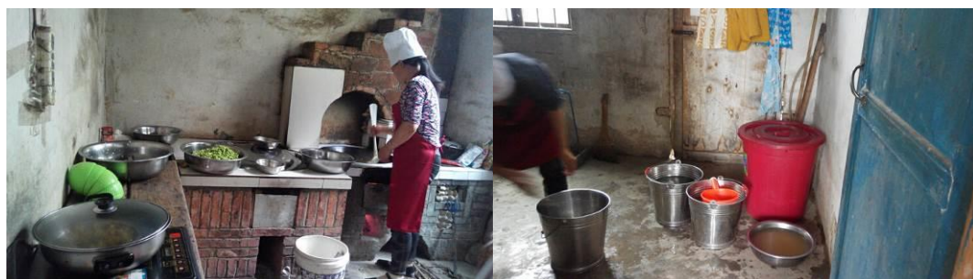
图 5 厨房