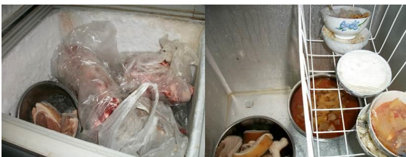
图7 冰柜（放置于储藏室）