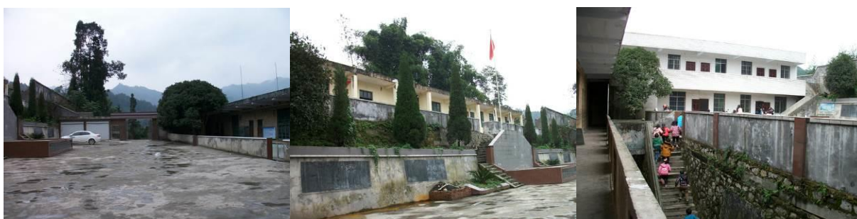
图 2 学校