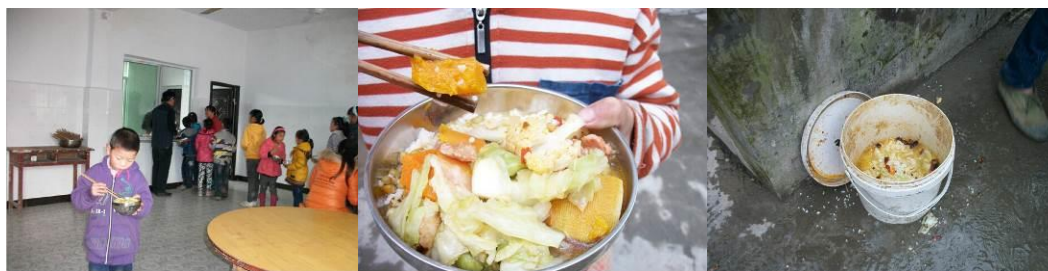
图 10 分餐