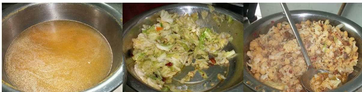
图 9 供餐菜品

(5) “饭菜异物”取 5 分, 原因为: 调查当日在校用餐, 未发现菜品中有头发、石头等异物。