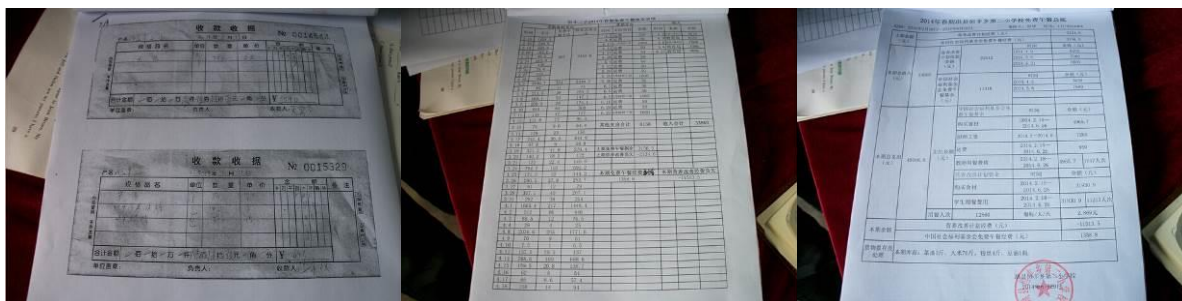
图 14 原始凭证

“入库登记”和“出库登记”项取 3 分,扣分原因是食材进出库的监督确认工作需要加强。