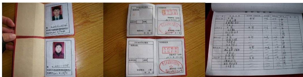
图 12 厨师健康证