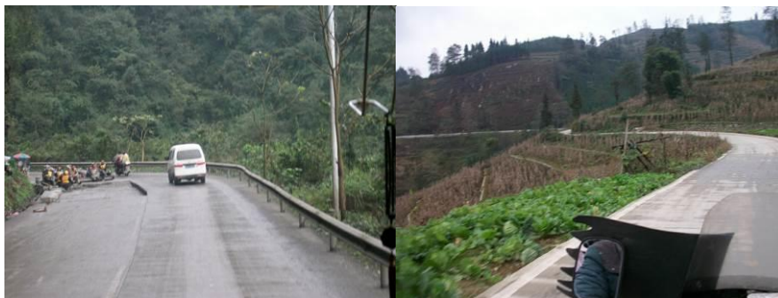
图 1 路况

小学放学, 下午 17:00 初中放学。免费午餐工作由赵华老师负责(除日常教学工作兼顾后勤工作)。