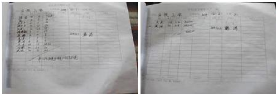
图 16 入库登记