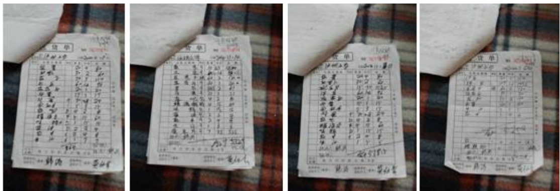
图8 学校11月份的蔬菜采购原始凭证