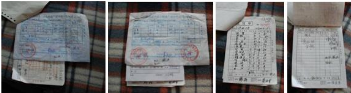
图 15 原始凭证