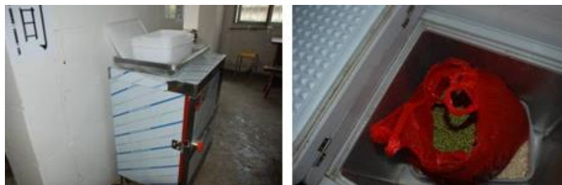
图 10 设备正常使用