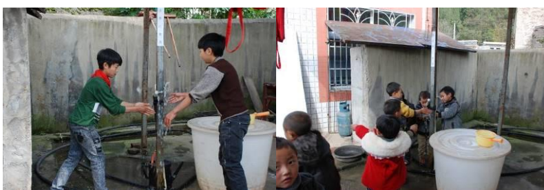
图 5 学生餐前自觉洗手