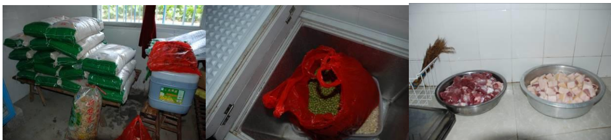
图 4 食物储藏合规规范（猪肉刚切好还未入冰箱）