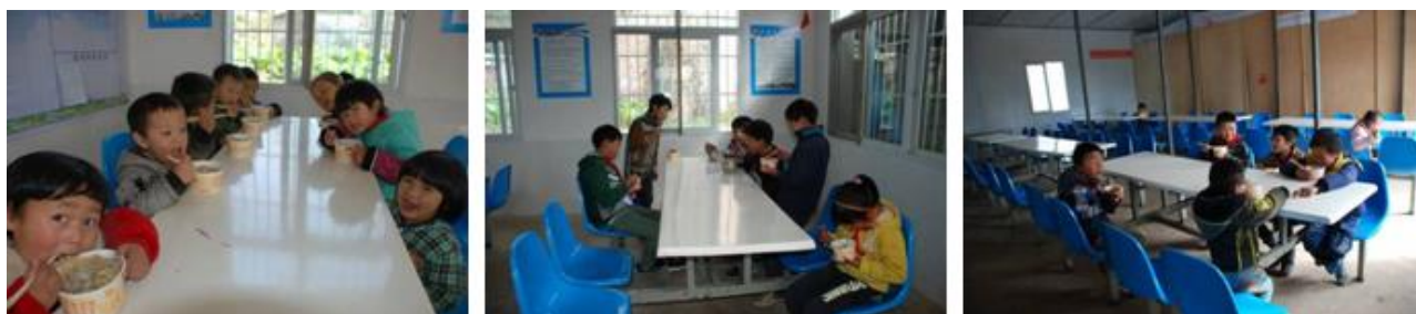
图 14 学生在餐厅用餐