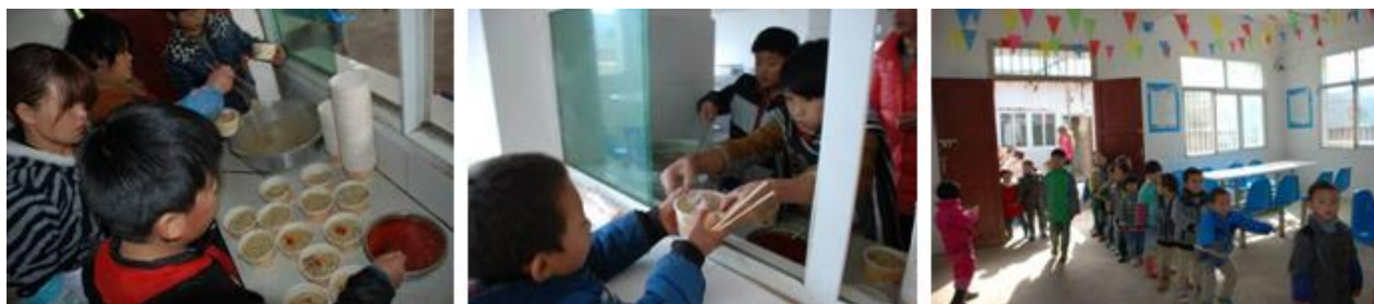
图 13 学生排队分餐（秩序良好）