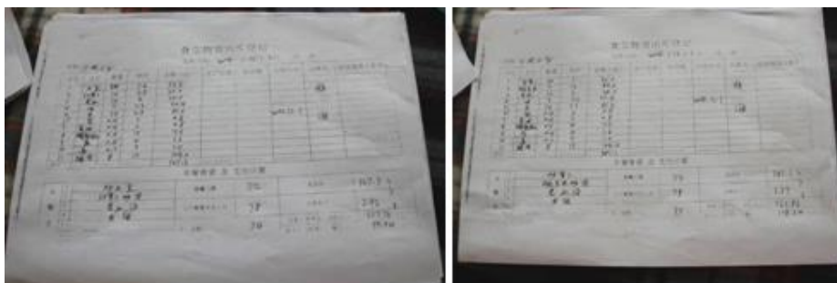
图 17 出库登记