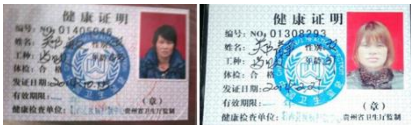
图 9 厨师健康证在有效期内

调查当天所见学生分餐秩序良好。教职工在给学生分餐后再吃饭（和学生吃同样的食物）。学校暂只有一位厨师，因已申请了另一位厨师，故出示了两张有效健康证。