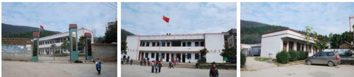
图 1 学校外观

免费午餐于 2011 年 4 月 2 日在该校正式开餐。中国社会福利基金会免费午餐基金向该校提供一笔开餐资金（用于购置冰箱等或厨房用品等）及现在 10 名教职工 3 元/人/餐的午餐费。现 78 名义务教育阶段学生有由国家营养改善计划提供 4 元/人/餐的午餐费，免费午餐向 28 名学前班儿童提供 3 元/人/餐的午餐费。午餐不收取学生费用。有 1 名寄宿生，和老师同吃早、晚餐。厨师工资 1070 元/月，由当地财政拨款发放。本次是调查者第二次到该校稽核。