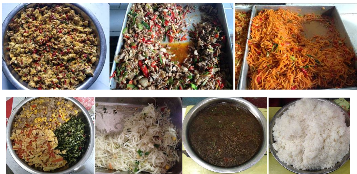
图 10 小食堂饭菜组图