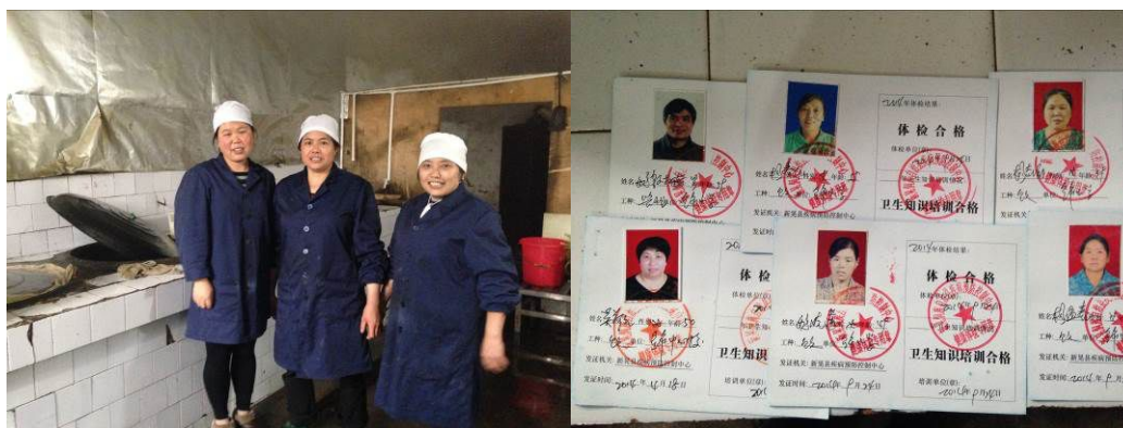
图 13 部分在岗炊事员及健康证