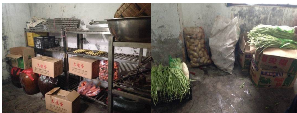
图7 大食堂的储藏室情况及堆放于地的食材

关于“食材储藏”，调查人员注意到，该校大小两个食堂的食材储藏室整体环境卫生均欠佳，部分食材未按规定上架存放（图7）。根据稽核评分规则，该项评分取1分；