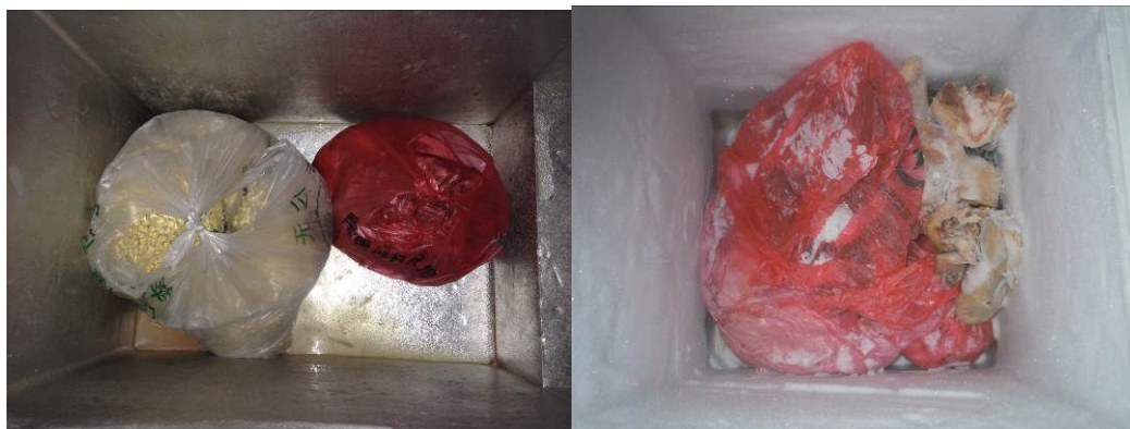
图5 大小食堂冰柜内部情况

关于“易变质食物保存”，该校大小两个食堂的冰柜均有不同程度的霜冻，内部有污渍，并可闻及明显异味（图5）。根据稽核评分规则，该项评分取1分；