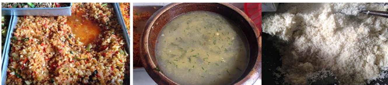
图 9 大食堂饭菜组图