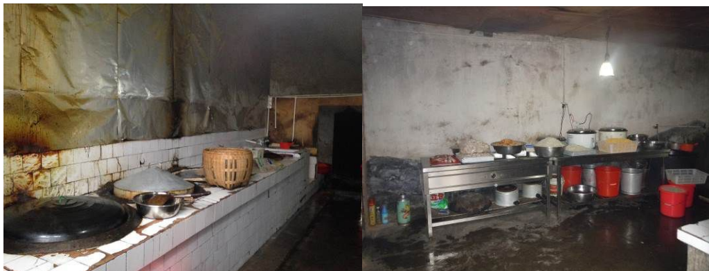
图4 大小食堂操作间全景

关于“墙地面卫生”，该校大小两个食堂由于房屋老旧，墙地面卫生均欠佳（图4）。根据稽核评分规则，该项评分取3分；