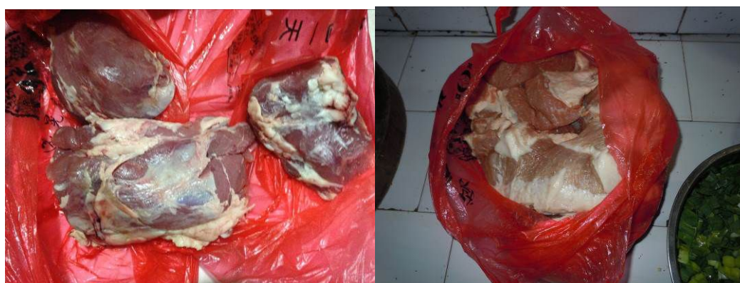
图8 已出现明显异味的待加工猪肉

关于“当前储存食材变质腐坏情况”，调查当日，调查人员注意到该校大小两个食堂当日所使用的食材均出现了不同程度的异味，存在变质嫌疑（图8）。根据稽核评分规则，该项评分取0分，并列入“重大问题”加扣相应分数；