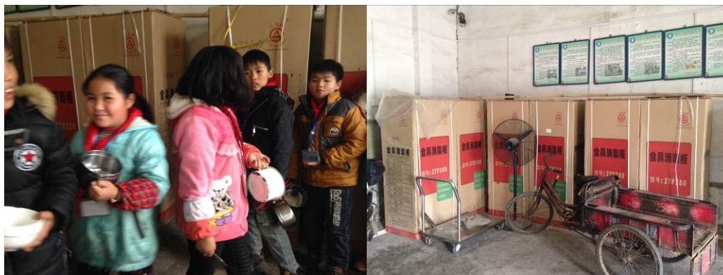
图6 持不同餐具打饭的学生及尚未投入使用的消毒柜

关于“食材储藏”，调查人员注意到，该校大小两个食堂的食材储藏室整体环境卫生均欠佳，部分食材未按规定上架存放（图7）。根据稽核评分规则，该项评分取1分；