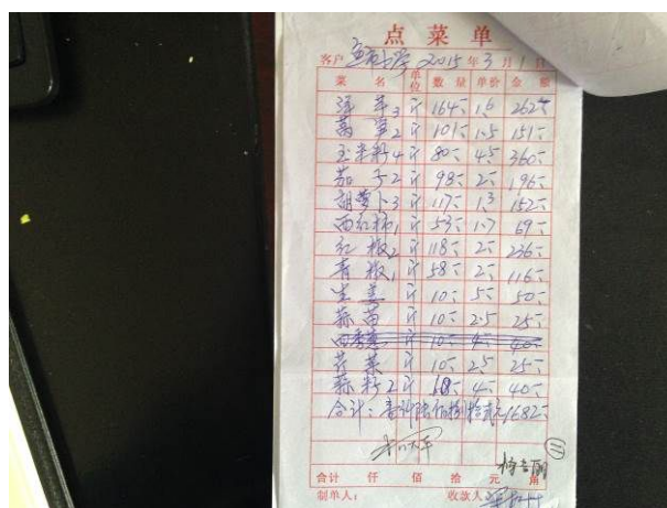
图 14 没有明确签字信息的采购凭证

关于“原始凭证”, 调查人员注意到出示的原始凭证均存在签字信息不明确的情况(未注明采购、验收)(图 14)。根据稽核评分规则, 该项评分取 3 分;