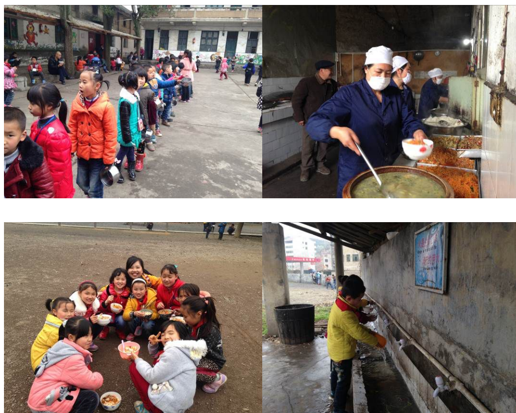
图 12 就餐现场组图

除上述扣分项外，该校在执行管理环节的其他方面如就餐秩序等表现尚可，具体详见图 12、图 13：