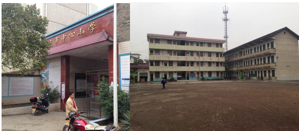
图 1 学校大门及校园环境

该校现任负责人姚茂钿老师。午餐管理团队：食堂后勤姚敦智老师（负责食堂出入库管理及学校微博维护），采购主管姚敦树老师，学校午餐财务姚鹏程老师。