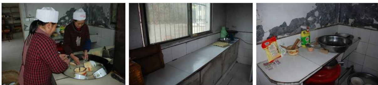
图 3 厨房及厨师情况组图