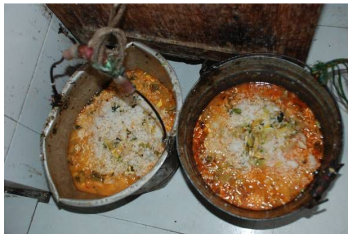
图9 调查当天该校厨房剩饭剩菜图情况图，剩饭菜有点多了