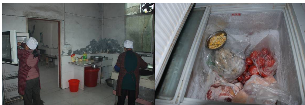
图 7 设备正常使用