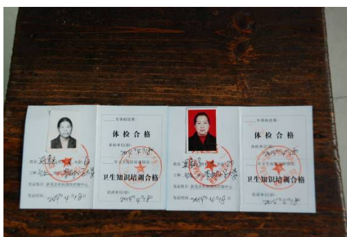
图 6 厨师健康证在有效期内