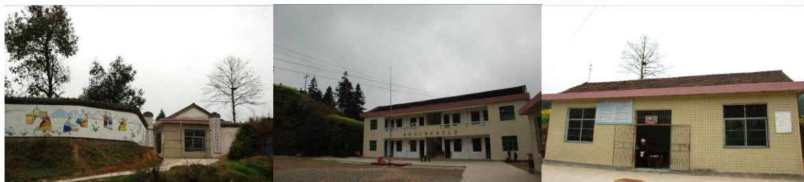
图 1 学校外观

免费午餐于 2011 年 11 月 10 日在该校正式开餐。中国社会福利基金会免费午餐基金向该校提供一笔开餐资金（用于购置冰箱和其他厨房用品等）以及现在 2 名厨师 800 元/月的工资及 5 名教职工 3 元/人/餐的午餐费。现 43 名小学生有由国家营养改善计划提供 4 元/人/餐的午餐费，免费午餐向 34 名学前班儿童提供 3 元/人/餐的午餐费。该校学生均为走读生，学校只做午餐。