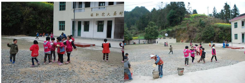
图11 学校没有餐厅，学生在操场上用餐