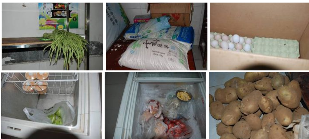
图4 食材储存情况组图