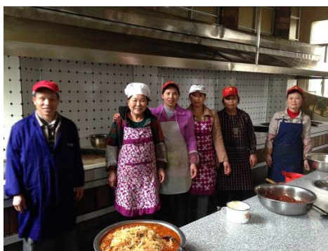
图 3 在岗炊事员着装情况

关于“厨工工服着装”，调查当天，在岗的八名厨师均未按要求着工作装，但基本卫生防护措施良好，自身着装干净整洁（图 3）。根据稽核评分规则，该项评分取 3 分；