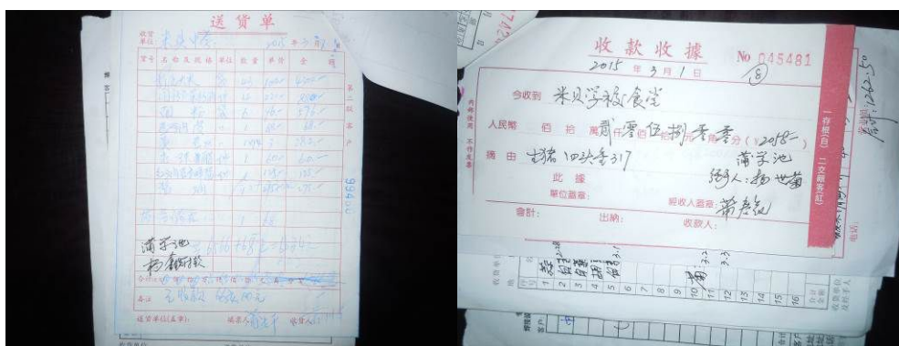
图 12 签字信息不明确的原始凭证

关于“原始凭证”,从该校当日出示的采购原始凭证来看,各经手人签字信息不明确(图 12)。根据稽核评分规则,该项评分取 3 分;