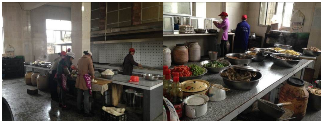
图4 厨房全景及局部

关于“墙地面卫生”，调查人员注意到，厨房操作间瓷砖墙面污迹灰尘明显，地面下水道堵塞，可见积水（图4）。根据稽核评分规则，该项评分取3分；