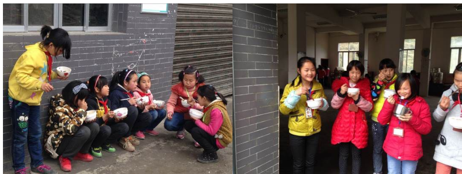
图 11 就餐现场组图