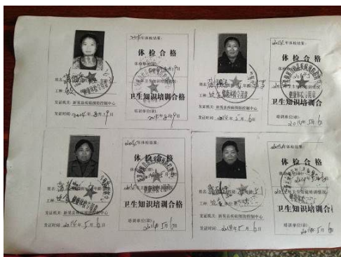
图 10 炊事员健康证

除上述扣分项外，该校在执行管理环节的其他方面表现尚可，具体如图 10、图 11：