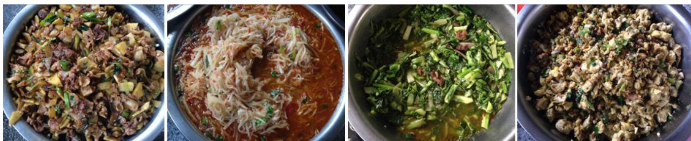
图 8 调查当日饭菜组图