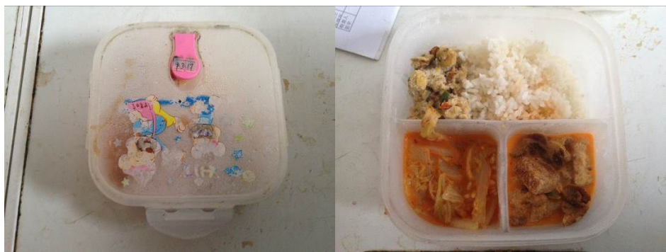
图9 现场查见的食品留样

除上述扣分项外，该校在执行管理环节的其他方面表现尚可，具体如图 10、图 11：