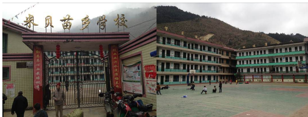
图 1 学校大门及校园环境

该校现任负责人陈洁老师,午餐运行管理由食堂后勤主任蒲永泽老师全权负责,午餐资金管理由杨鑫老师负责,学校微博维护江应勇老师。