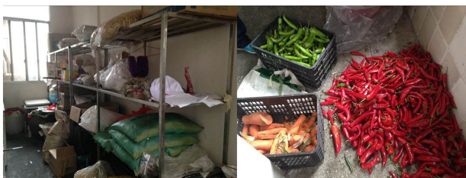
图6 干货储藏室及堆放于地上的食材

关于“食材储藏”，调查人员注意到，冷藏及干货储藏室较为杂乱，非食材类物资与食材混放，蔬菜类食材则直接堆放在地上，未按要求上架（图6）。根据稽核评分规则，该项评分取1分；