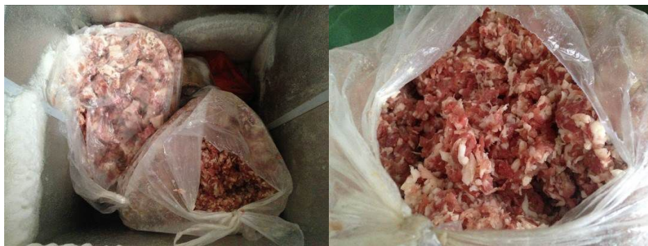
图 7 已存在变质嫌疑的猪肉末

关于“当前储存食材变质腐坏情况”，调查人员当日在冷藏冰柜内发现一袋近 10 斤猪肉末已可闻及明显异味，存在变质嫌疑（图 7）。根据稽核评分规则，该项评分取 0 分，同时列入“重大问题”项加扣相应分数；