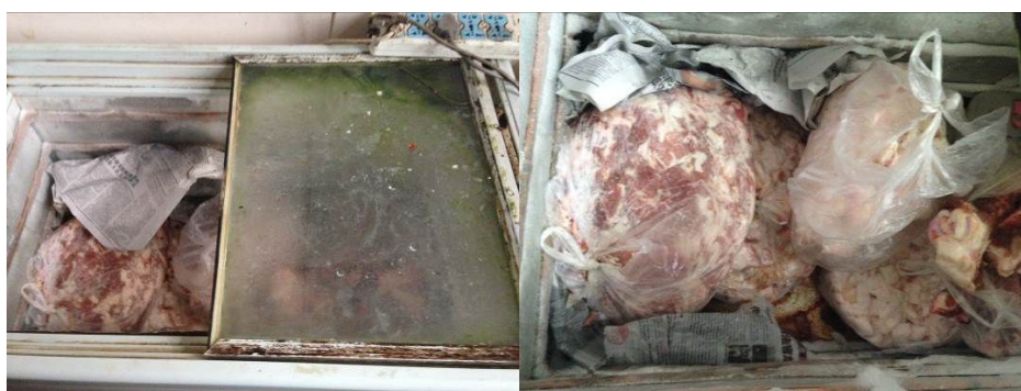
图5 冰柜外观及内部情况

关于“易变质食物保存”，调查人员注意到，用于冷藏食材的冰柜内部污浊明显，结霜严重，冰柜盖及隔板污渍较多（图5）。根据稽核评分规则，该项评分取1分；