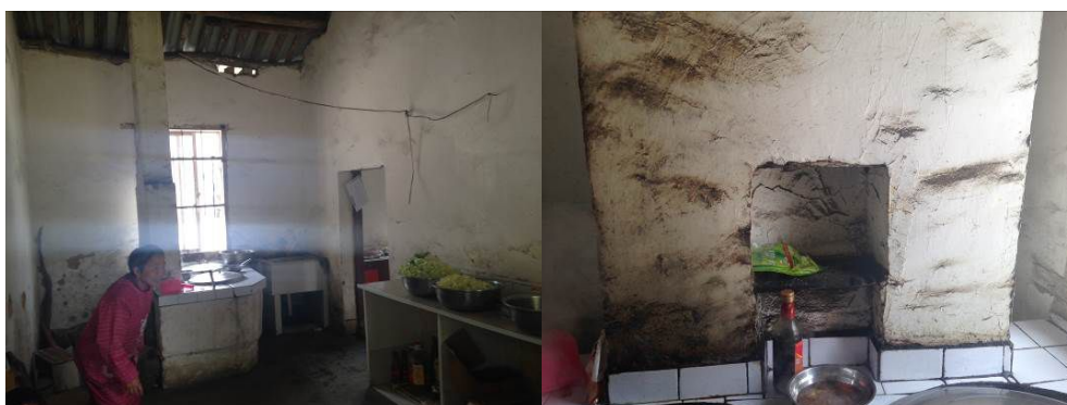
图4 厨房操作间全景及局部

关于“墙地面卫生”，该校厨房操作间、加工间部分墙地面因为烧柴导致墙面污渍明显，整体环境卫生一般（图4）。根据稽核评分规则，该项评分取3分；