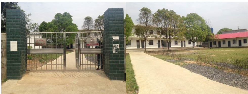
图 1 学校大门及校园环境