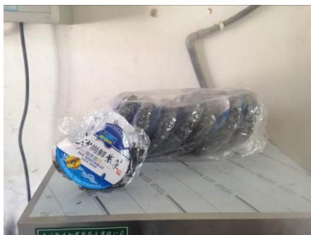
图6 可正常使用的消毒柜

关于“食材储藏”，调查人员注意到干菜（紫菜）被直接放在正在工作的蒸饭机顶，存在受潮嫌疑。根据稽核评分规则，该项评分取3分；