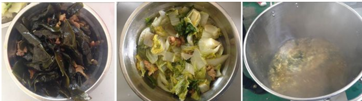
图 7 调查当日饭菜组图