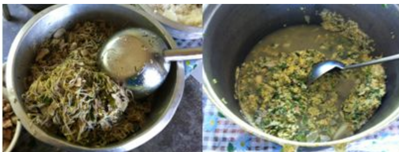
图 11 就餐结束后剩余菜品组图

(2) “浪费情况”项得 1 分, 原因是调查当日发现学校所提供的菜品绿豆芽炒肉剩的比较 多。(如图 11)