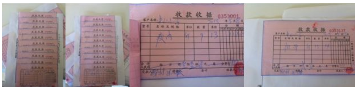
图 14 原始凭证组图

原始凭证内容为每日免费午餐采购食材，凭证核心内容完整，但是无商家联系方式，通过查看学校食材价格相对合理。入库、出库单核心信息完整。学校未提供现金流水账，但是在微博发布记录本中清晰地记录了资金情况。