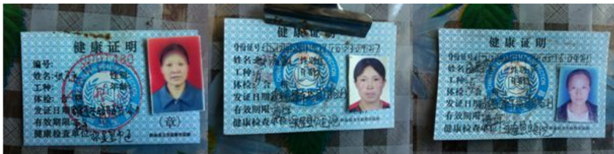
图 10 厨师健康证组图

该校的就餐情况是，厨师将饭菜分装好，有学生将饭菜领到班级，再进行分餐，低年级由老师或高年级学生帮忙分餐，高年级有的班级会安排值日生进行分餐，有的班级学生自己打餐，老师会与学生在教室一同用餐。学生用餐秩序井然。