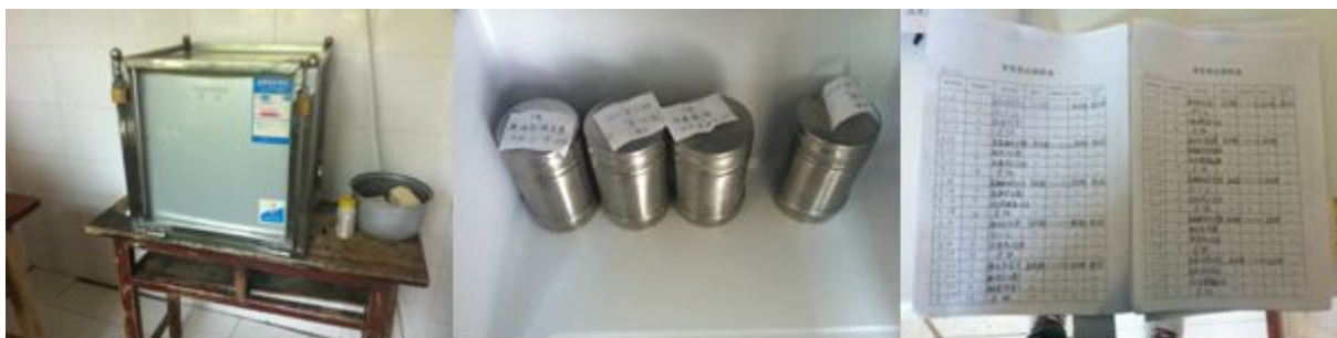
图 12 学校留样和记录组图