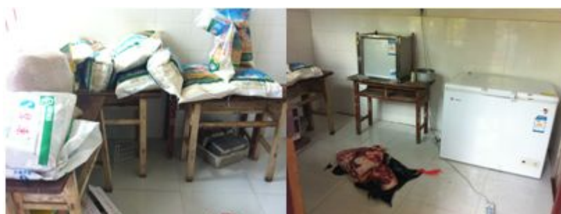
图5 食材储存情况组图