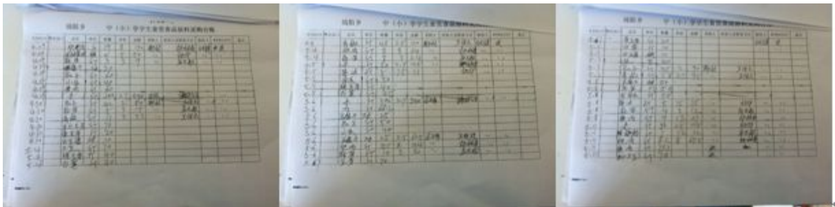
图 17 食品原料采购台账组图