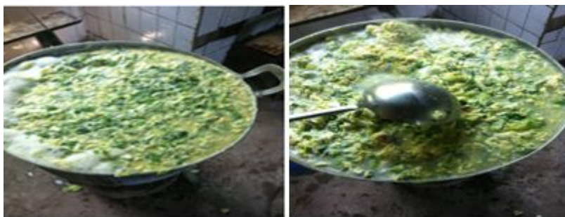
图 8 白菜蛋花汤图