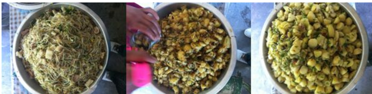
图 9 开餐当日菜品组图