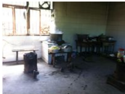
图 7 墙面与地面