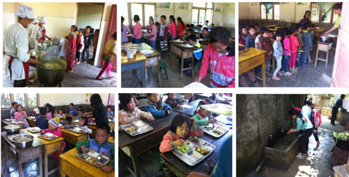
图 13 学生用餐情况组图