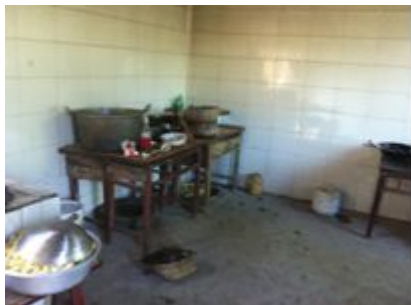
图 6 操作台