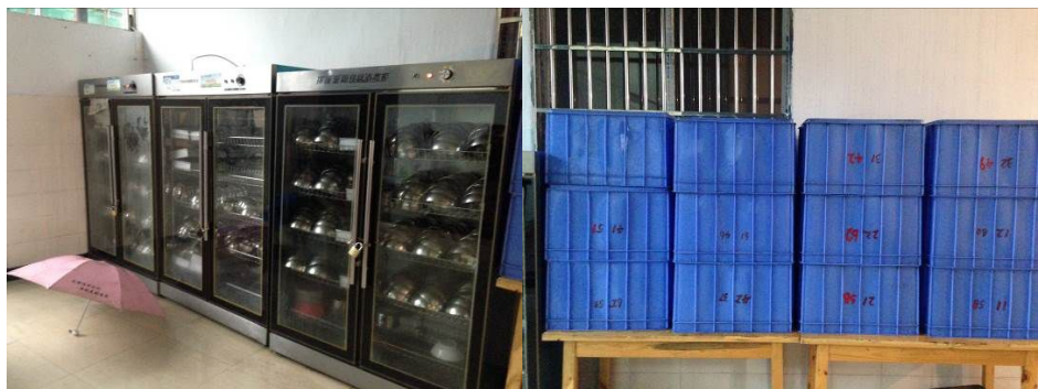
图5 正常使用的大型餐具消毒柜及餐具箱