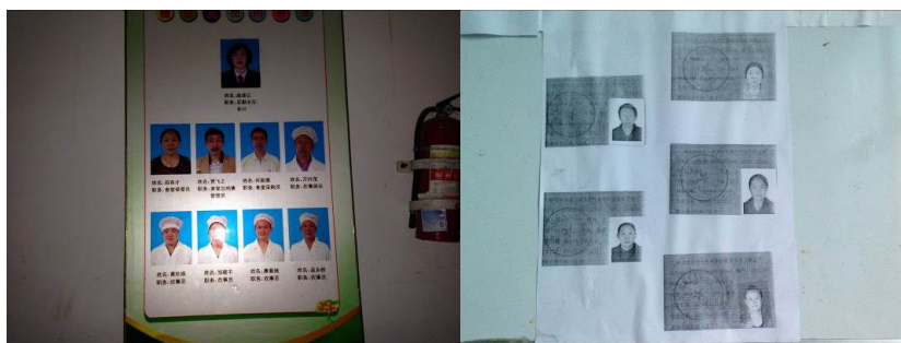
图 8 齐全有效的炊事员健康证