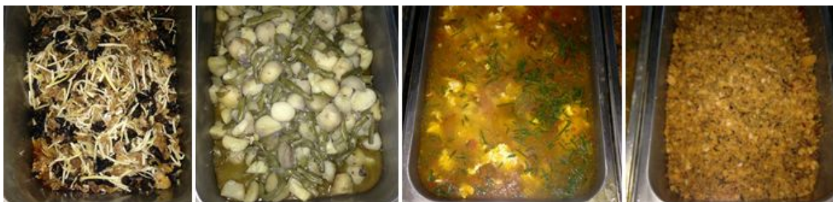
图 6 调查当日饭菜组图

调查当日，该校午餐送餐质量完全符合本项考察要求，本项评分均取满分 5 分。饭菜组图如下（图 6）；