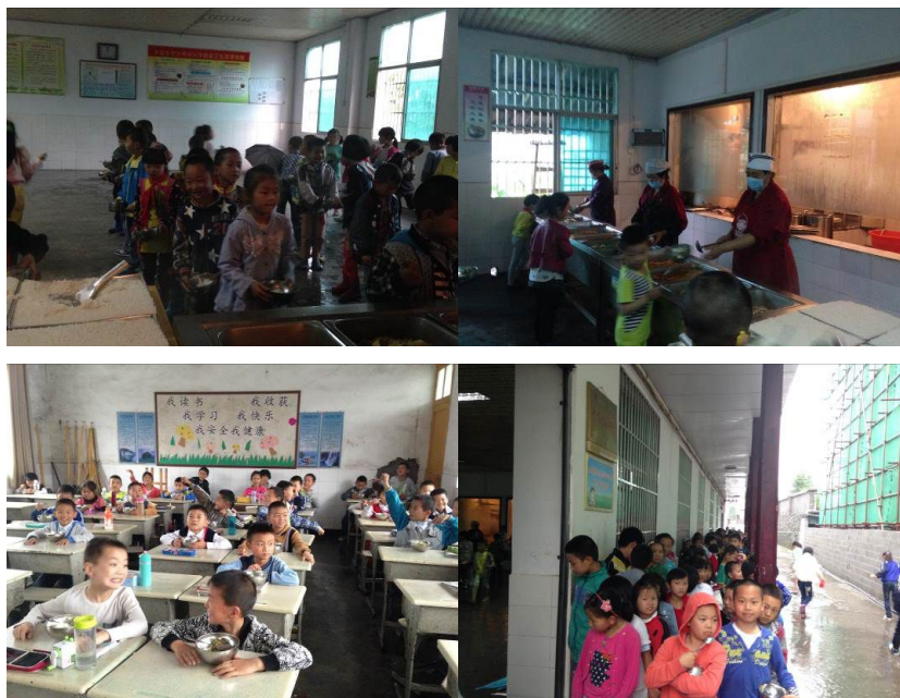
图 9 就餐现场组图