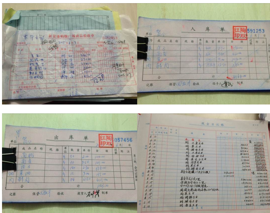
图 10 财务管理账目组图

该校食堂资金管理规范,账目设置完善,数据清晰,各个管理环节规范、清晰可控。根据稽核评分规则,本项调查予以全取满分5分;