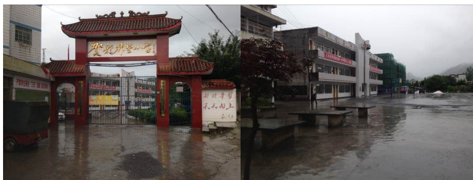
图 1 学校大门及校园环境

该校现任校长陶双红老师，午餐管理团队包括：食堂后勤贾飞之老师，采购员何家德（兼学校微博维护）、张斌老师，出入库管理田友才老师，学校出纳赵凌云老师。