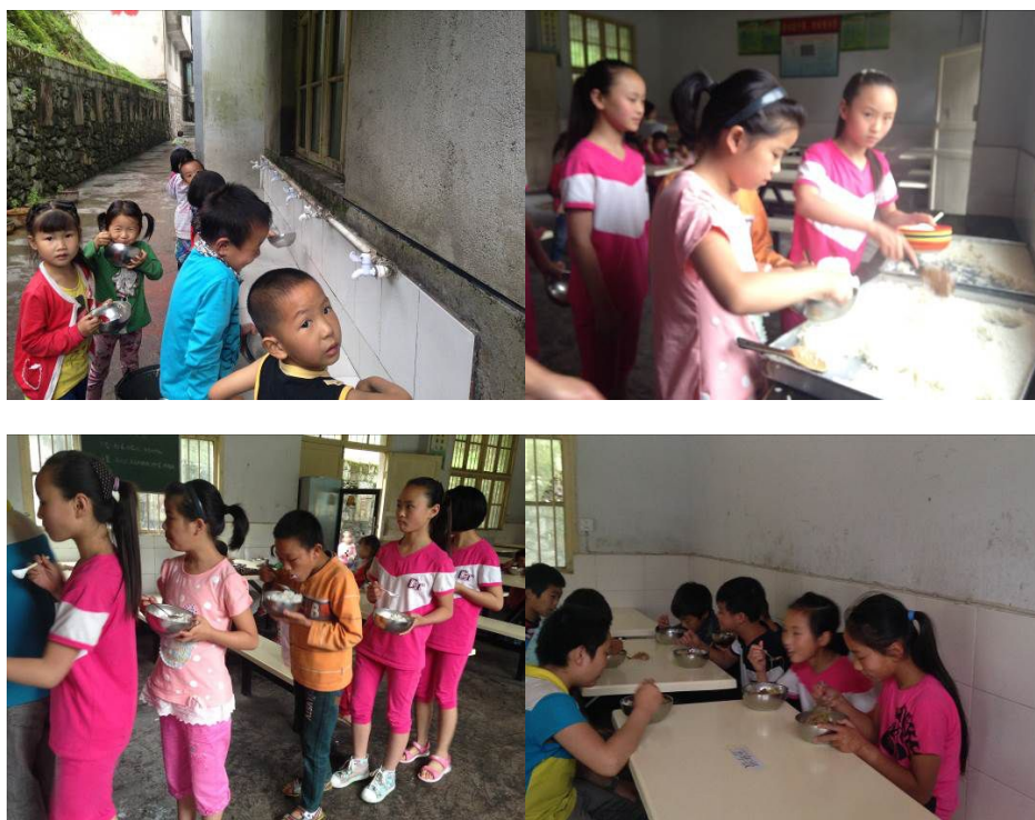
图 12 就餐秩序组图