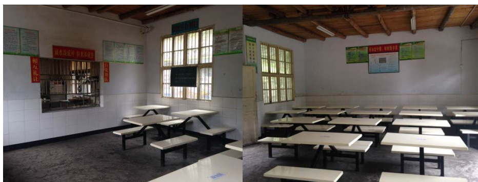
图 6 厨房及餐厅各区域情况