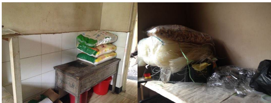
图 7 一般食材储存情况