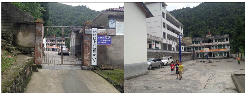
图 2 学校大门及校园环境