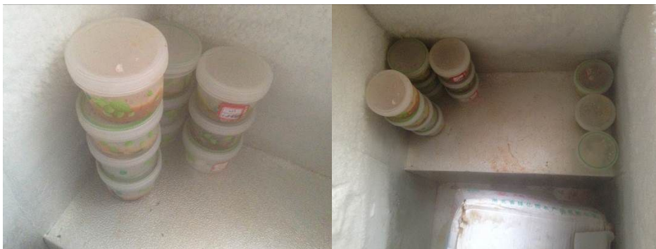
图 10 已结冰的食品留样

校方解释称,关于食品留样,调查前几日,该县食药监局突击督查该校时曾提出食品留样必须冻存在冰箱冷冻室,调查人员对此意见持保留态度;