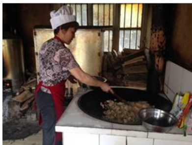
图 3 未严格着装在岗的炊事员