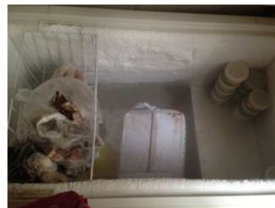
图 5 冰柜内部严重结霜