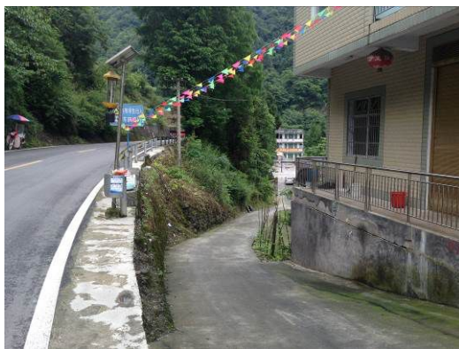
图1 茶园小学周边道路情况

6月18日早上,调查人自鹤峰县景发汽车站乘坐前往北佳的客运班车,于10点30分左右到达茶园小学所在的中营镇白鹿村(10元),步行入校。自鹤峰县城至茶园小学交通方便,全程硬化路面。结束对该校的调查后,在路边搭乘客车返回鹤峰县城。