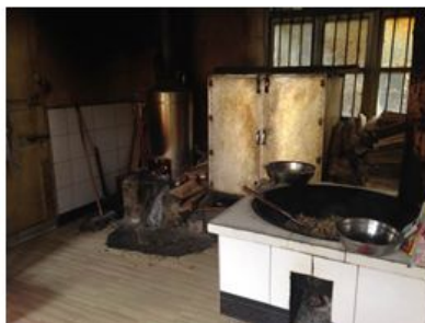
图 4 厨房操作间