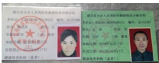
图 11 合格有效的炊事员健康证