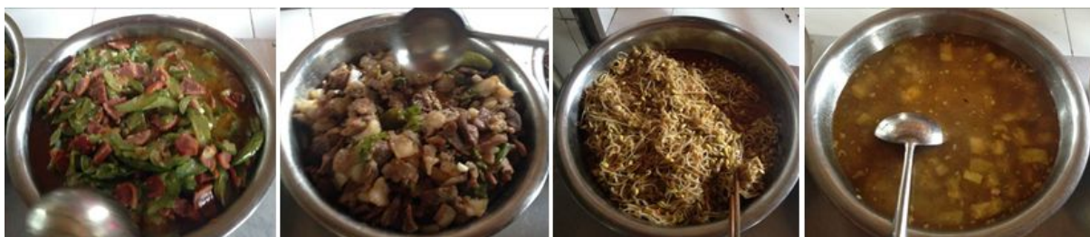
图 8 调查当日饭菜组图

评分说明：调查当日，该校午餐送餐质量完全符合本项考察要求，本项评分均取满分 5 分。饭菜组图如下（图 8）；