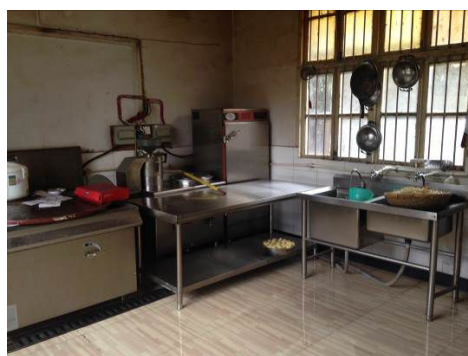
图 9 闲置的厨房设备

关于“设备管理”，调查人员注意到，该校厨房尚有部分的现代化厨房设备（电炒锅、电力蒸饭车等）处于闲置状态（图 9）。据李校长介绍，由于该校一直未能解决动力电问题，故相关设备一直无法使用。根据稽核评分规则，该项评分取 0 分；