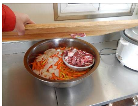
图8 工作台生熟食分开图