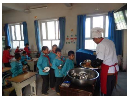
图 19 没吃饱的学生添加饭菜图