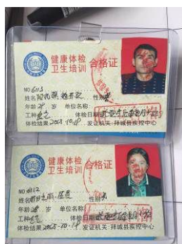
图 15 厨师健康证图