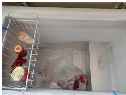
图6 冰箱内储藏的部分未采取隔离措施的易变质食物图