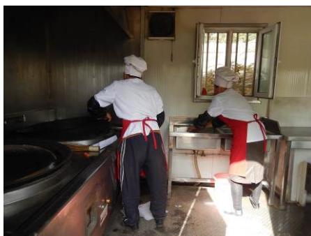
图7 厨工正规着装工作图