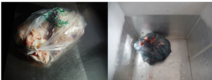
图10 冰箱内储藏的易变质食物组图