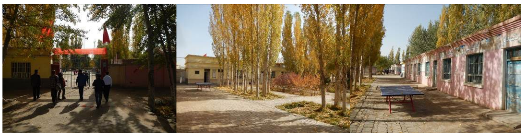
图 3 学校组图