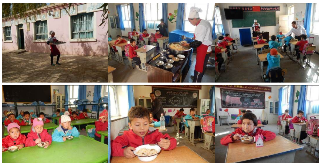
图 18 学生分餐、用餐情况组图