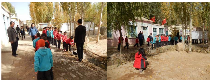
图 13 餐前学生洗手情况组图