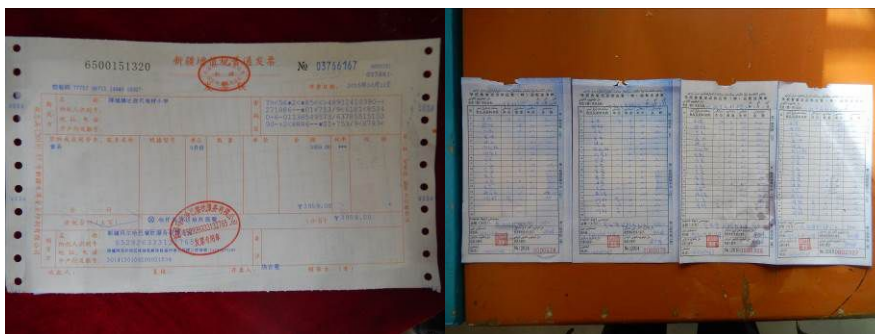
图 23 原始凭证组图