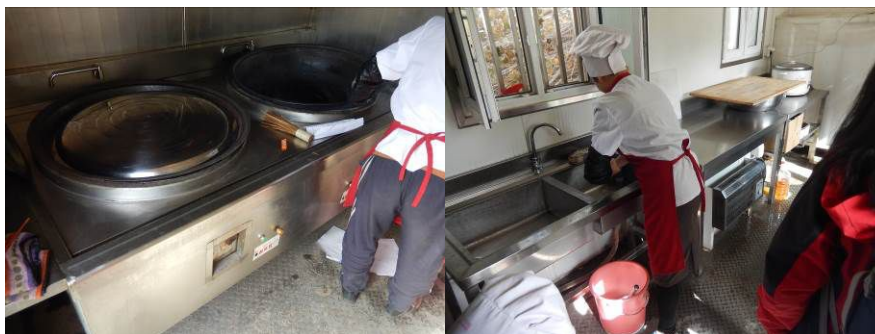
图9 厨房工作台组图