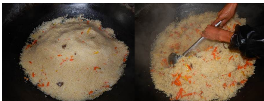
图 14 当日菜品组图