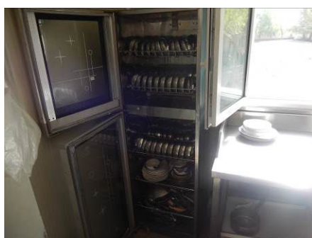
图12 学生餐具消毒存放图(餐后由厨师统一清洗餐具并消毒存放)