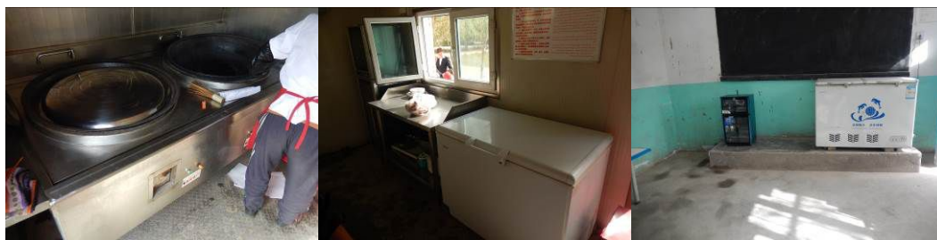
图 16 正常使用的厨房设备组图