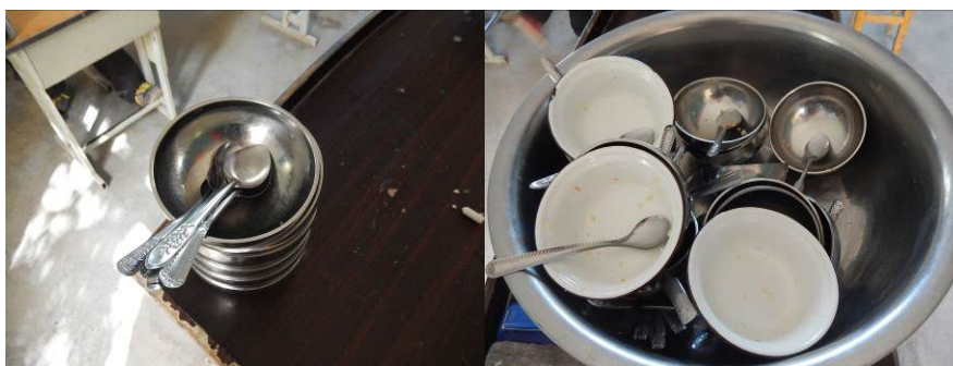
图 21 餐后的剩菜剩饭组图

(从近 60 人用餐后的剩菜剩饭看基本上无浪费现象, 校方回应穆斯林没有浪费的习惯)