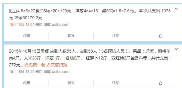
图 4 就餐人数的微博截图