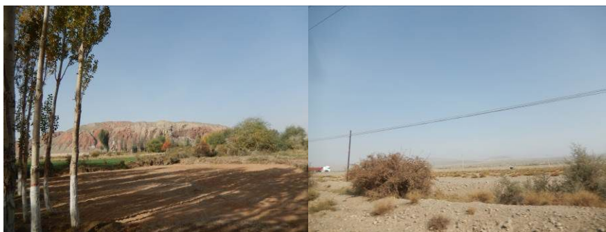
图 2 学校北面的盐山和周围的戈壁滩组图

拜城镇吐孜贝希小学建校于 1950 年, 原址在吐孜贝希村第一小队, 经过三次搬迁, 于 1989 年重新迁回原址, 校名为吐孜贝希小学。学生全为本村人, 均为走读生, 最远距校 5 公里, 低年级学生为家长接送, 高年级学生为徒步上学。学校至县城 20 公里, 道路均为公路, 不通班车, 交通不便利。学校现有 5 个年级、5 个教学班, 共有学生 66 人。学校现有教职工 12 人, 教师 9 人, 保安 1 人、厨师 2 人。