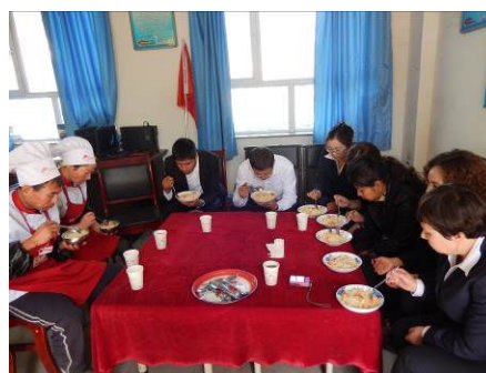
图 20 教职工用餐图