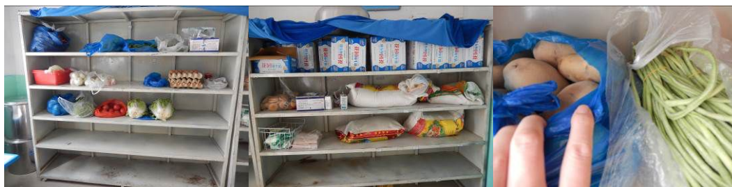
图11 食材安全有序储藏组图