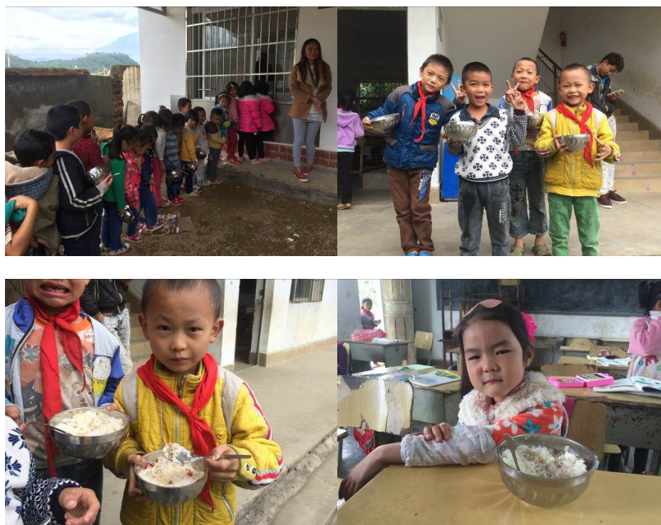
图 12 就餐现场