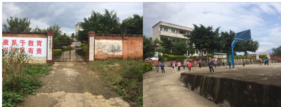
图 2 学校大门及校园环境