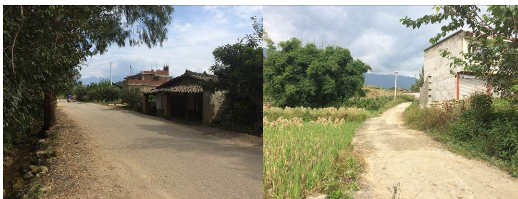
图1 先锋小学周边路况

10月12日,调查员自西昌市旅游集散中心客运站乘坐前往德昌县的客运班车,约1.5小时后抵达德昌县城(17元),换乘前往茨达乡方向的客运面包车,在先锋小学所在的巴洞乡先锋村路边下车(3.5元),入校调查。结束调查后,在学校路边乘坐过路客运面包车返回德昌县汽车站(3.5元),换乘客运班车回到西昌市(16元)。自德昌县城至先锋小学的路况一般,为简单硬化路面(图1),交通方便,过路客车很多。