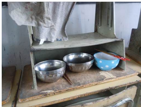
图7 学生自行保管的餐具

关于“餐前洗手”，调查当日，全校学生就餐前都没有进行洗手，学校室外水龙头停水。根据稽核评分规则，该项评分取3分；