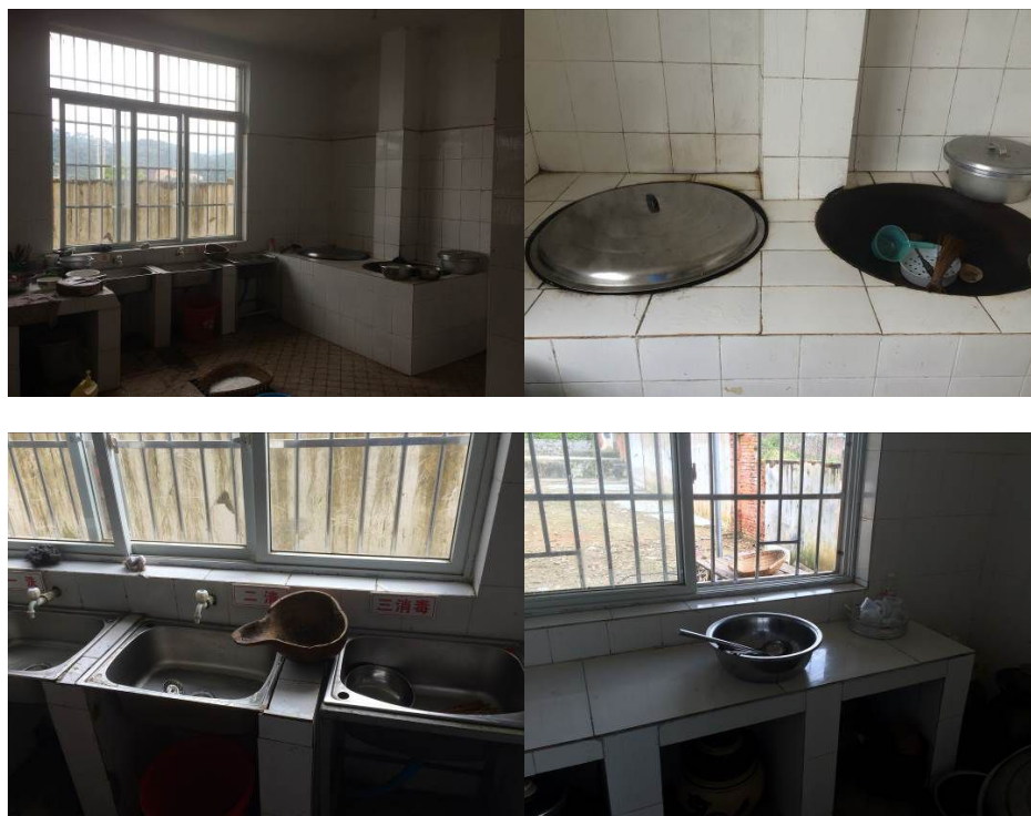
图 8 厨房整体环境及局部