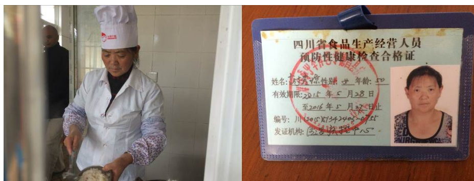
图 11 规范着装的炊事员及健康证