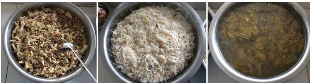
图 9 调查当日饭菜组图

调查当日, 该校午餐质量基本符合本项考察要求, 予以全取满分 5 分。(见图 9)