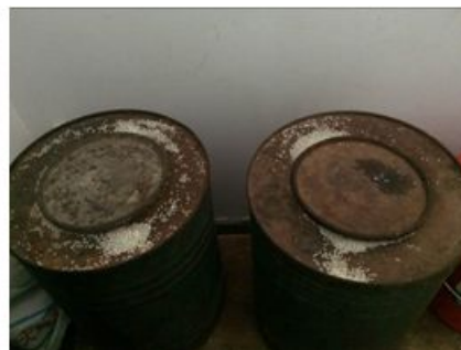
图6 盛装大米的铁桶

关于“餐具消毒”，调查当日，该校学生餐具均为学生自行保管自行清洗(图7)，没有可供餐具统一存放消毒的餐具消毒柜。根据稽核评分规则，该项评分取1分；