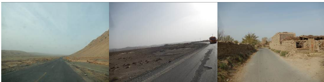
图1 路况组图(途中经过火焰山和沙漠山大峡谷)

交通提示:县城至鲁克沁镇为流水班车,至迪坎乡和迪坎村的班车一天有三趟,时间不太固定。