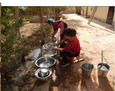
图11 学生餐具消毒存放组图