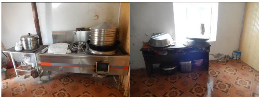
图6 厨房工作台组图