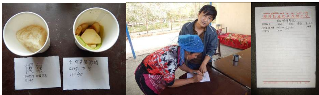
图 15 改正后的当天菜品留样与登记组图