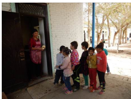
图 17 没吃饱的学生添加主食图