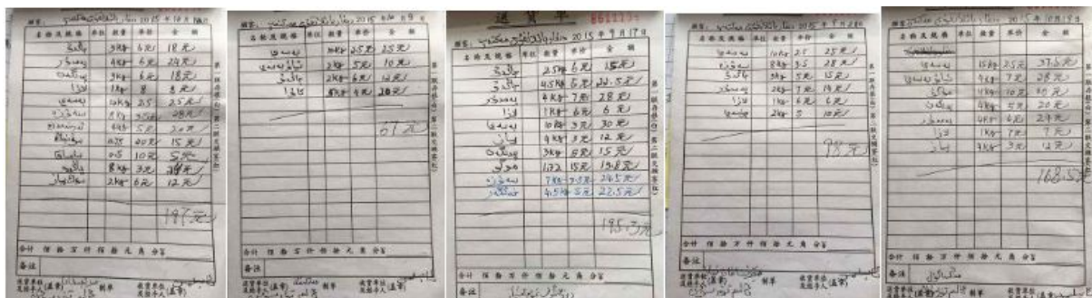
图 20 原始凭证组图