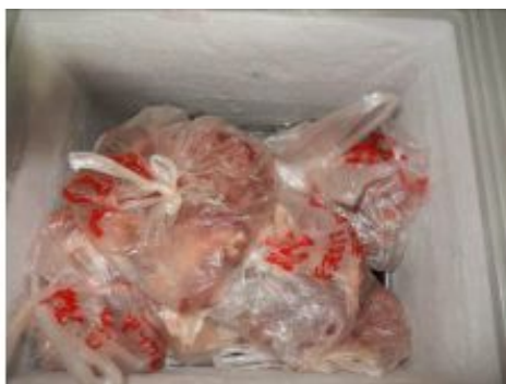
图9 冰箱内储藏的易变质食物图