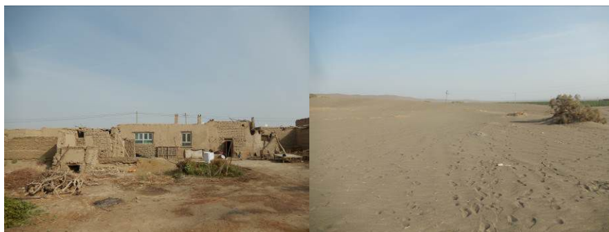
图2 当地百姓民居和周围的沙漠组图

鄯善县地处库木塔格山(沙山)北麓, 西接火焰山东端。三面环山, 地势东北高、西南低。北部为博格达山, 中部为吐鲁番盆地和哈密盆地, 南部为戈壁和沙漠。鄯善油田是中国第一个大型侏罗系油田, 也是中国第一流油田。