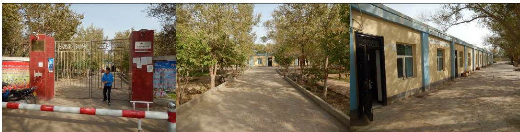
图 3 学校组图