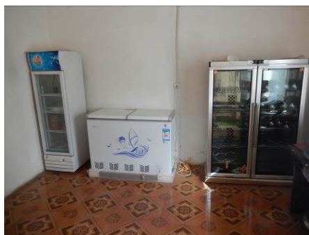
图 14 正常使用的厨房设备图