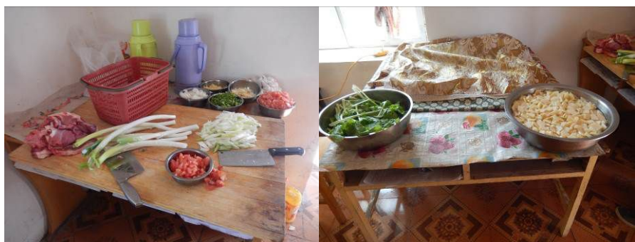
图7 工作台生熟食分开组图