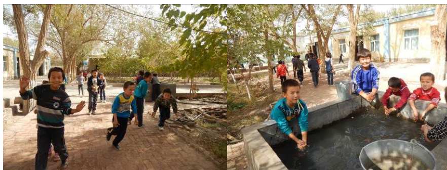
图 12 餐前学生洗手情况组图