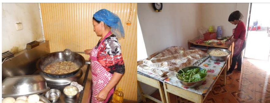
图5 厨工正规着装工作组图