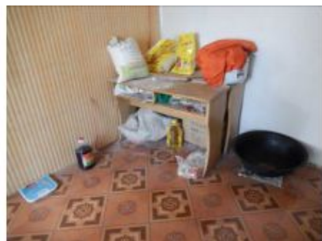
图10 食材安全有序储藏图