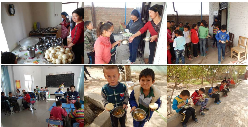
图 16 学生分餐、用餐情况组图