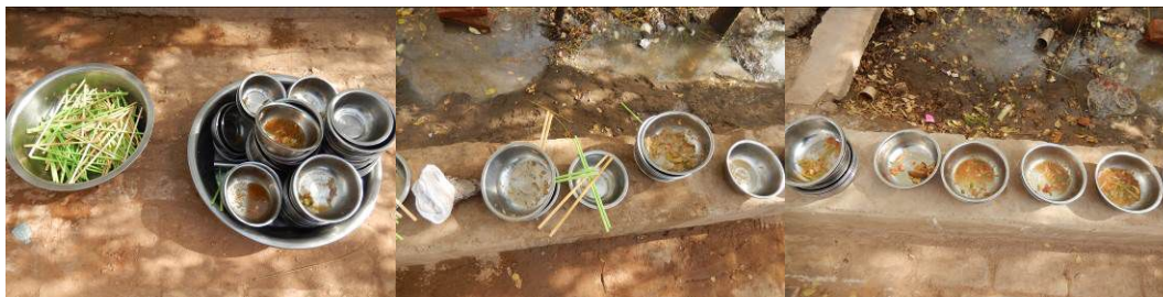
图 19 餐后的剩菜剩饭组图