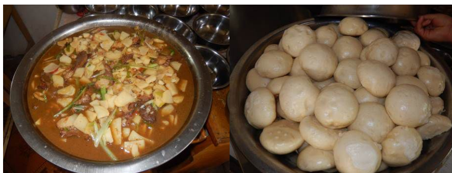
图 13 当日菜品组图