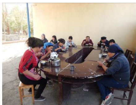
图 18 教职工用餐图