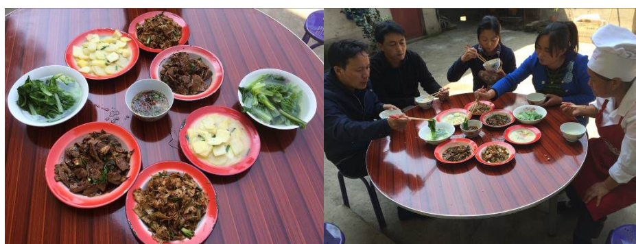
图 11 调查当日的教职工菜品

关于“师生同餐”，调查当天该校教职工当日午餐系单独做菜开餐（图 11）。根据稽核评分规则，该项评分取 3 分；