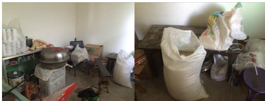
图7 存放于炊事员家小卖部的大米

关于“食材储存”，该校库存食材（大米）被随意存放于校外炊事员家小卖部（图7），存放条件极不符合要求。根据稽核评分规则，该项评分予以取1分；