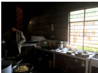
图5 厨房操作间全景