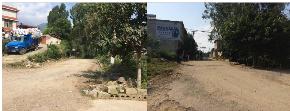
图1 黄家坝小学周边路况

10月14日,调查员自西昌市旅游集散中心客运站乘坐前往德昌县的客运班车,约1小时后抵达麻栗乡大高桥阿月乡路口(15元),换乘摩托车前往黄家坝小学,约20分钟抵达学校门口(20元)。自西昌至德昌县麻栗乡大高桥路况良好,过路客车很多;大高桥至黄家坝小学路面简单硬化,没有营运车辆,只能选择坐摩托车。结束对该校的调查后,乘摩托车返回大高桥下,换乘过路客运班车回到西昌市(15元)。