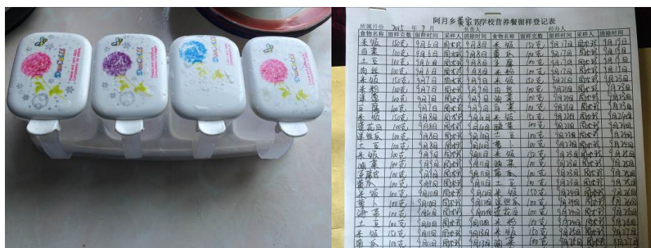
图 10 现场查见的空食品留样盒及记录表

关于“师生同餐”，调查当天该校教职工当日午餐系单独做菜开餐（图 11）。根据稽核评分规则，该项评分取 3 分；