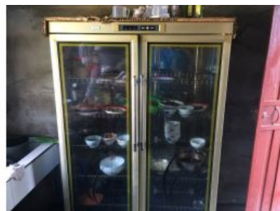
图6 存放着非学生餐具的消毒柜

关于“食材储存”，该校库存食材（大米）被随意存放于校外炊事员家小卖部（图7），存放条件极不符合要求。根据稽核评分规则，该项评分予以取1分；