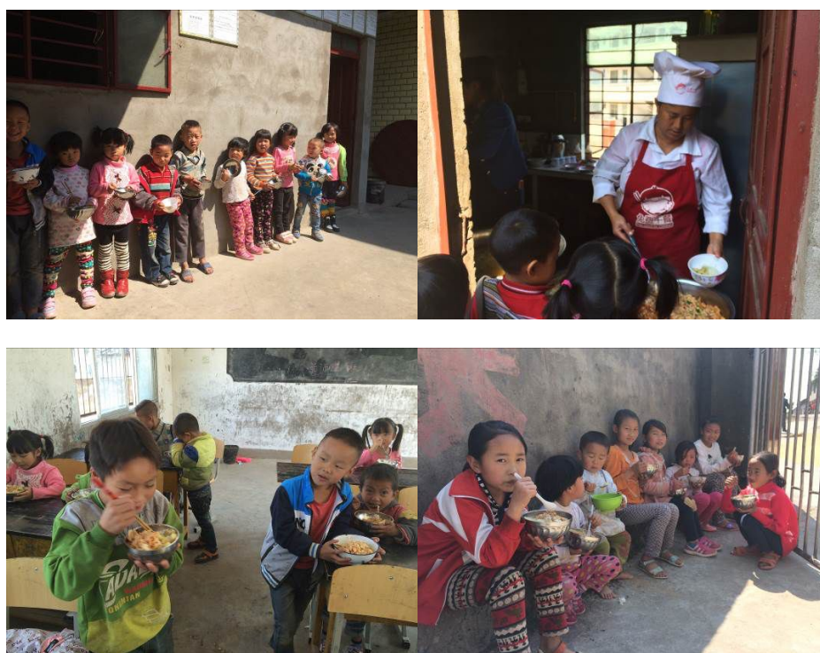
图 12 就餐现场