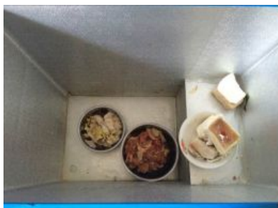
图4 冰柜内部生熟混放

关于“餐具消毒”，该校学生餐具均系自行保管自行清洗，而位于厨房的消毒柜则用于存放教职工餐具及炊事员自家餐具（图6）。根据稽核评分规则，该项评分取1分；