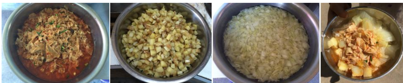
图 8 调查当日饭菜组图

调查当日，该校午餐质量较差，无荤菜、备餐量低，并且学生存在明显甚至严重吃不饱的情况，故本项调查各分项评分均按最低分值给分（0分或1分）。饭菜组图见图 8；