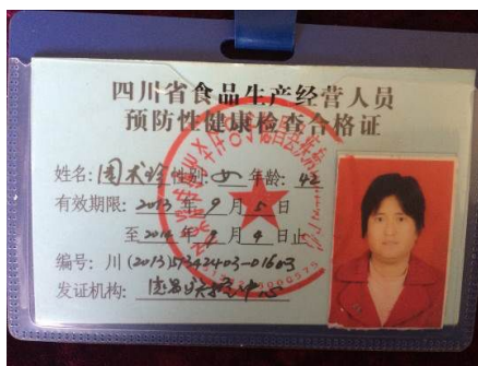
图 9 炊事员健康证(有效期截止日是2014年9月9日,过期一年)

关于“健康证”,该校炊事员健康证已过期一年(图9),炊事员及校长均称健康证正在补办,调查员存疑。根据稽核评分规则,该项评分取0分;