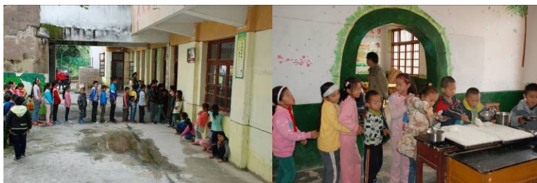
图 10 学生食堂自觉排队分餐图组