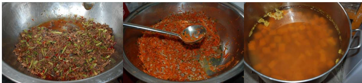
图 7 当天菜品组图

学校当天菜品是芹菜烧牛肉、红萝卜炒肉、南瓜汤，主食为米饭。菜品货真价实，味道可口，当天牛肉份量相当足，芹菜烧牛肉中只放了少量的芹菜和辣椒做配料。（见图 7）未见食品中有异物。