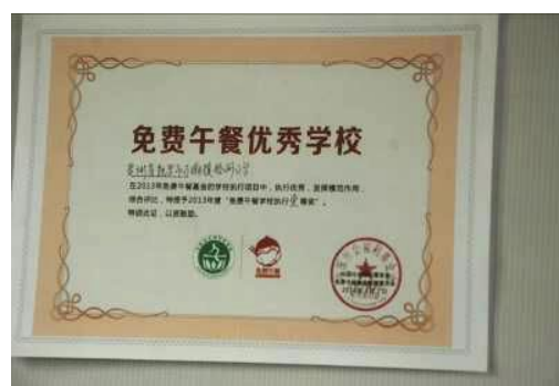
图 19 荣誉