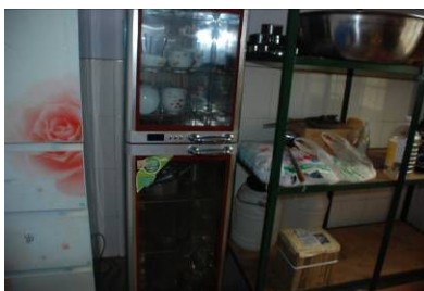
图 5 消毒柜正常使用