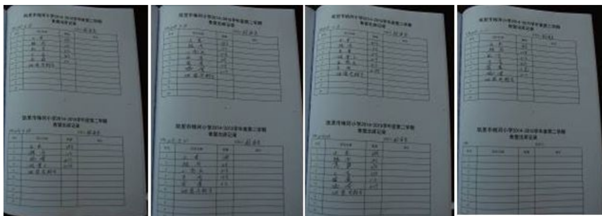
图 17 出库登记表组图