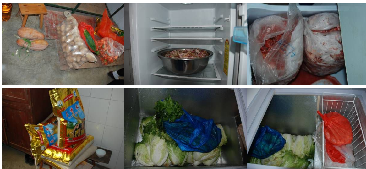
图 4 食材储存情况组图