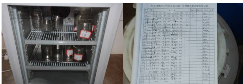
图 9 菜品留样合规范