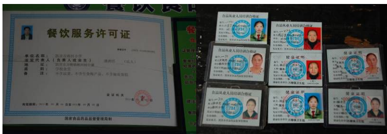
图 8 餐饮许可证及厨师健康证在有效期内