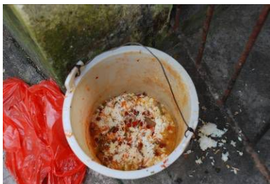
图 12 剩饭菜在正常范围