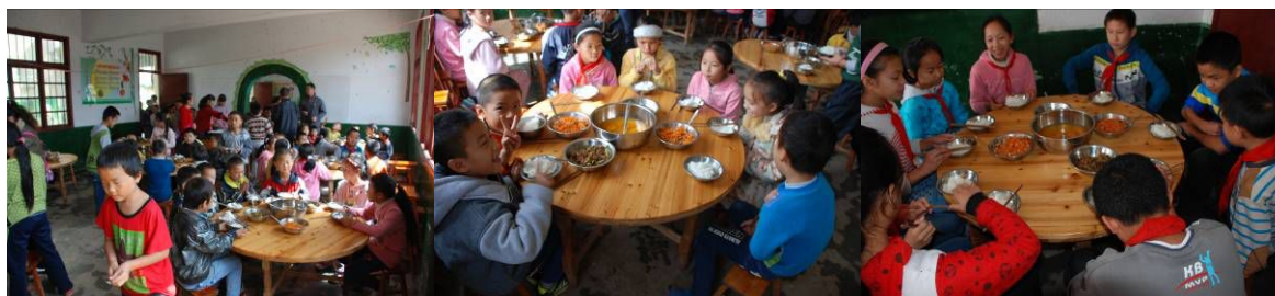
图 11 学生餐厅用餐图组