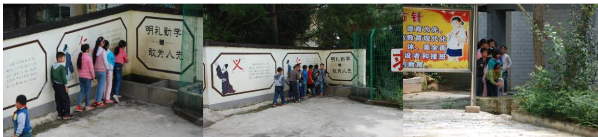
图 6 学生餐前自觉洗手