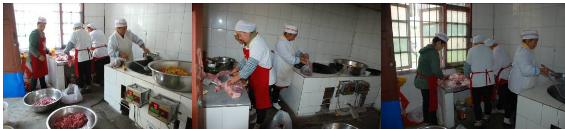
图 3 厨房及厨师情况组图

调查当天所见厨房及厨师个人卫生尚可, 学生餐具已消毒, 未见工作台上有生熟食混合存放现象。未见有腐烂变质食材, 学生餐前自觉排队洗手。