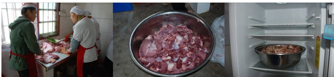
图 14 该校厨师在处理当天采购回来的猪肉和牛肉