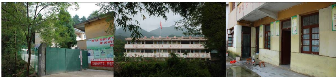
图 1 学校外观

免费午餐于 2013 年 3 月 12 日在该校正式开餐。中国社会福利基金会免费午餐基金向该校提供一笔开餐资金（用于购置冰箱等或厨房用品等）。免费午餐基金现向该校 19 名教职工、19 名学前班儿童提供 4 元/人的午餐费，义务教育制内学生有国家营养午餐提供的 4 元/人的午餐费。凯里市财政向学校厨师发放工资：1 名主厨 1500 元/月，3 名厨工 1200 元/月。免费午餐基金补助该校 2300 元/学期的水电等费用。