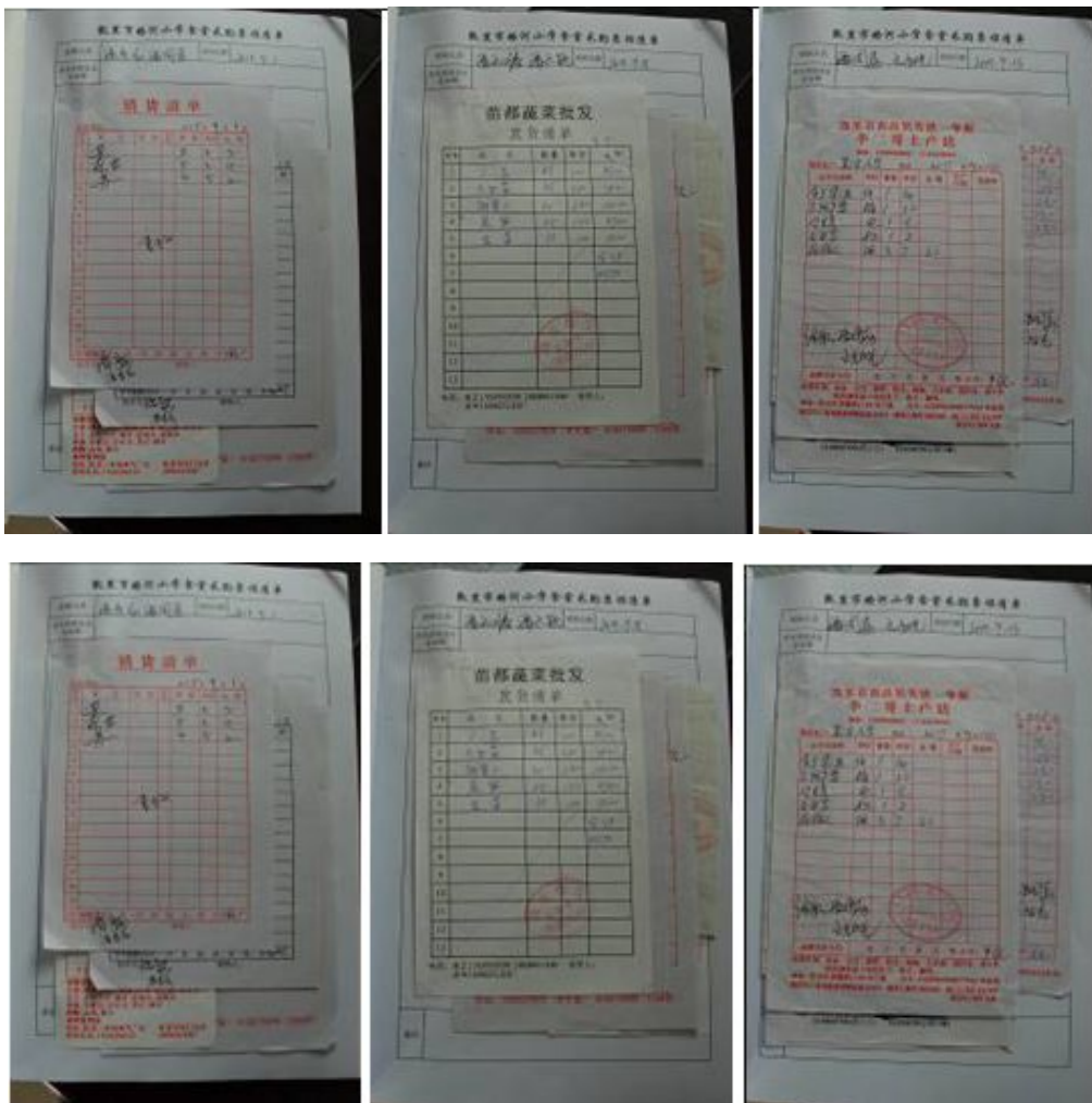
图 15 原始凭证组图