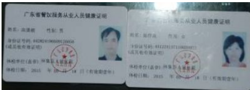
图6 厨师健康证(在有效期内)