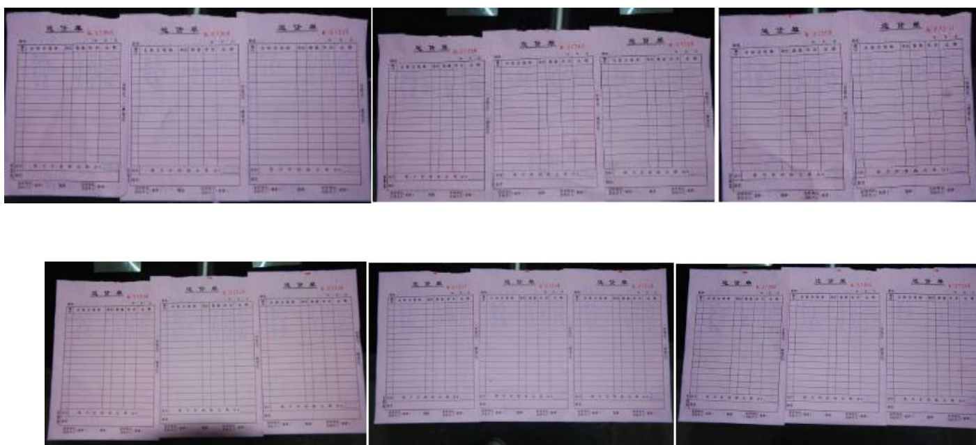
图 10 原始凭证组图