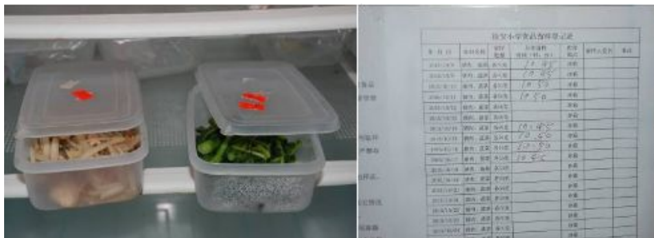
图7 菜品留样不合规范