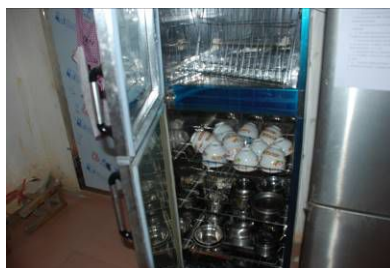
图 4 消毒柜正常使用