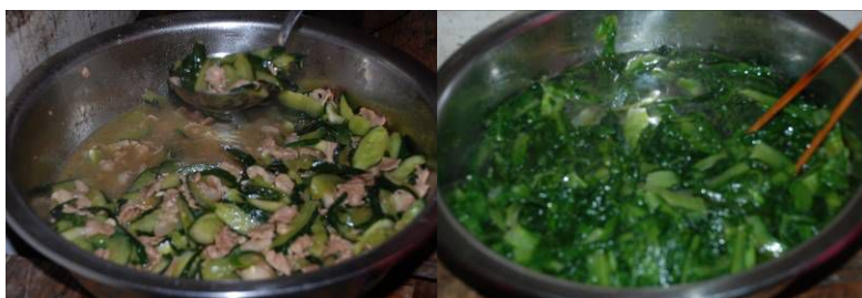
图 5 当天菜品组图