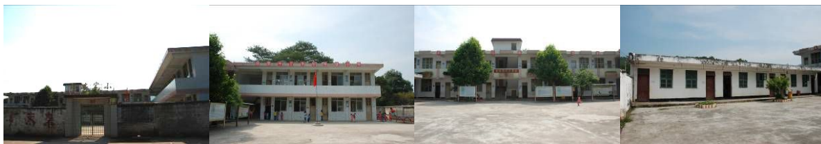
图 1 学校外观

免费午餐于 2012 年 4 月 17 日在该校正式开餐。中国社会福利基金会免费午餐基金向该校提供一笔开餐资金（用于购置冰箱等或厨房用品等）。免费午餐基金现向该校 14 名教职工及 73 名学生提供 4 元/人的午餐费。免费午餐基金现向 2 名厨师分别发放工资 1100 元/月及 1000 元/月。免费午餐基金补助该校 680 元/月的燃气水电等费用。寄宿生早、晚餐自己随便做点吃的充饥。