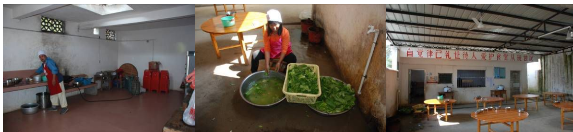
图 3 厨房及厨师情况组图