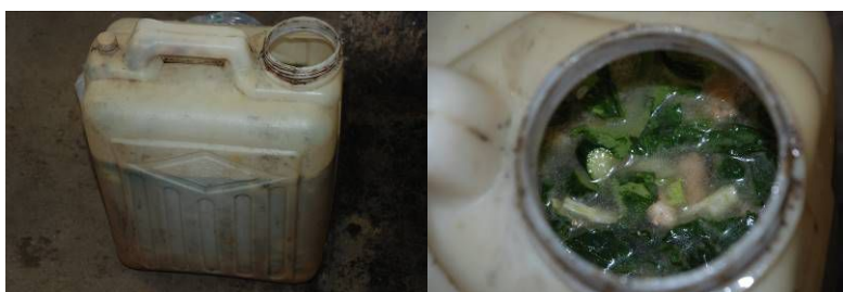
图9 剩饭菜在正常范围