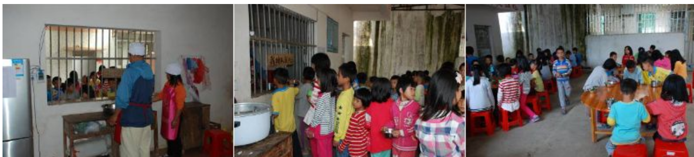
图8 学生领餐、用餐组图