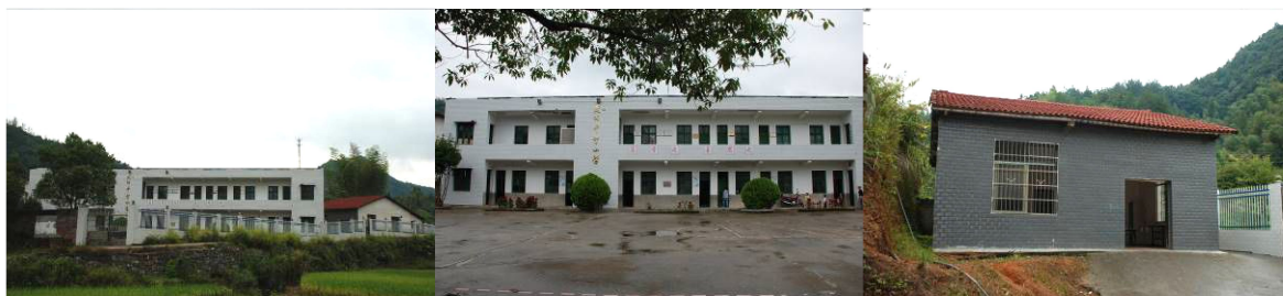
图 1 学校外观