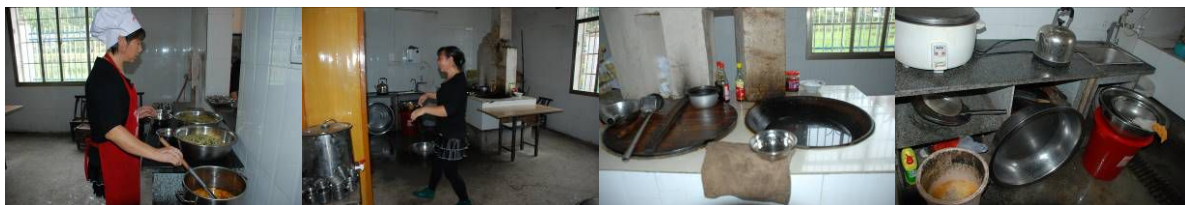
图 3 厨房及厨师图组

调查当天所见厨房及厨师个人卫生尚可, 学生餐具正常消毒; 未见有生熟食混合存放现象, 食材储存得当。未见有腐烂变质食材, 学生餐前排队洗手。