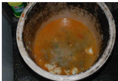
图 12 剩饭菜在正常范围