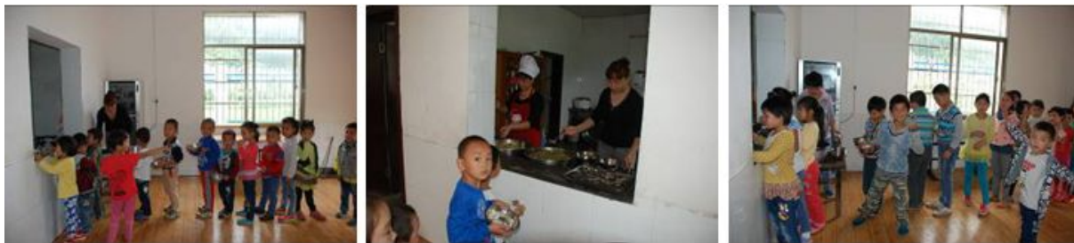
图 10 学生在餐厅排队分餐