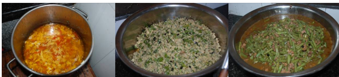
图 6 当天菜品

学校当天菜品是西红柿蛋汤，青椒炒蛋，青椒豆角肉丝，主食为米饭。菜品口味尚好。（见图 6）未见食品中有异物。