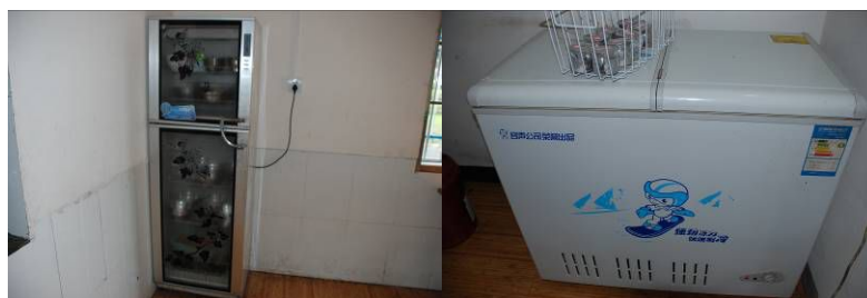
图 8 设备正常运行