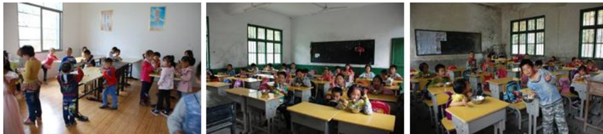
图 11 学生在餐厅、教室用餐