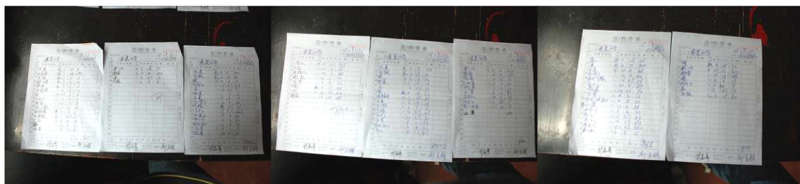
图 13 原始凭证