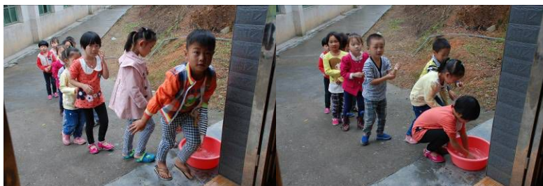
图 5 学生餐前排队洗手