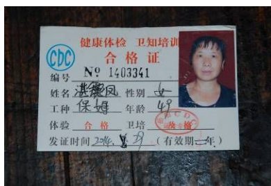
图 7 厨师健康证已过期

(1) “健康证”项扣除 5 分，扣分原因为该校厨师的健康证已过期。（见图 7）