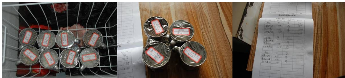
图 9 菜品留样合规范