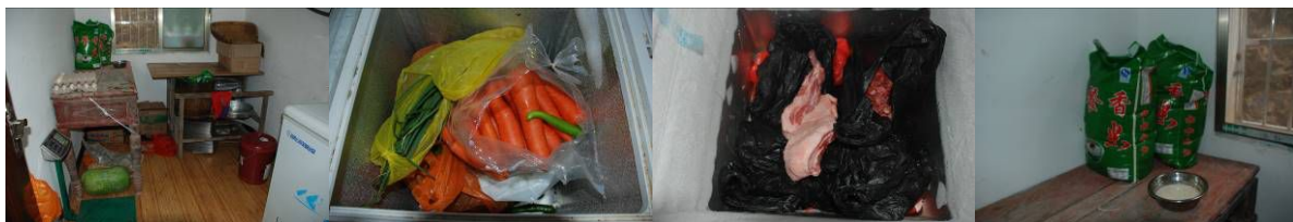
图 4 食材储存图组