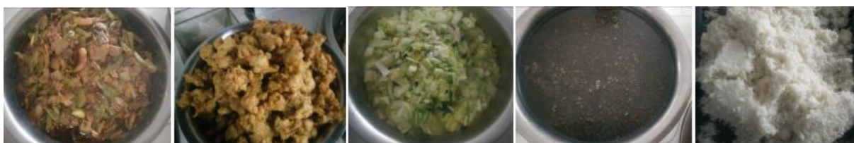
图 13 当日菜品组图