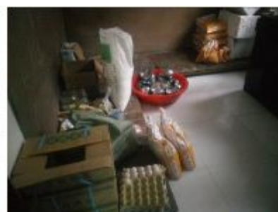
图 12 食材安全有序储藏组图