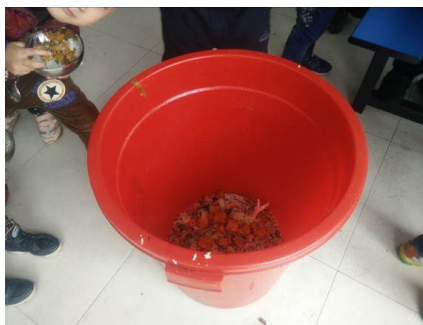
图 20 餐后的剩菜剩饭图（从近三百人用餐后的剩菜剩饭看，属正常现象）