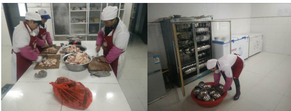
图6 厨工正规着装工作组图