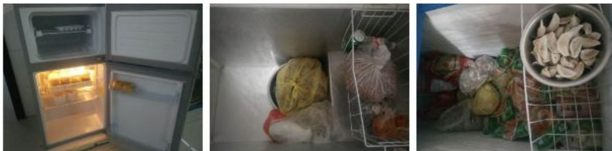
图5 冰柜内储藏的食物组图

“易变质食物保存”取3分, 扣分原因为冰柜内储藏的大部分食物都采取了隔离包装措施, 只有一盆生水饺没有采取安全隔离措施。校方回应: 是老师的食物存放在食堂冰柜内(如图5)。