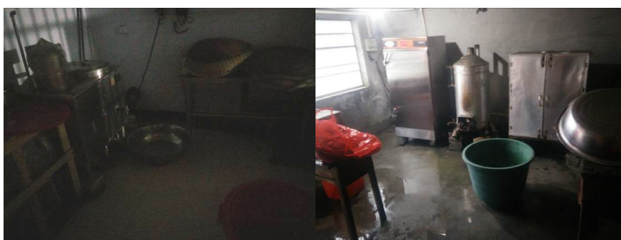
图 15 正常使用的厨房设备组图