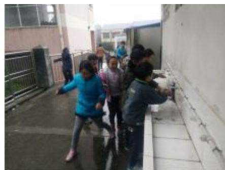
图 10 学生餐前洗手图