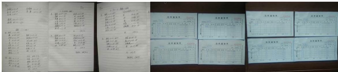
图 22 出库登记组图