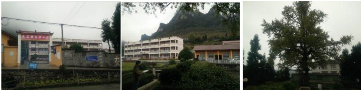
图 3 校园图片及校内千年古白果树图

厨房设备: 宇峰捐赠设备[消毒柜 1 台(有故障已上报县教育局, 未上报对接人)、蒸饭车 1 台、蒸气柜 1 台、冰柜 1 台、冷藏冰箱 1 台、电炒锅 1 台]; 政府配备设备[豆浆机 1 台(现已停用)]; 学校自购设备[冰柜 1 台]。