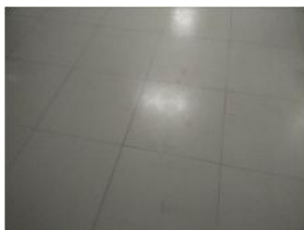
图 9 地面卫生图