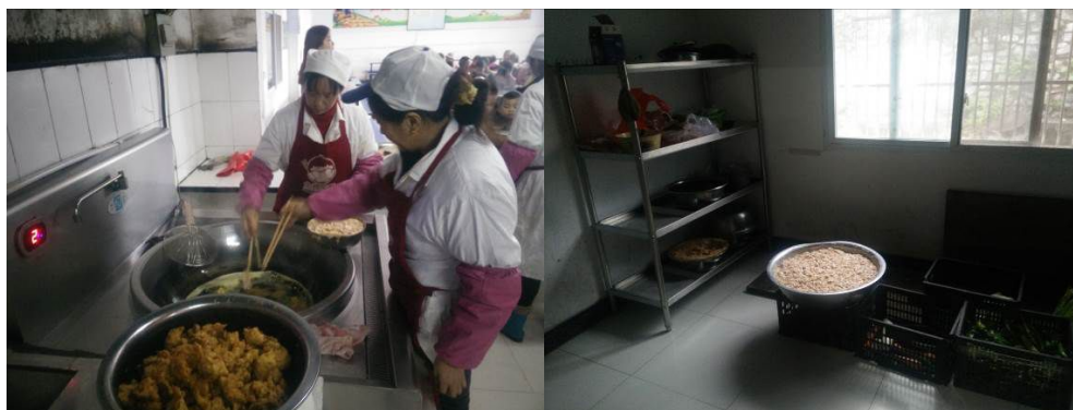
图 8 工作台生熟食分开组图