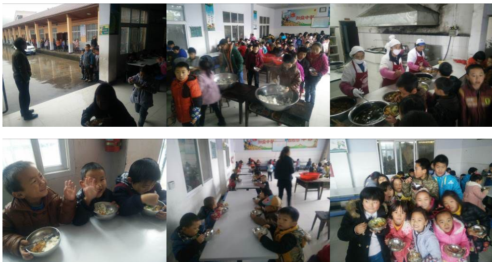
图 17 学生分餐、用餐情况组图