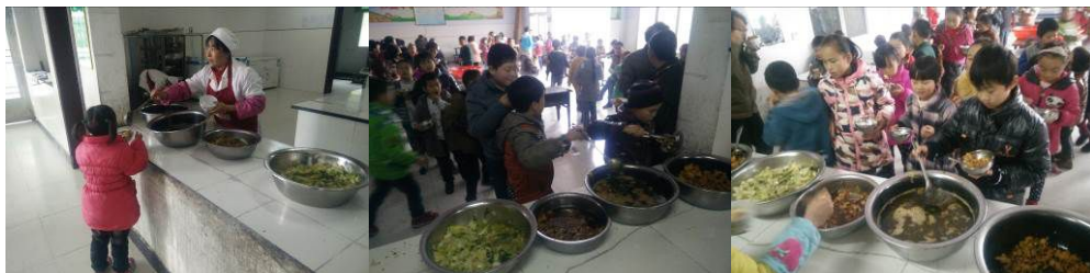
图 18 没吃饱的学生添加饭菜组图