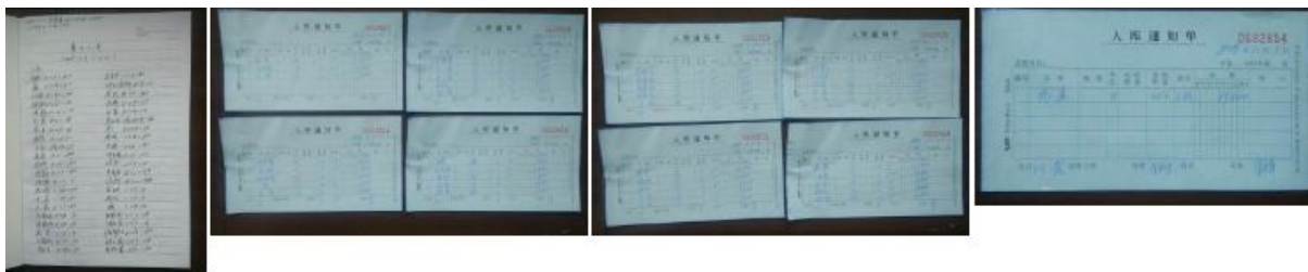
图 21 入库登记组图