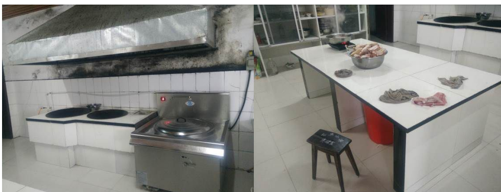
图7 厨房工作台组图