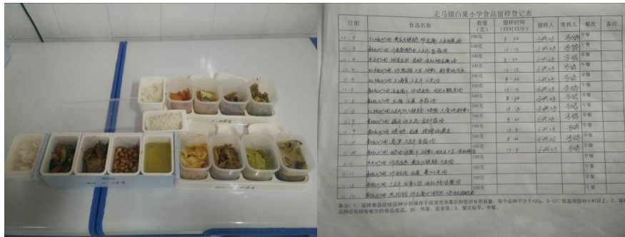
图 16 菜品留样与登记组图