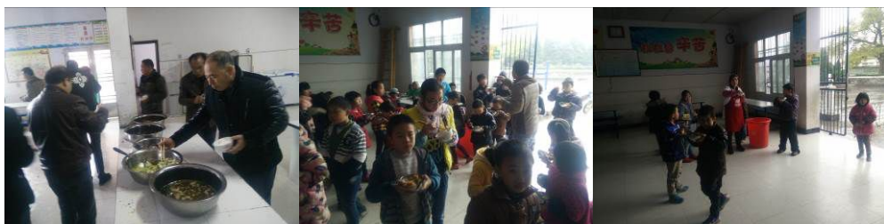
图 19 教职工用餐组图