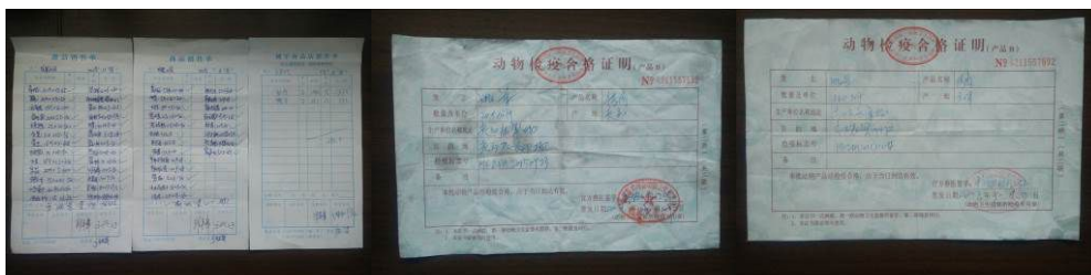
图 25 原始凭证组图