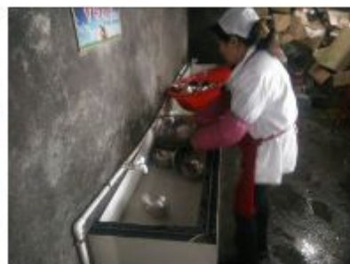
图 11 学生餐具的存放与清洗组图 (餐后学生的餐具由厨师统一清洗消毒)