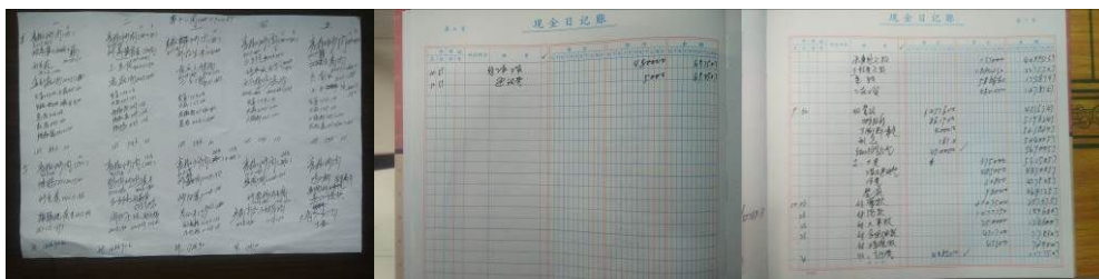
图 23 现金流水账组图