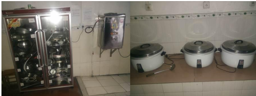
图14 正常使用的厨房设备组图