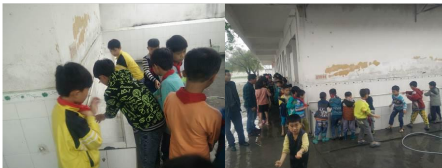
图10 学生餐前洗手组图