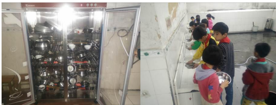
图8 学生餐具的清洗与消毒组图