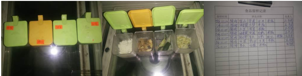
图12 菜品留样与登记组图

“菜品留样”取3分, 扣分原因为有菜品留样, 留样标签上无留样时间, 且写的是食材名称, 应写菜品名称; 相关登记上写的也是食材名称, 应写菜品名称, 只有监督老师签字, 无留样人签字。(如图12)