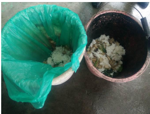
图 18 餐后的剩菜剩饭图