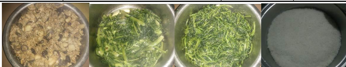
图 11 当日菜品组图