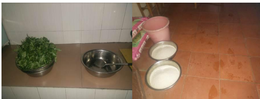
图6 工作台生熟食分开组图