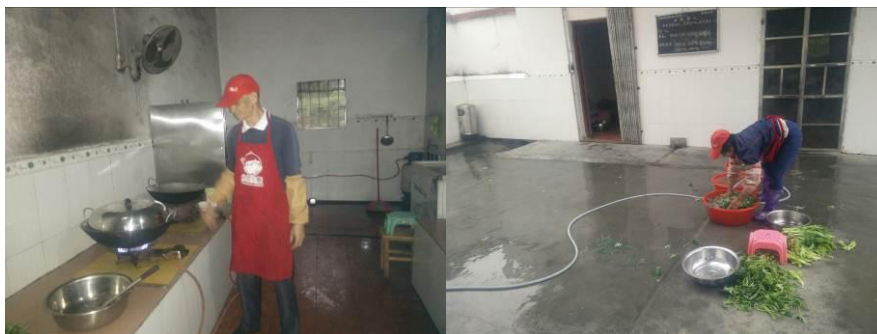
图4 厨工正规着装工作组图