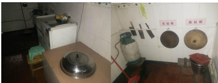
图5 厨房工作台组图