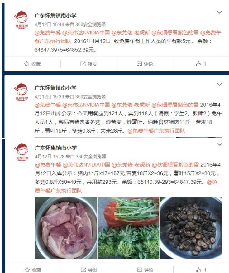
图 3 就餐人数的微博截图

当日就餐人数：学生 101 人（请假 2 人）+教师 14 人（请假 2 人）+厨师 2 人+调查人 1 人=118 人，稽核员缴午餐费 5 元，微博公示与实际用餐人数一致。