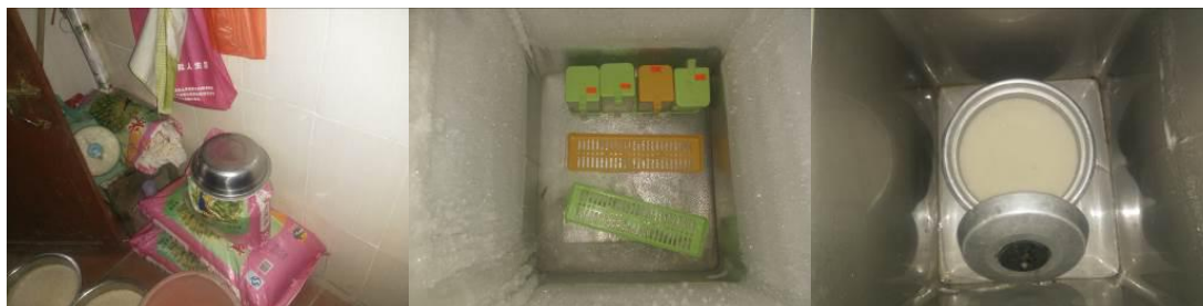
图9 食材安全有序储藏组图