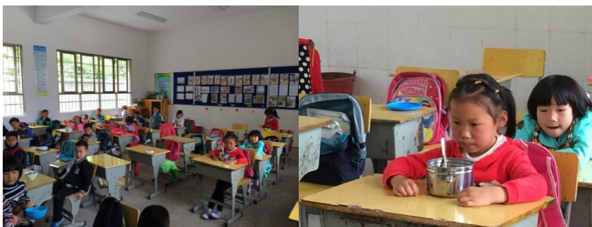
图 13 就餐现场