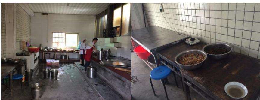
图8 厨房全景及局部组图