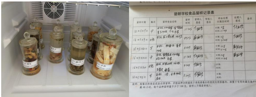
图 12 食品留样及记录表