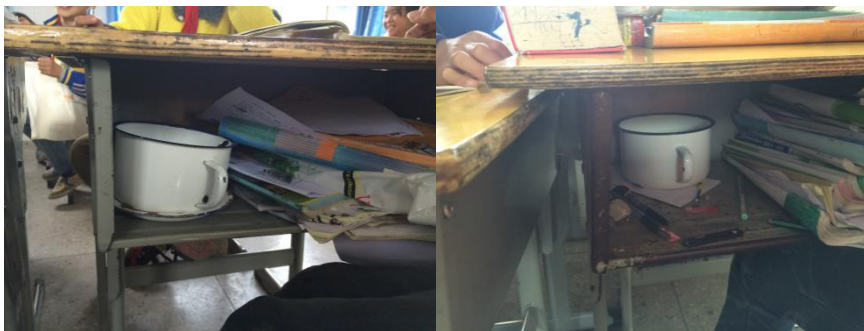
图7 存放于学生课桌内的餐具

关于“餐前洗手”，就餐前该校学生均无自觉洗手意识。由于该校人数较多，虽有室外水源，但集中洗手就餐仍存在困难。根据稽核评分规则，该项评分取3分。