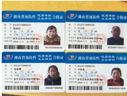
图 11 有效的炊事员健康证