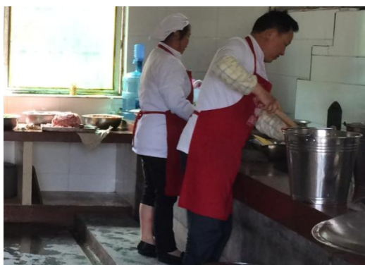
图4 正在备餐的炊事员

关于“厨房工作台”，备餐期间，该校厨房工作台相对凌乱，卫生状况一般。根据稽核评分规则，该项评分取3分；