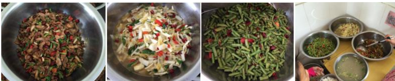
图 10 当日菜品组图