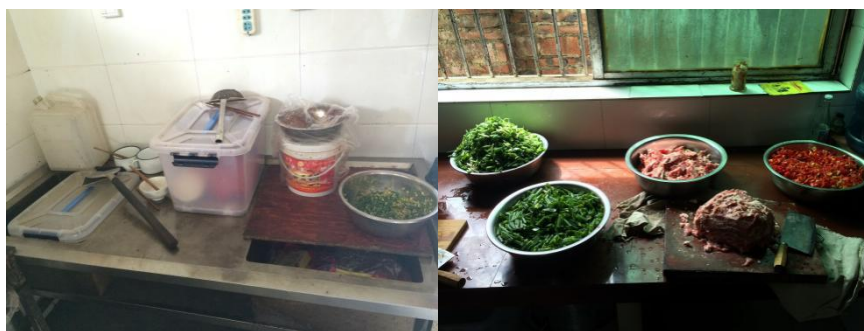
图5 厨房工作台情况

关于“厨房工作台”，备餐期间，该校厨房工作台相对凌乱，卫生状况一般。根据稽核评分规则，该项评分取3分；