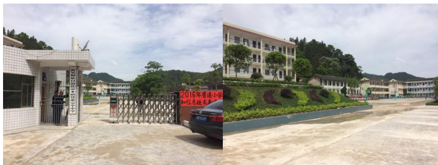
图 2 凳寨乡中心小学大门及校园环境