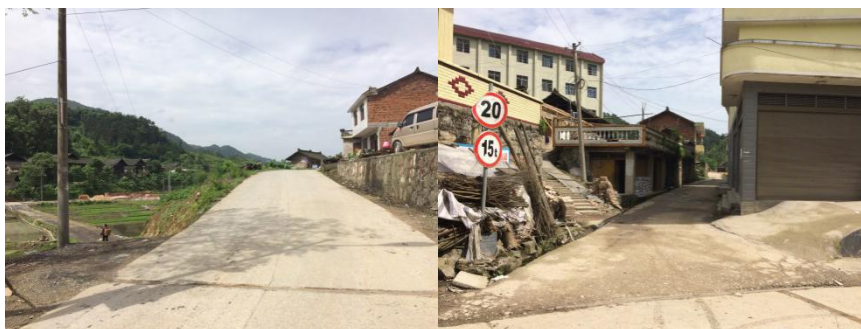
图1 凳寨乡中心学校周边路况组图

交通提示:新晃至凉伞交通路况良好,日常客运班车有两条线路走:一条是经贵州玉屏、新晃黄雷方向的北线,一条是经新晃扶罗、新寨方向的南线,两线用时差不多;凉伞至凳寨路况良好,日常有客运面包车,但客源较少,如赶时间则需购买全部座位。