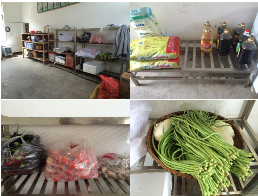
图9 食材储藏情况组图