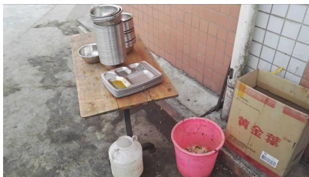
图 18 餐后的剩菜剩饭图