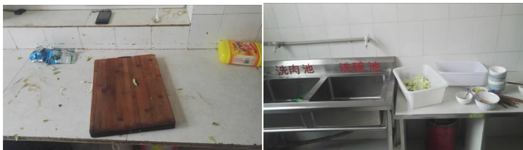
图 5 厨房工作台组图