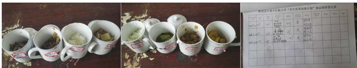
图 15 菜品留样与登记组图