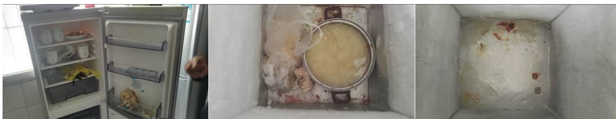
图 7 冰柜内部组图