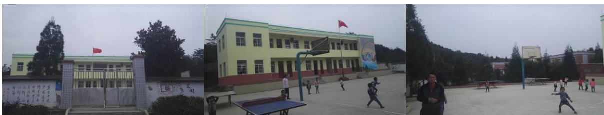
图 2 学校情况组图

厨房共有设备 11 台配备情况不详, 其中有冰柜 2 台、消毒柜 2 台 (大的已坏)、蒸车 3 台 (2 台已坏), 留样冰柜、冰箱、切肉机、柴油灶各 1 台。