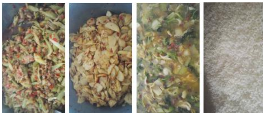
图 12 当日菜品组图