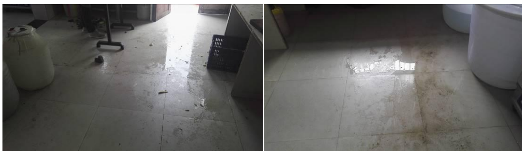
图 6 地面卫生组图