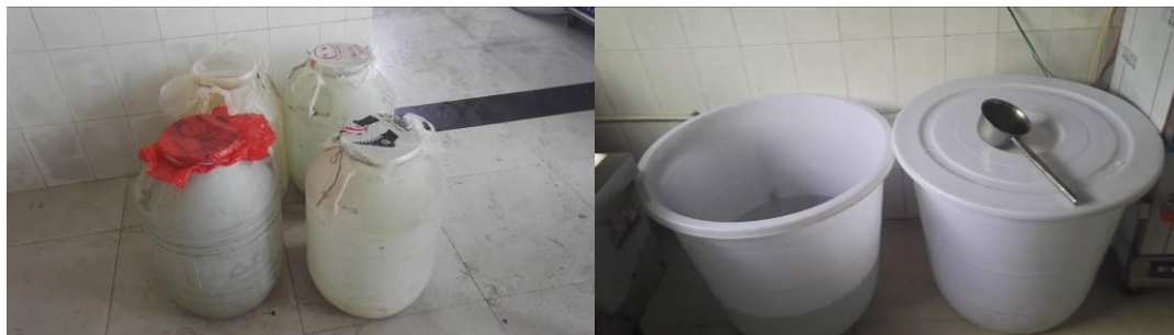
图 8 食堂用水组图