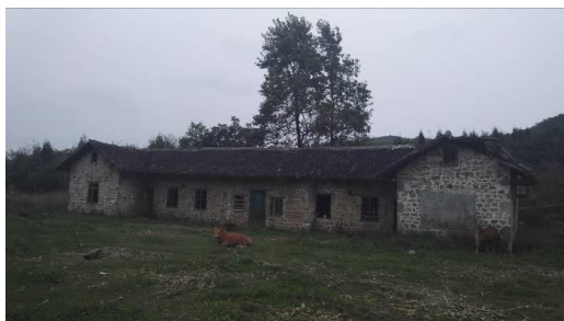
图 3 学校旧址图