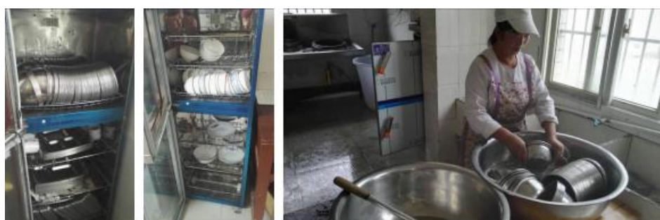
图10 学生餐具的存放、清洗与消毒组图