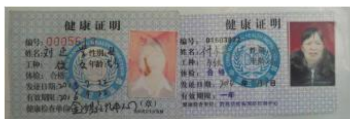
图 13 厨师健康证图