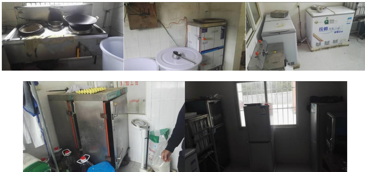
图 14 厨房设备组图