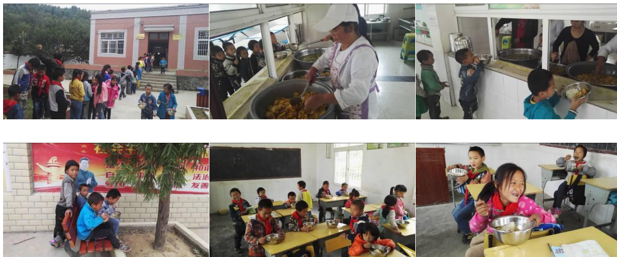
图 16 学生分餐用餐情况组图