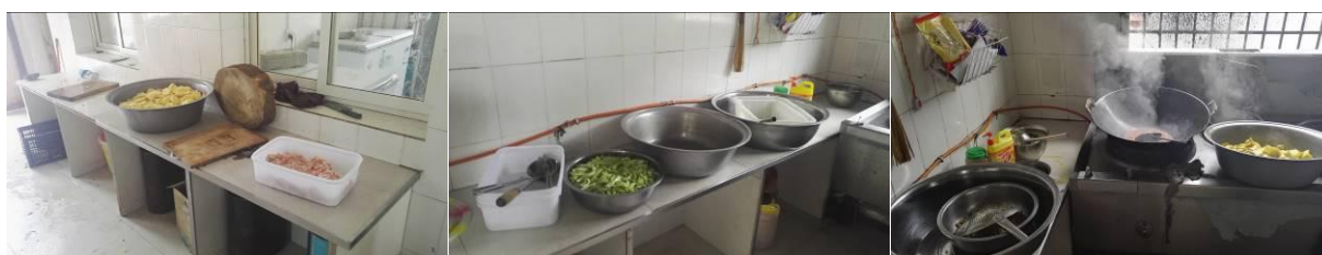
图9 厨房工作台生熟食存放组图