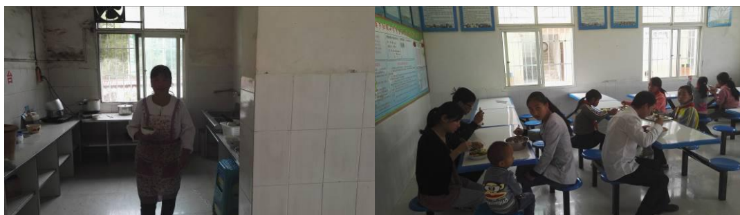
图 17 教职工用餐组图