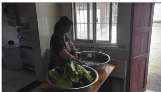
图 4 厨工着装工作图