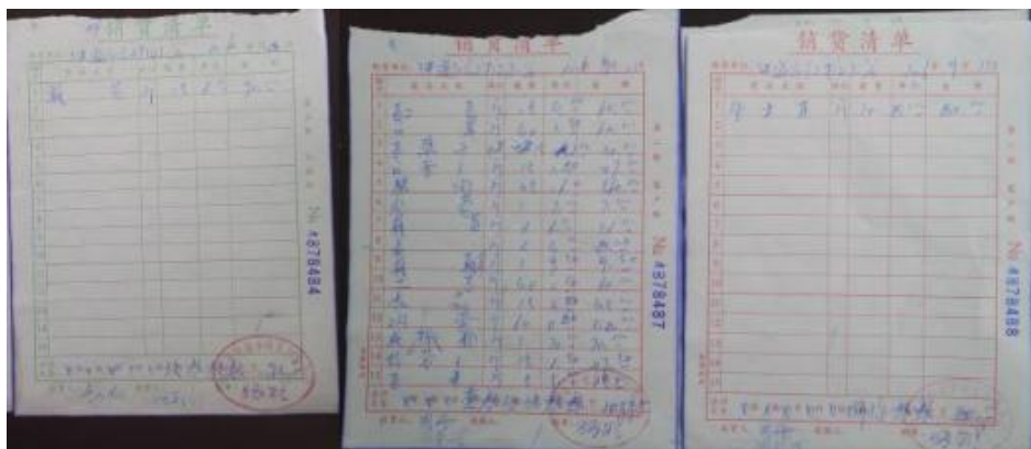
图 20 原始凭证组图