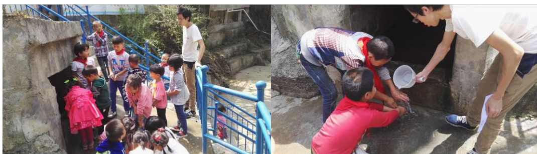
图11 学生餐前洗手组图