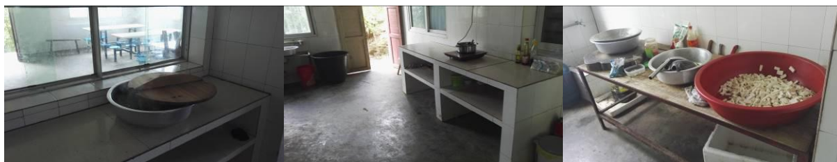
图8 厨房工作台暨生熟食存放组图