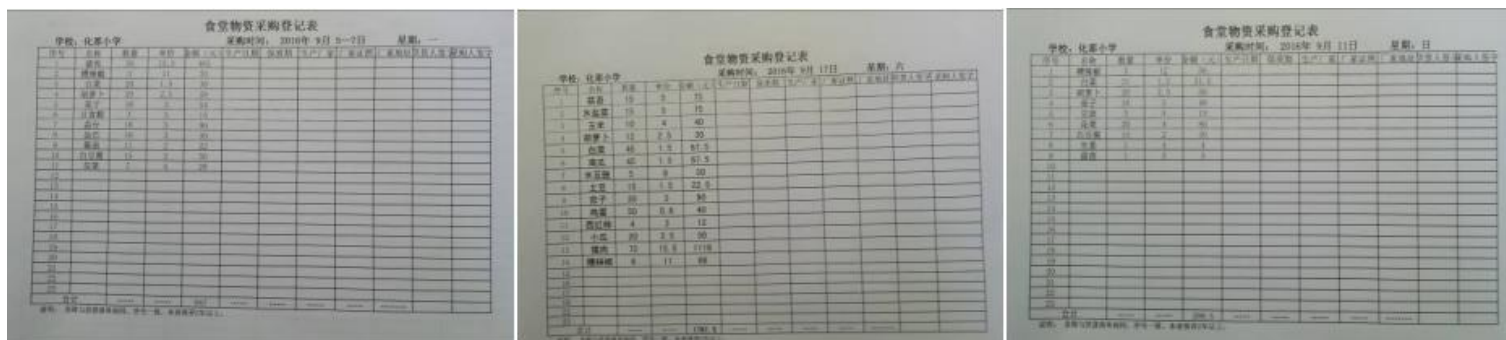
图 22 入库登记组图