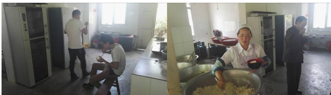
图 19 教职工用餐组图