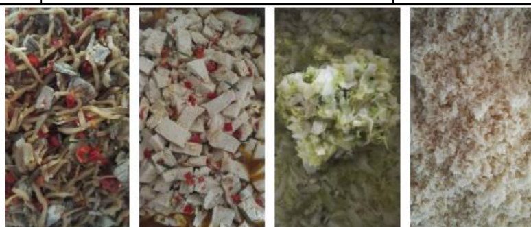
图 12 当日菜品组图