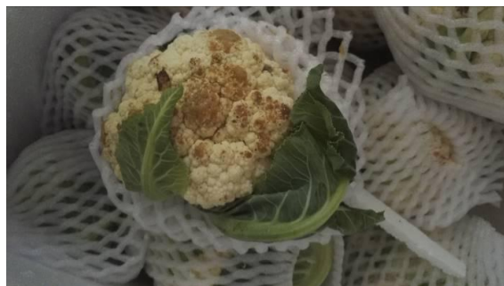
图5 出现腐烂蔬菜图