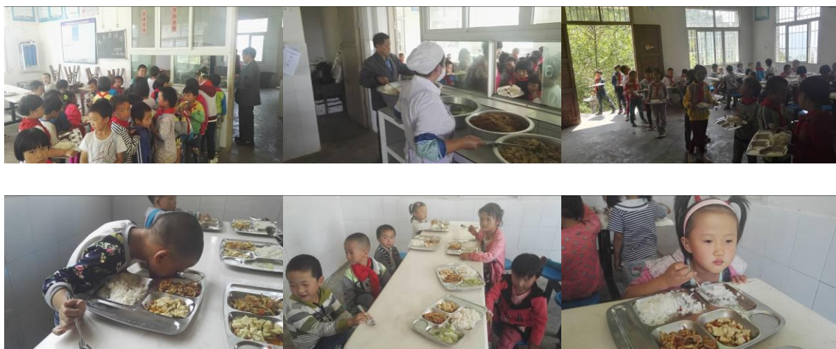
图 18 学生分餐用餐情况组图