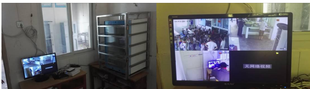
图 20 食堂安装的监控设备全程监控配餐与用餐组图