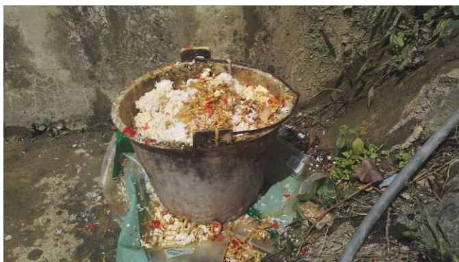
图15 餐后的剩菜剩饭图