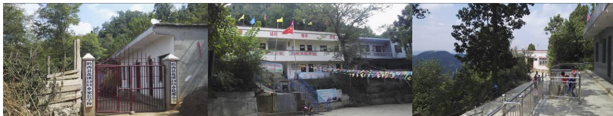
图 2 学校情况组图

厨房共有设备 6 台，其中免费午餐配备的设备有冰柜、消毒柜、蒸车各 1 台，学校自购设备有留样冰柜、煤气灶、消毒柜（已坏）各 1 台。