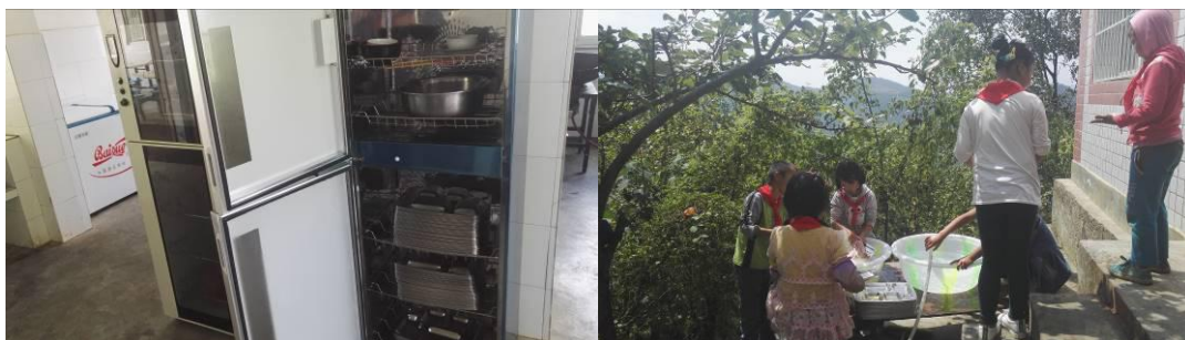
图9 学生餐具的存放、清洗与消毒组图