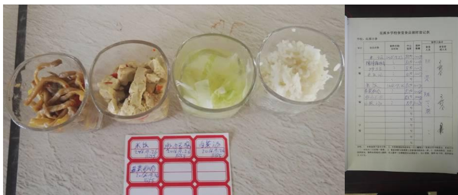
图 17 纠正后的菜品留样与登记组图