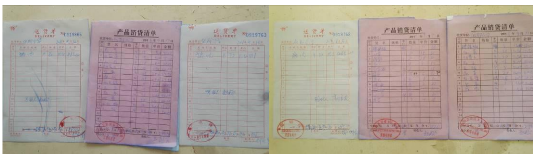
图 21 原始凭证组图