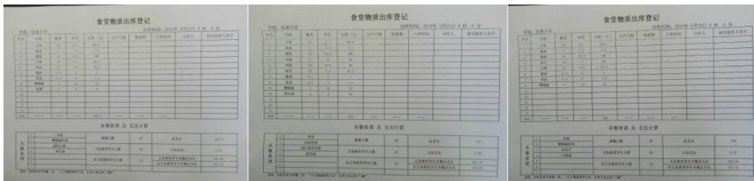
图 23 出库登记组图