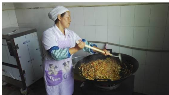
图6 厨工着装工作图