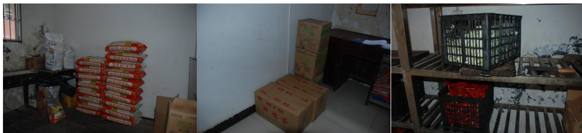
图5 食材储存情况组图