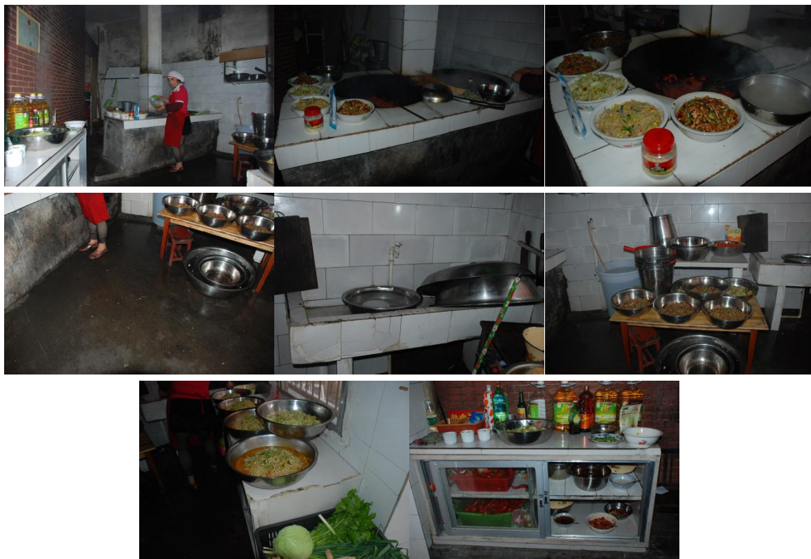
图4 幼儿园厨师厨房情况组图