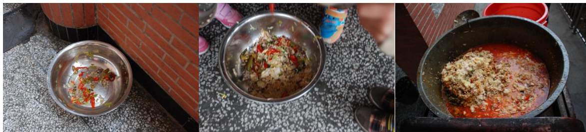
图 14 餐后浪费情况