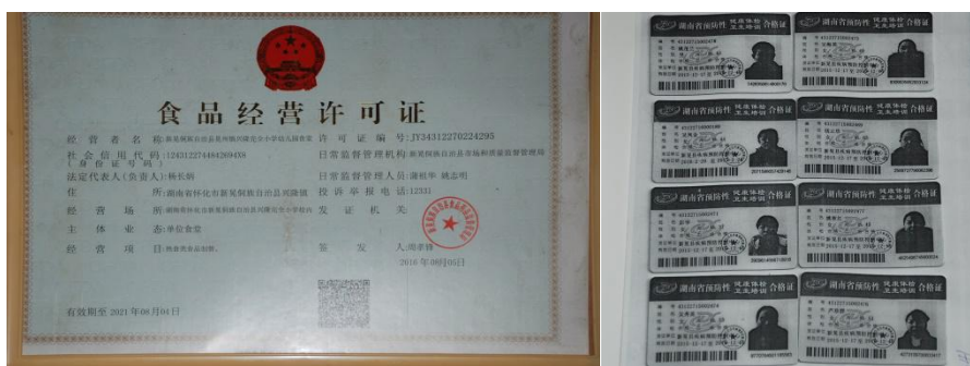
图10 公示栏证照及厨师健康证图组