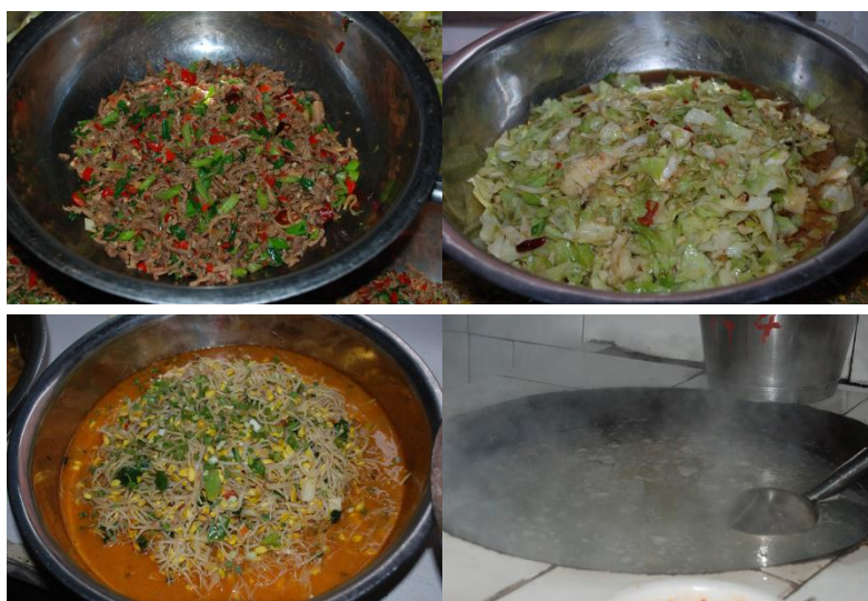
图 9 调查当日幼儿园午餐食品组图