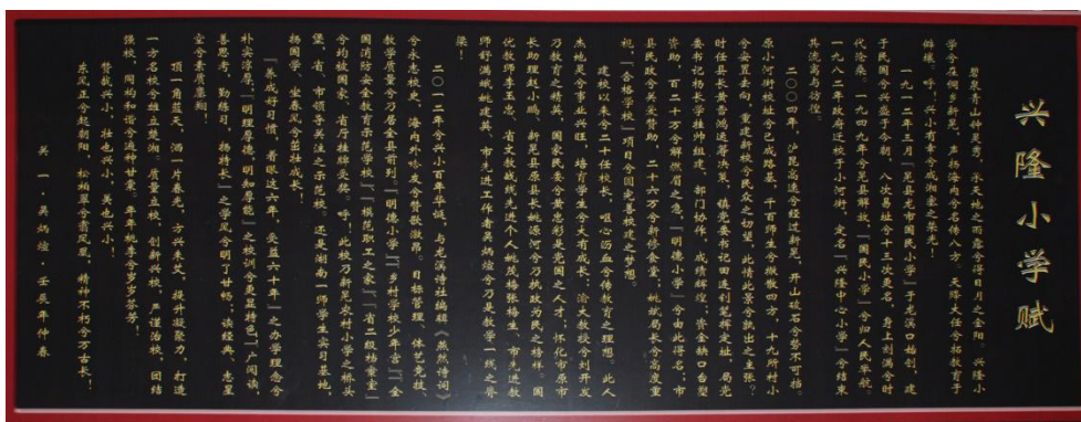
图1 学校外景内景组图