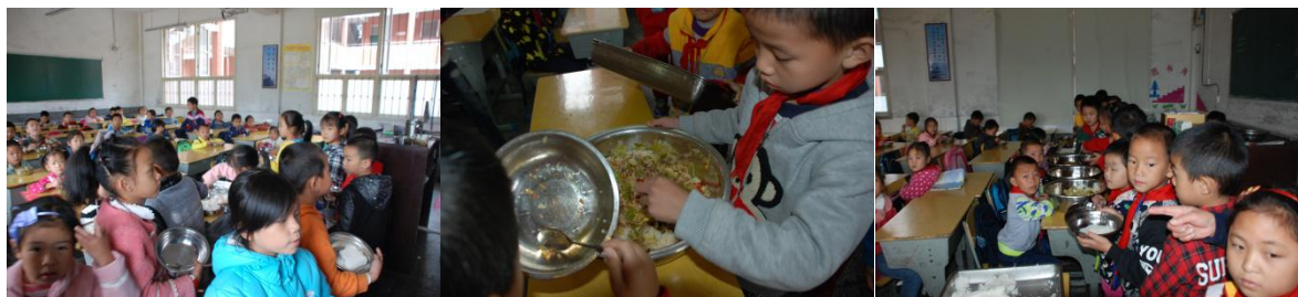
图 13 小学部午餐就餐组图