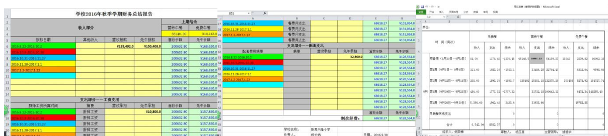
图 18 现金流量账组图