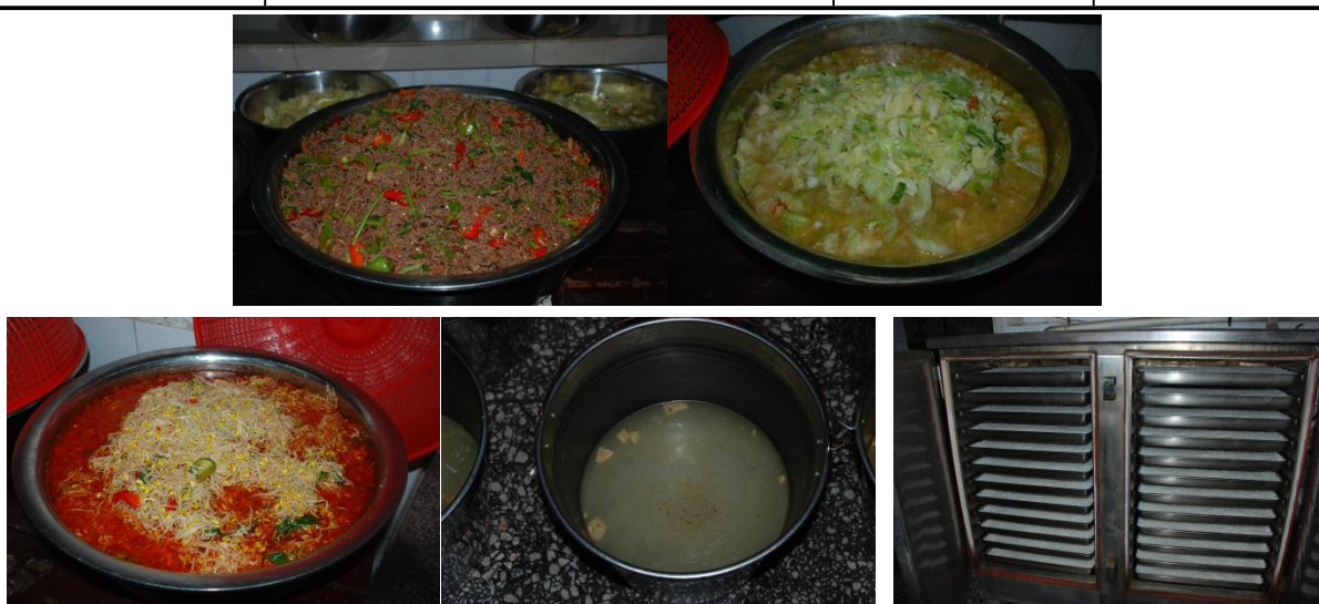
图 8 调查当日小学部午餐食品组图