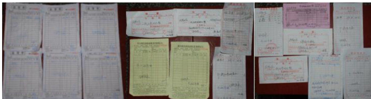
图 15 学校食堂管理采购信息组图