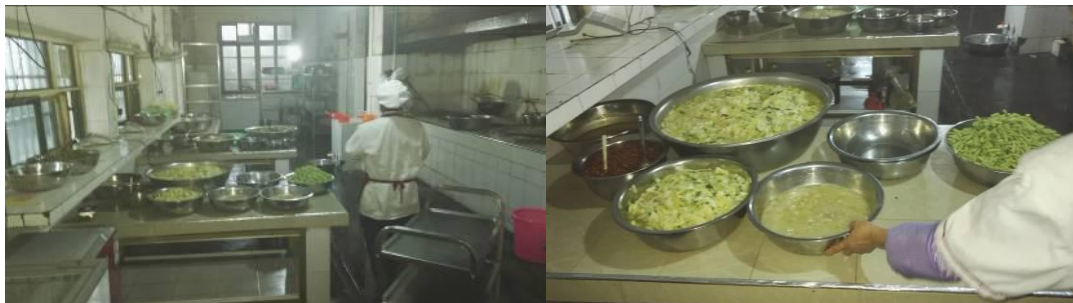
图 6 厨房工作台暨生熟食存放组图