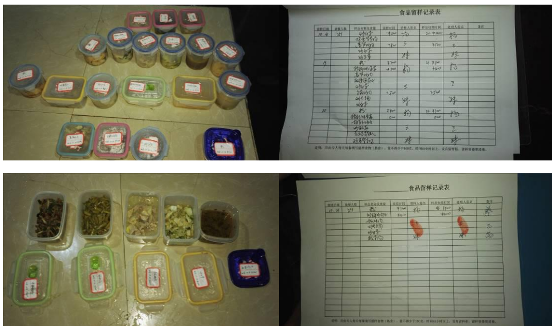
图 12 菜品留样与登记组图