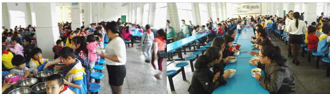
图 16 教职工用餐组图