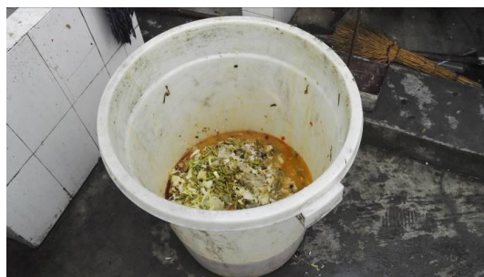
图 17 剩菜剩饭图