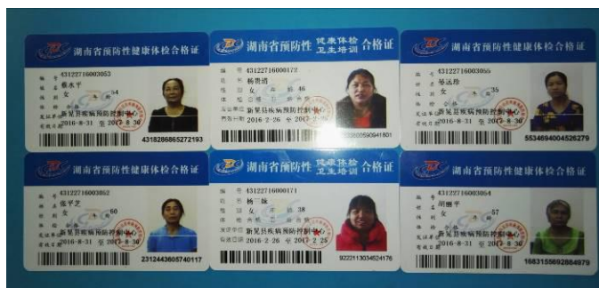
图 13 厨师健康证图