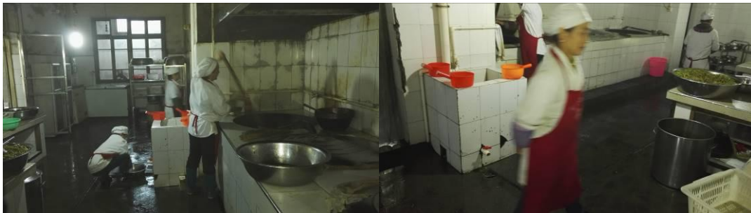
图 4 厨工着装工作组图

(3) “墙面地面卫生”取 3 分,扣分原因为厨房地面较湿,且有积水。(如图 5)