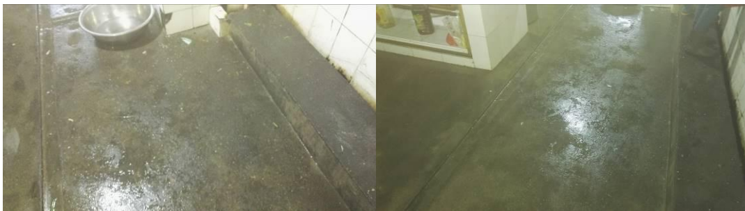
图 5 厨房地面卫生组图