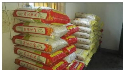
图 9 食材储藏组图