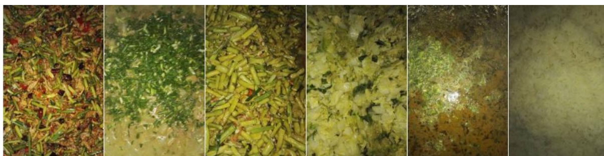
图 11 当日菜品组图