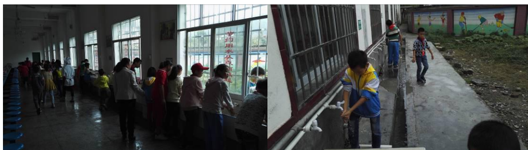
图 10 学生餐前洗手组图