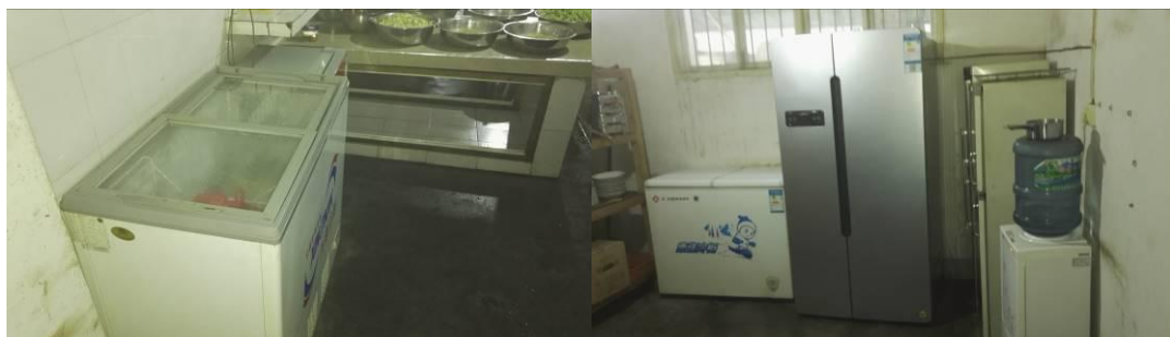
图 14 厨房设备组图