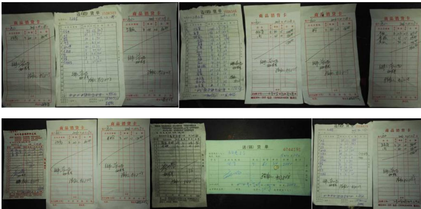
图 19 原始凭证组图