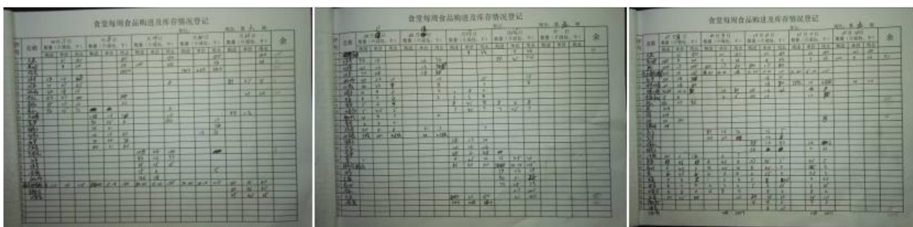
图 18 入库登记和现金流水账组图

“入库登记”取 3 分，扣分原因为入库登记上记录的入库食材内容不全，且无相关责任人签字。校方回应：以为原始凭证签字验收很详实，可以代替入库资料，这个登记只是简要记录一下。（如图 18）