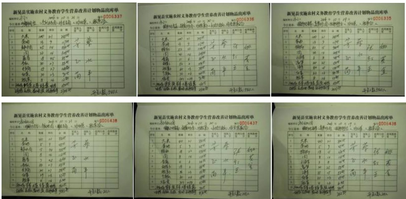
图 20 出库登记组图