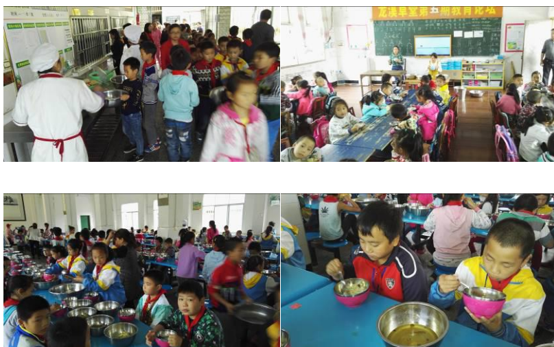
图 15 学生分餐用餐情况组图