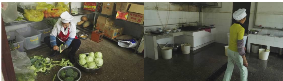
图 11 厨工着装工作组图