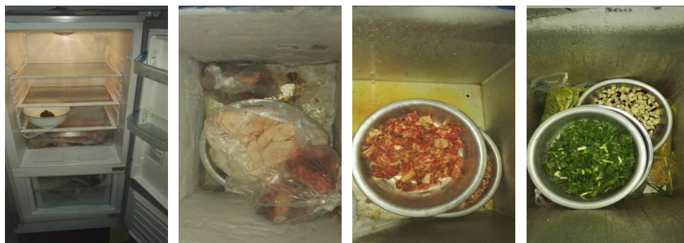
图 6 冰箱、冰柜内部卫生组图