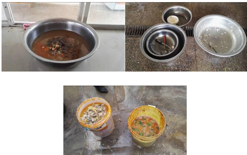
图 23 剩菜剩饭组图