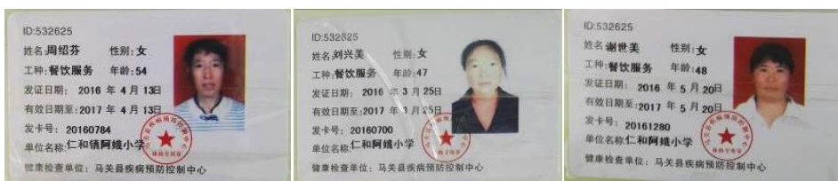
图 19 厨师健康证图