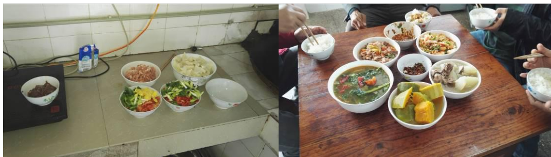
图 15 当日教职工菜品与单独配制组图