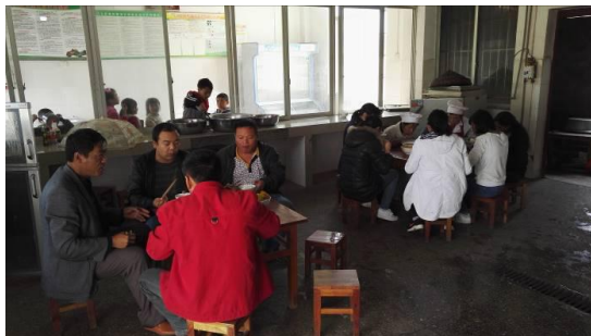
图 18 教职工用餐情况图