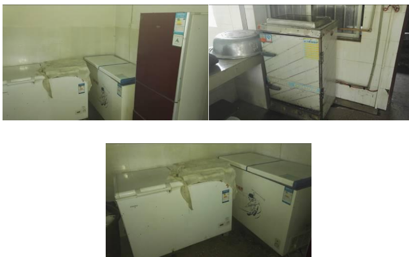
图 20 正常使用的厨房设备组图