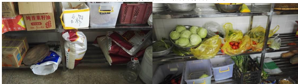
图 13 食材储藏组图