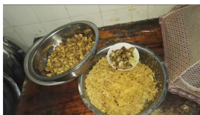
图 12 厨房工作台暨生熟食存放组图