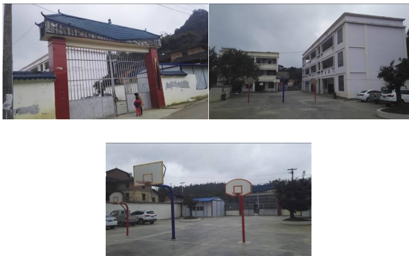
图 2 学校情况组图

厨房共有设备 15 台，其中免费午餐配备设备有冰柜、冰箱、蒸车各 1 台；中心校配备设备有留样柜、切肉机、削皮机各 1 台，消毒柜 8 台（6 台已坏，已申报免费午餐，于 11 月 18 日配备到位）；学校自购设备有冰柜 1 台。