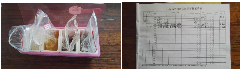
图 21 纠正后菜品留样与登记组图