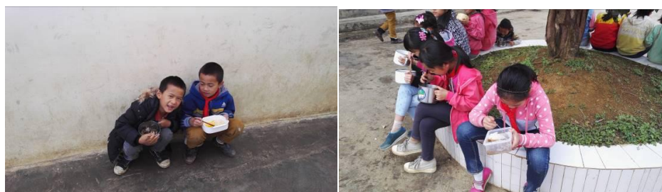
图 8 使用塑料制品餐具的学生组图