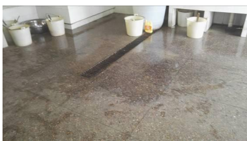
图4 厨房地面卫生图