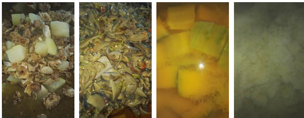
图 14 当日学生菜品组图