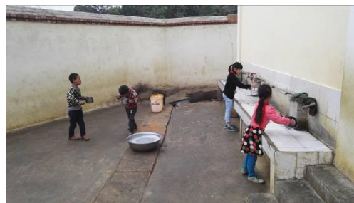
图 10 餐前主动洗手的学生图