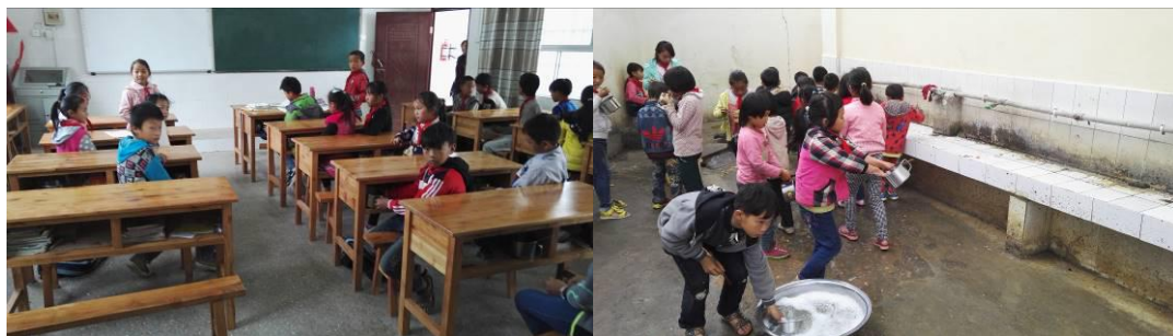
图 7 学生餐具的清洗与存放组图