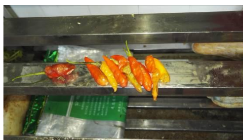
图5 出现腐烂的辣椒图