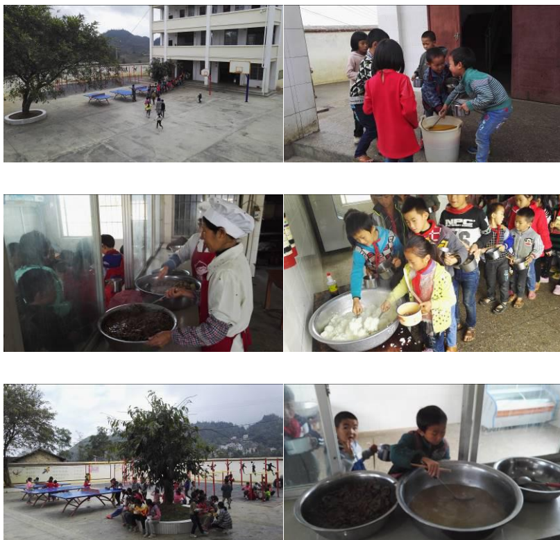
图 22 学生分餐用餐情况组图