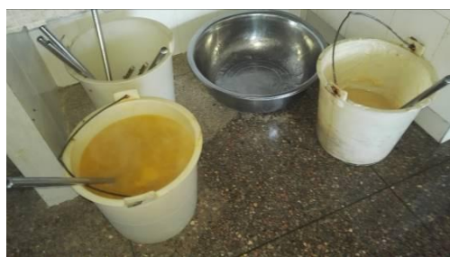
图 9 厨房盛菜品的塑料制品容器图