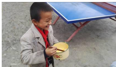
图 16 部分学生只吃煮南瓜和白米饭组图