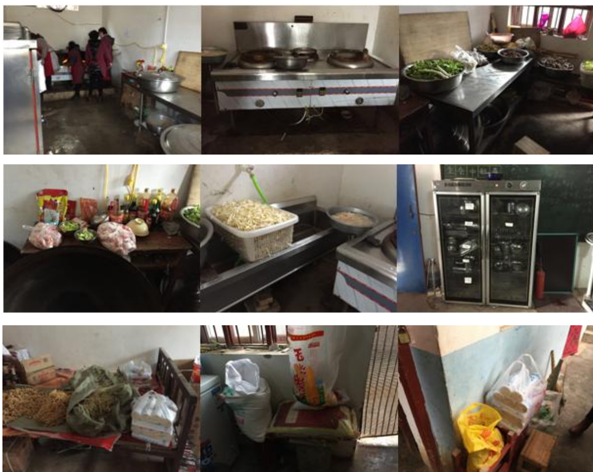
图 5 厨房和储藏间情况组图

下课后学生和老师们会到厨房领本班的午餐,两位老师一个班级,在教室分餐并就餐。学生餐具由自己清洗,个别学生自己保存,其他学生会将餐具送到消毒柜中消毒保存,每天消毒一次。