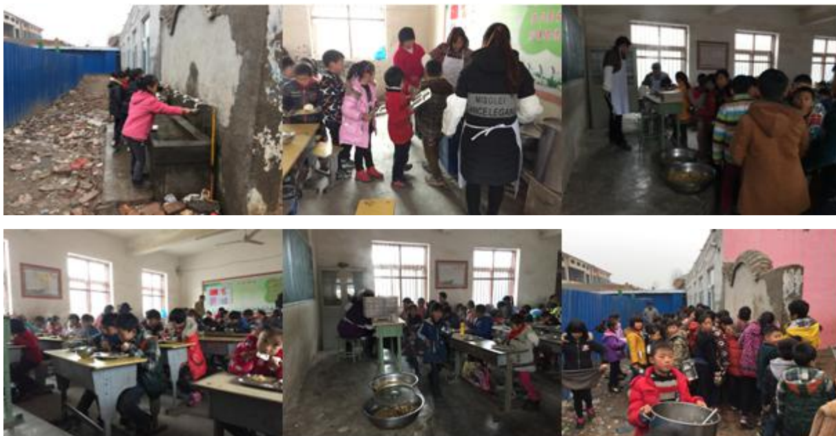
图 8 就餐过程组图