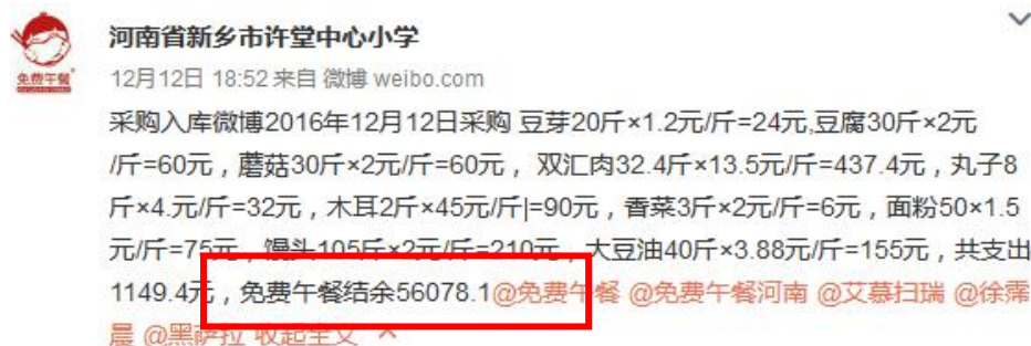
图 4 微博截图

追加扣分原因: 调查人在校期间恰巧赶上做馒头的商贩送货到学校, 调查人询问馒头价格, 商贩说零售价为 1.9 元左右一斤, 当调查人询问学校送货价时商贩吞吞吐吐说一块多, 没有具体价格, 从商户表情和反应来看价格明显低于市场零售价, 调查人查看学校采购单和微博, 公示的价格为两元一斤, 因此调查人断定学校存在虚报菜品价格的嫌疑。详见图 4 微博截图。