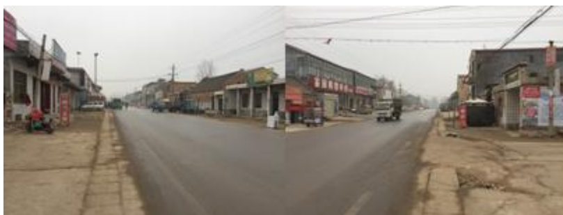
图1 交通情况和许堂村情况组图

12月12日早在乘出租车前往原阳县老汽车站(当地人称为转盘),乘坐9:30的班车前往许堂村,约30分钟后到达许堂中心小学,在学校附近停留至10:20分进校调查,调查结束后搭乘该校老师顺风车返回原阳县,乘坐大巴前往郑州市,再转乘大巴前往平顶山市鲁山县。相关费用:原阳县到许堂村,班车车费4元;原阳县到郑州汽车北站,班车费17元;郑州市到鲁山县,班车费59元。