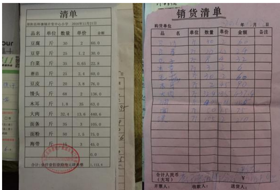
图9 原始采购单据组图