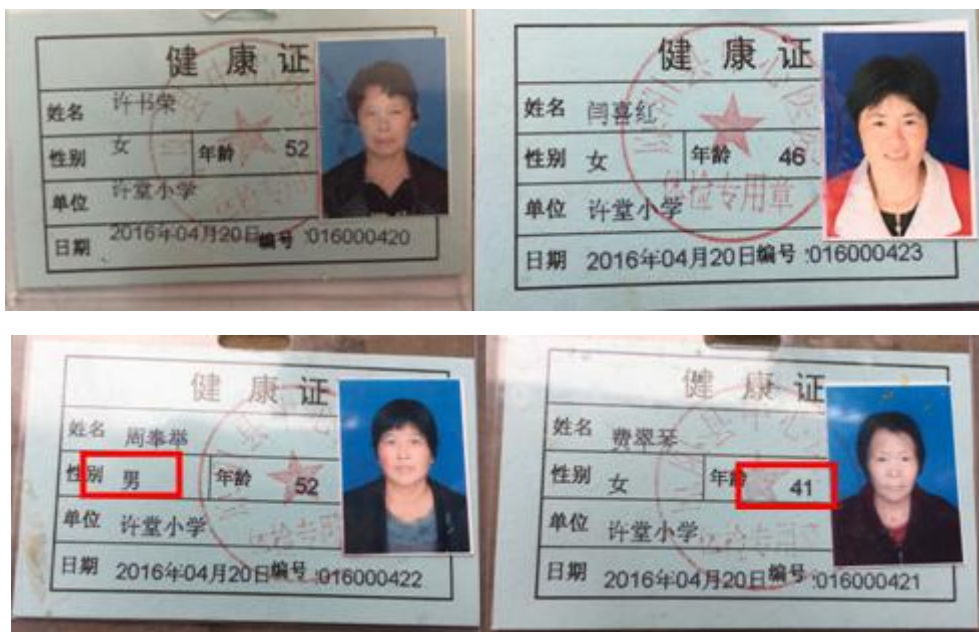
图 7 厨师健康证组图