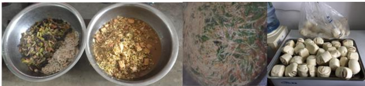
图 6 开餐当日菜品组图