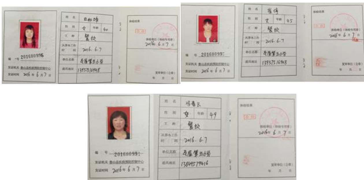
图 6 厨师健康证组图