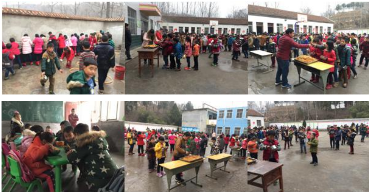
图 8 就餐过程组图