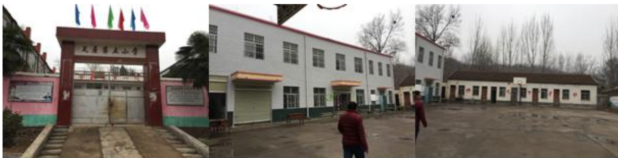
图 2 学校情况组图

校长：张宝山，负责采购；段庆伟老师负责整个开餐工作，包括：微博发布、出入库记录、现金账记录、采购等工作。