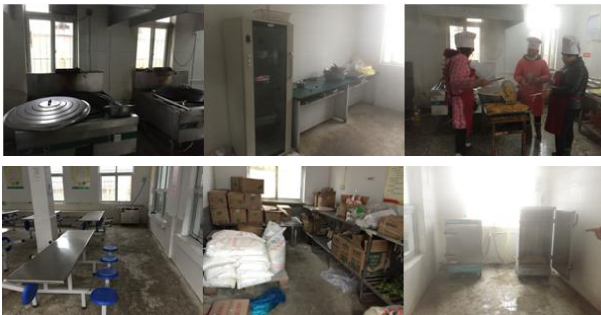
图 4 厨房和储藏间情况组图

下课后厨师会将午餐分好，由各班老师将饭菜端至位于食堂外的桌子上，学生排队领餐，领完餐后有的会在食堂就餐，大部分会在操场就餐，学前班会提前开餐，由教师负责分餐，在教室就餐。调查人观察，大部分学生会进行餐前洗手。学生餐具由自己清洗并保存。太平教学点的午餐由该校教师到刺坡岭小学领取，并用三轮车运输回学校。