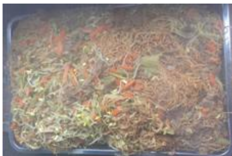
图 5 开餐当日菜品组图