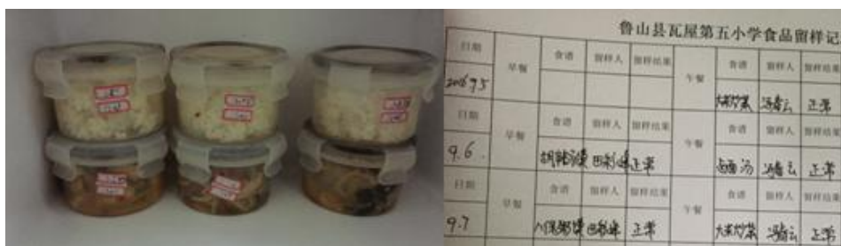
图 7 留样及留样记录组图