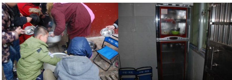
图5 餐具消毒情况组图