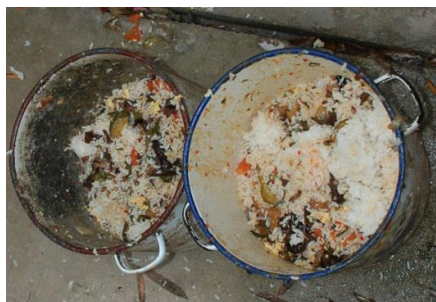
图 10 餐余图