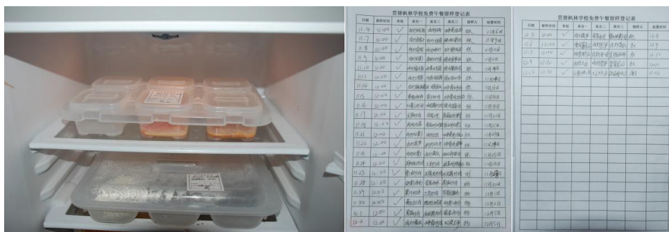
图 8 食品留样及登记表