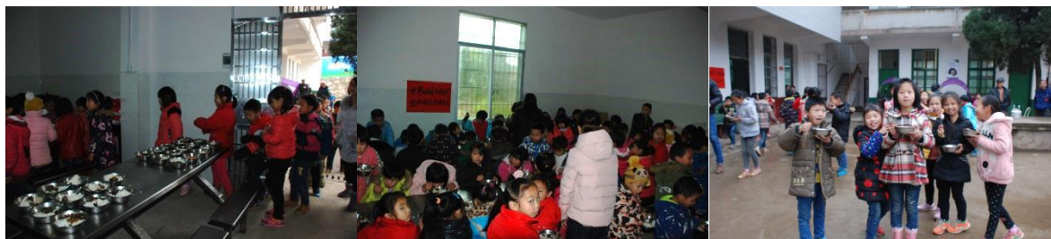
图 9 午餐就餐现场组图