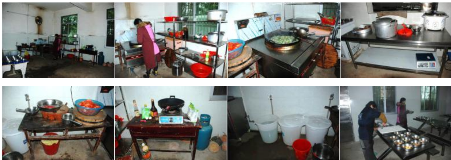
图 3 厨房及厨师卫生情况组图