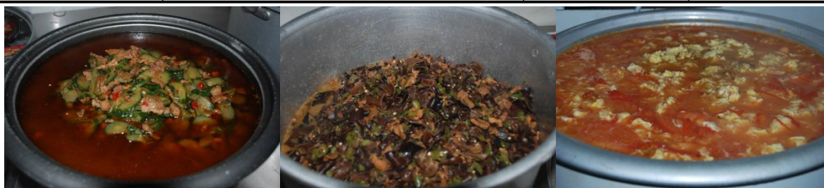
图6 调查当日菜品组图