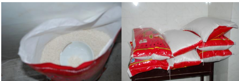
图 4 食材储藏情况组图