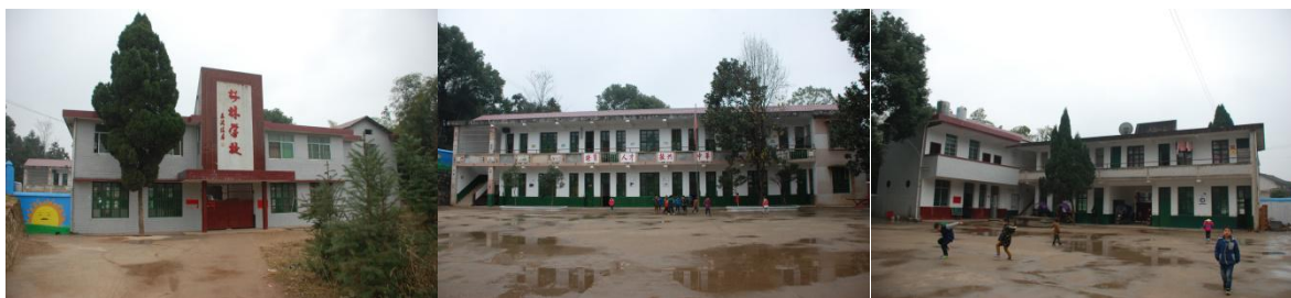
图 1 校园环境组图

该校现任校长杨峰, 会计是谢迎香老师, 出纳是李友元老师, 采购为两位老师一组轮流采购, 验收是杨峰和赵声树两位老师, 学校微博维护是张羽。该校午餐 12 点开餐。