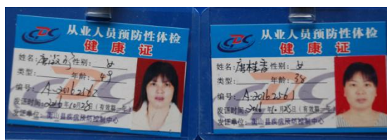
图 7 厨师健康证