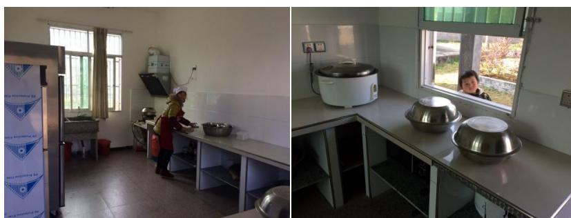
图 5 厨房操作间各区域情况组图