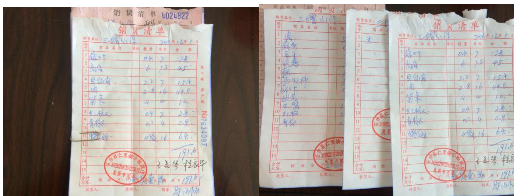
图 12 采购原始凭证组图