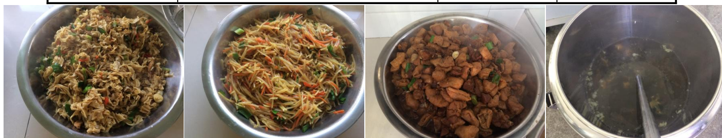
图 8 调查当日学生菜品组图