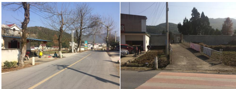
图1 三增小学周边路况组图