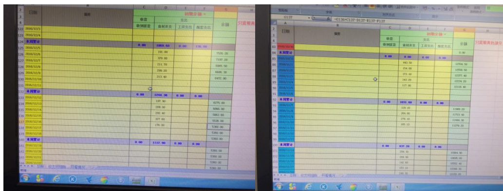
图 14 财务总结报表组图