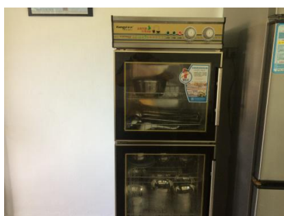
图 7 餐具管理情况图