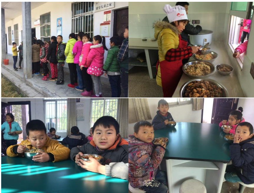
图 11 午餐就餐现场组图