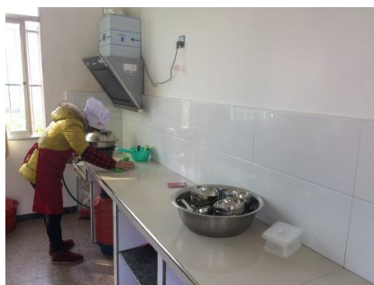
图 4 厨师着装情况