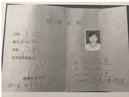
图 9 厨师健康证图