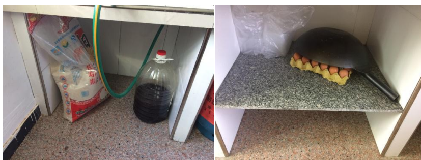
图 6 食材储藏情况组图