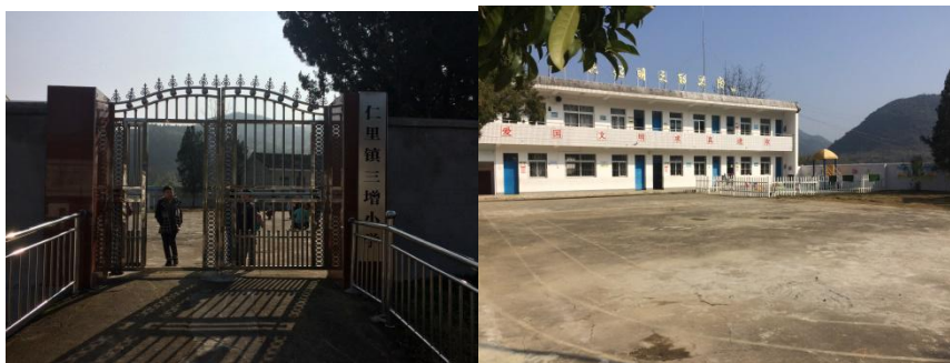
图 2 学校校园环境组图

该校现任负责人查正孝老师。学校食堂采购、出入库及财务等均由桂佳华老师一人独立负责,学校微博由刘琼老师负责维护。