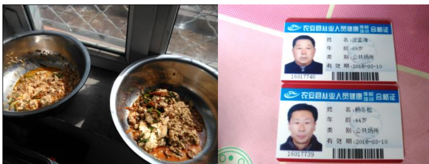
图 11 餐余图