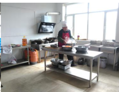
图 4 厨房卫生情况图