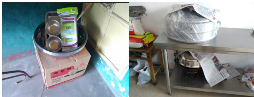
图 18 闲置厨具用品