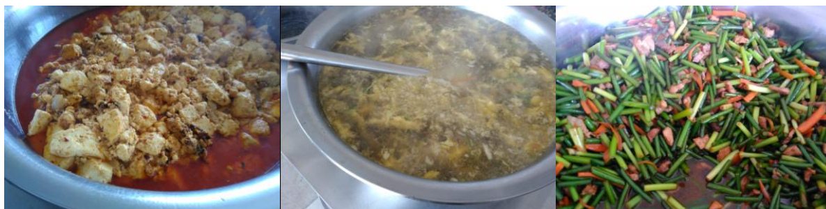
图 7 学校午餐食品情况组图