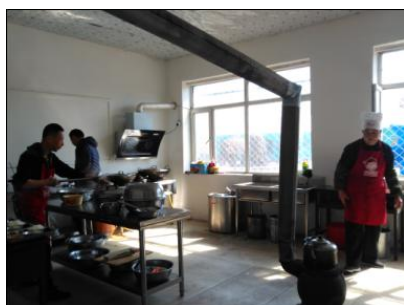
图 3 厨师卫生情况图