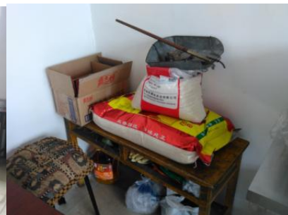
图 5 食材储存情况图