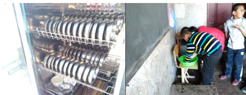
图 6 用餐卫生情况组图