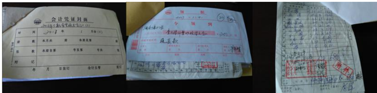
图 12 原始凭证组图