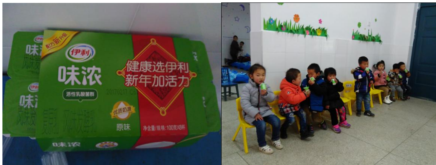
图 16 幼儿园在校喝酸奶