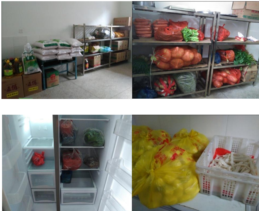
图 4 食材储存情况组图