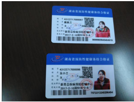
图 8 厨师健康证图