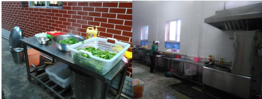
图 3 厨房卫生情况组图