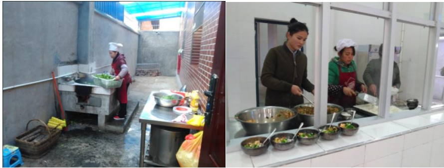
图 2 厨师卫生情况组图