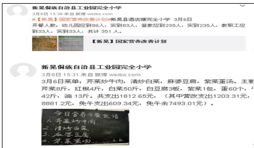
图 7 学校微博公示截图