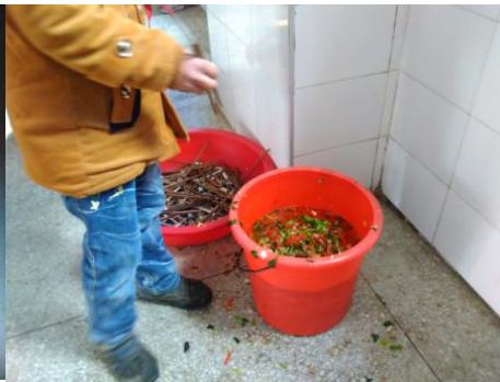
图 9 餐余图