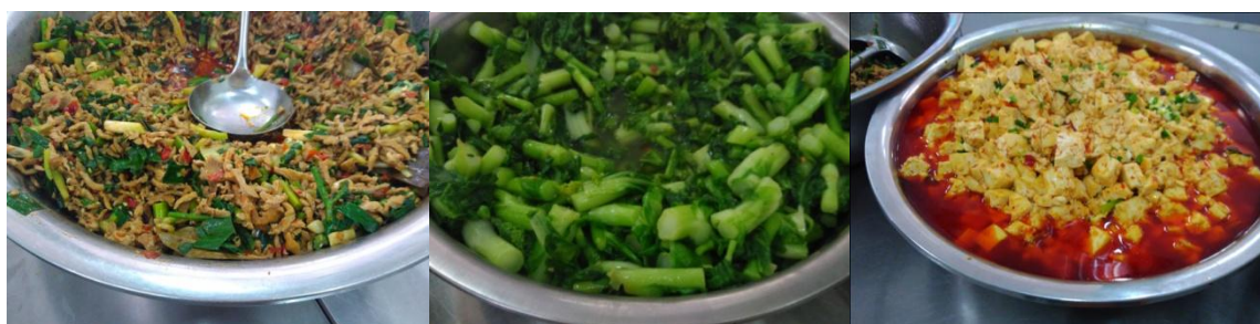
图 6 学校午餐食品情况组图