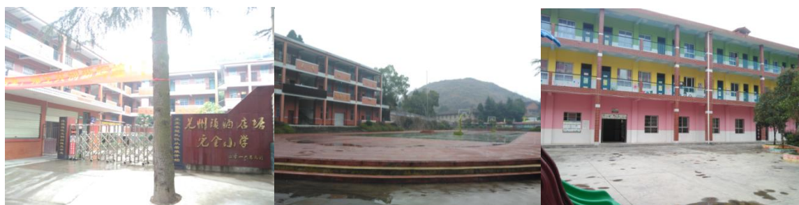
图 1 学校情况组图