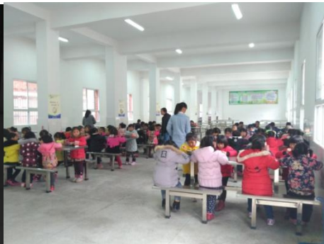
图 11 就餐情况组图