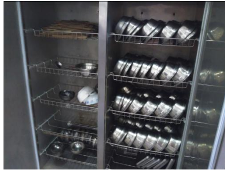
图 5 用餐卫生情况图