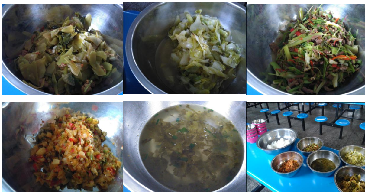
图 7 学校午餐食品情况组图