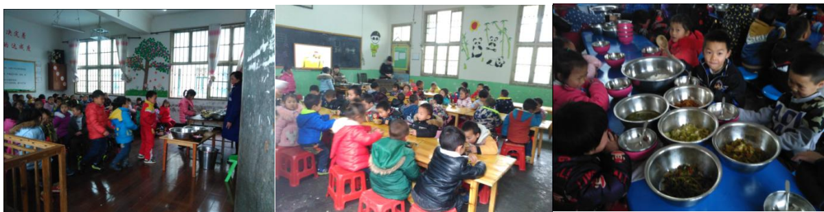
图 11 就餐情况组图