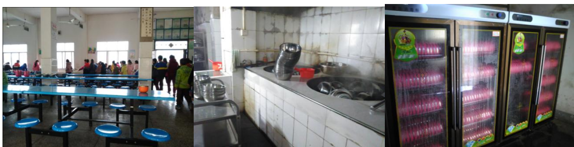
图 6 用餐卫生情况组图