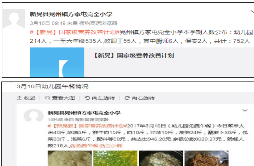
图 8 学校微博公示截图