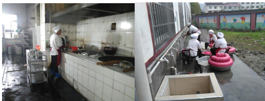
图 3 厨师卫生情况组图