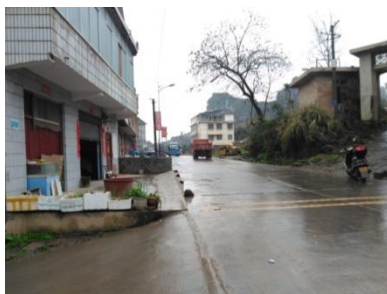
图 1 路况图