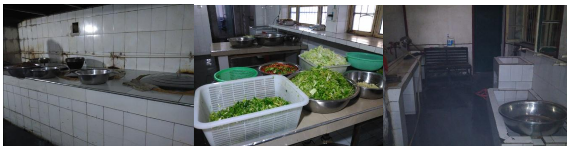
图 4 厨房卫生情况组图