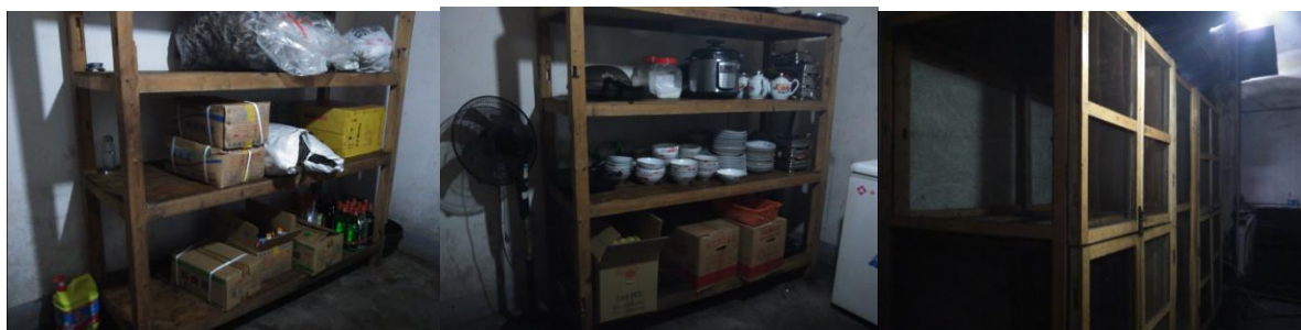
图 5 食材储存情况组图