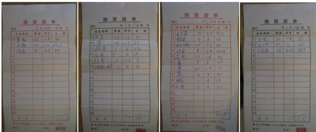
图 10 原始凭证组图 (无责任人签字信息)