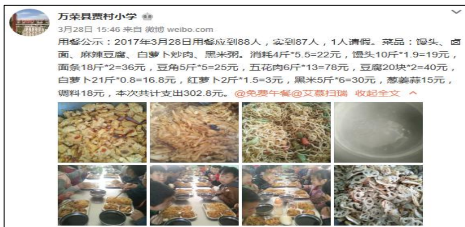
图 6 学校微博公示截图 (非白萝卜炒肉、无公示图 8 的藕片)