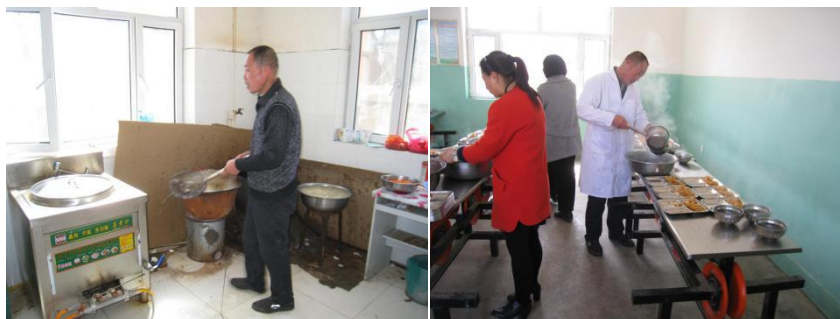
图2 厨师卫生情况组图 (备餐期间未着工作服)