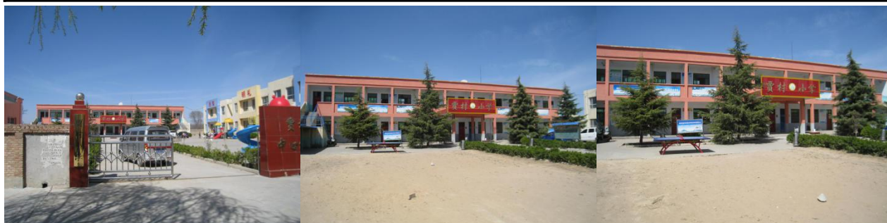
图 1 学校情况组图