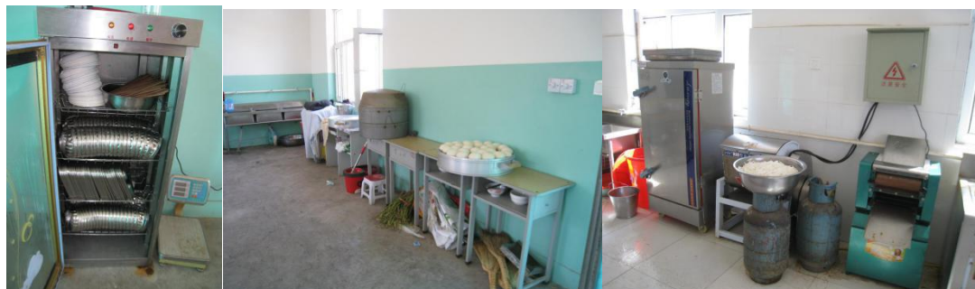
图3 厨房卫生情况组图 (工作台较凌乱、地面卫生一般)