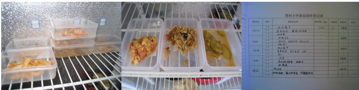
图 7 食品留样及留样记录表组图（菜品留样未密封、未贴标签）