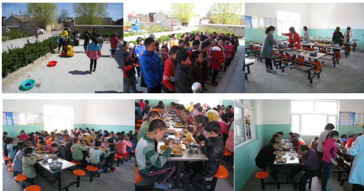
图 9 就餐情况组图