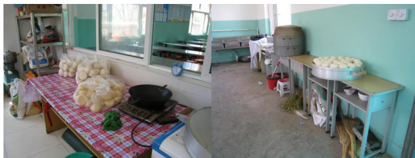
图4 食材储存情况组图 (食材就地存放)