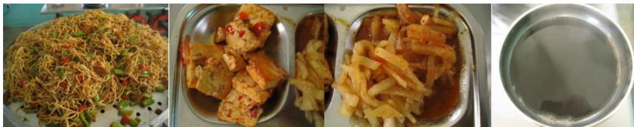
图 5 学校午餐食品情况组图