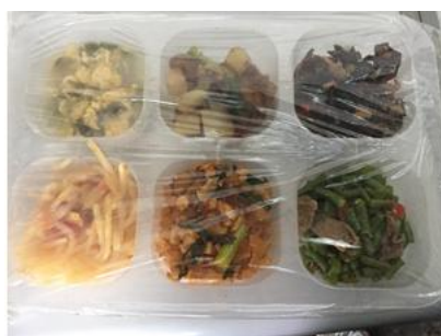
图 9 食品留样图