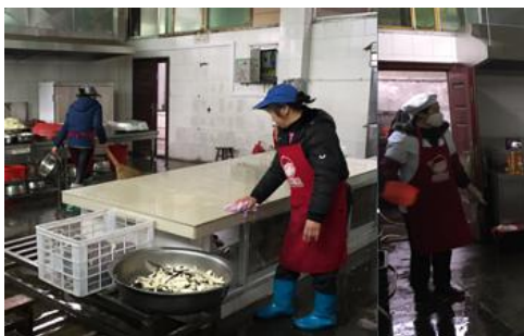
图 3 厨师卫生情况图