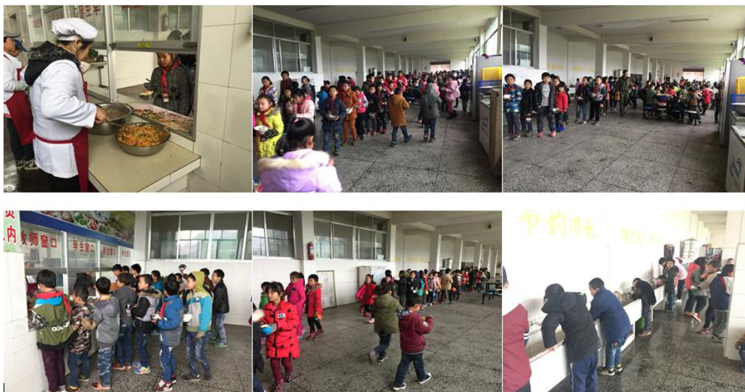
图 10 就餐情况组图