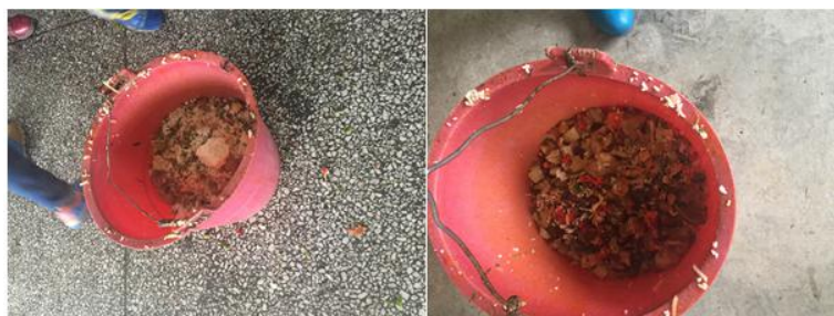
图 11 餐后厨余组图