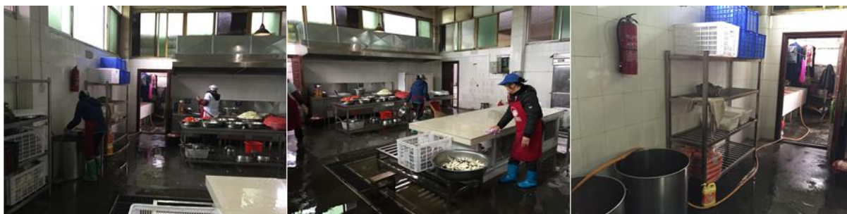
图 4 厨房卫生情况组图