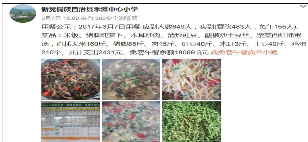
图 7 学校微博公示截图