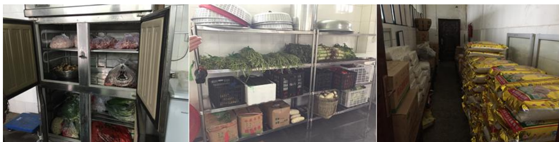
图 5 食材储存情况组图