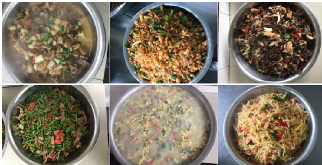
图 6 学校午餐食品情况图组