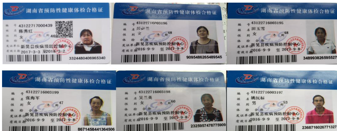
图 8 厨师健康证组图