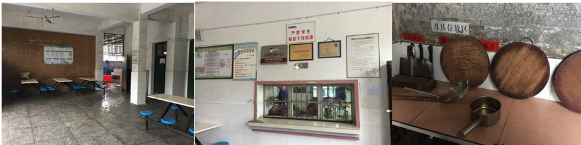
图 4 厨房卫生情况组图（厨房墙面卫生差）