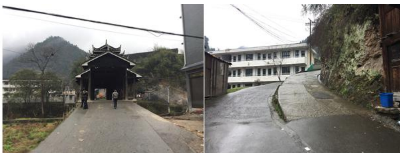
图 1 路况组图