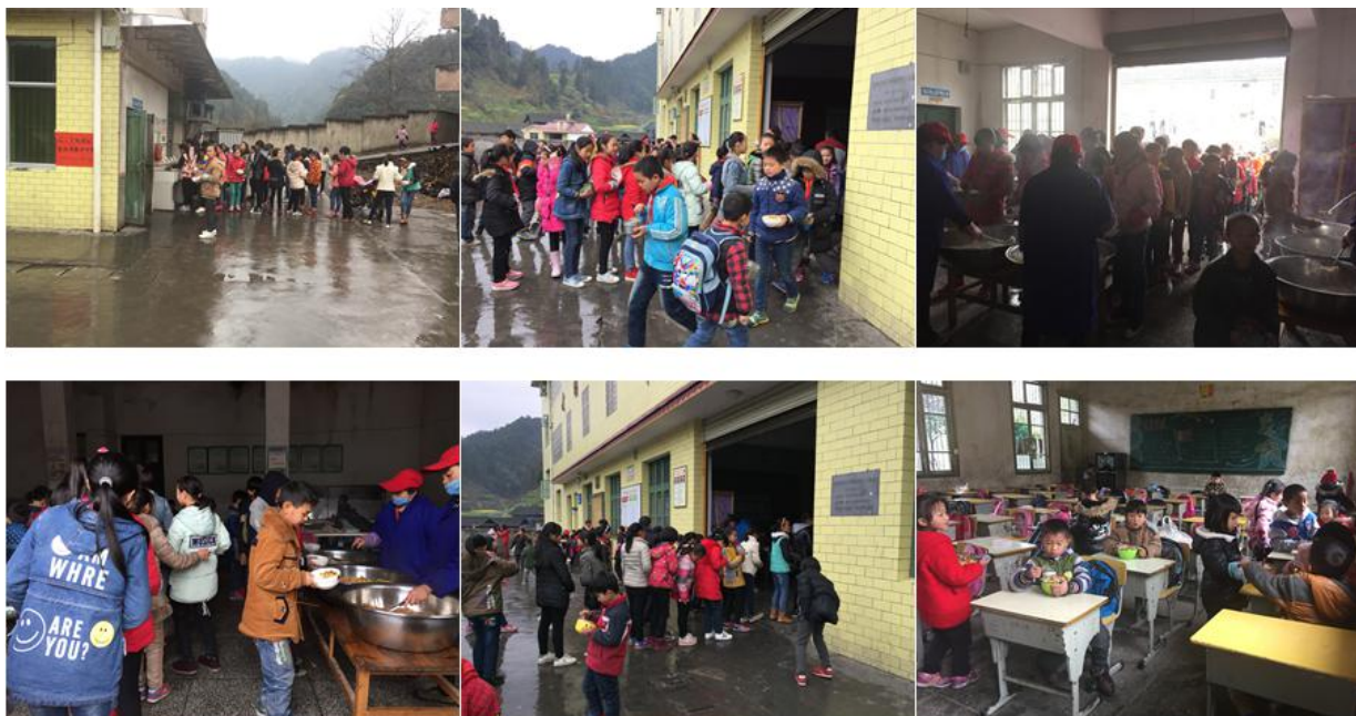
图 10 就餐情况组图