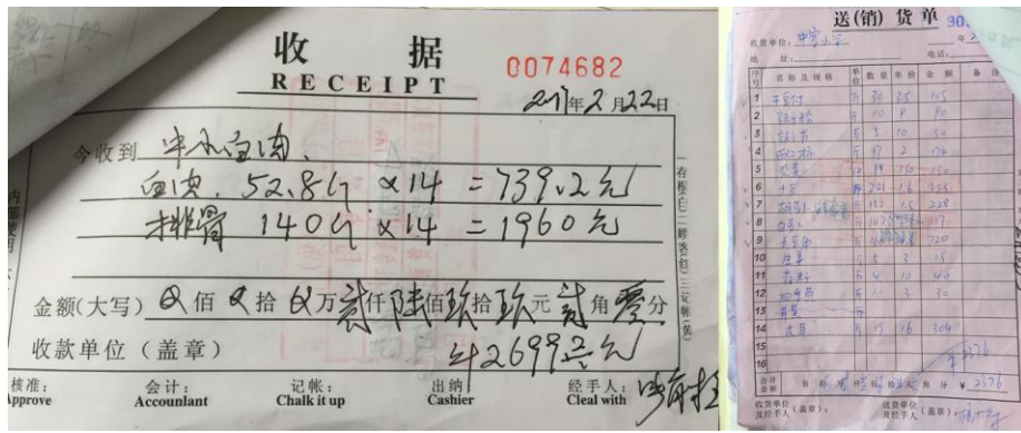
图 12 原始凭证组图