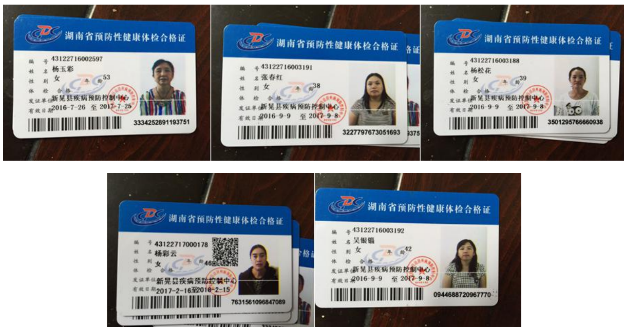
图 8 厨师健康证组图