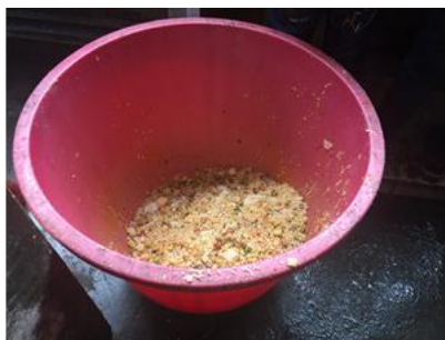
图 11 餐后厨余图