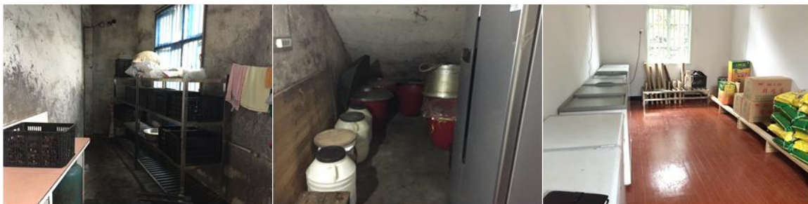
图 5 食材储存情况组图