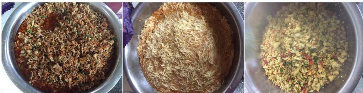
图 6 学校午餐食品情况组图