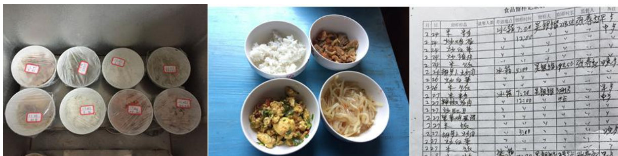
图 9 食品留样组图