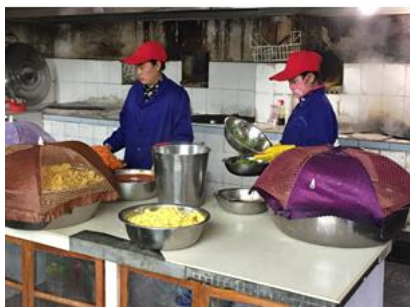
图 3 厨师卫生情况图