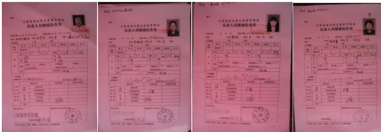
图 7 厨师健康体检表组图