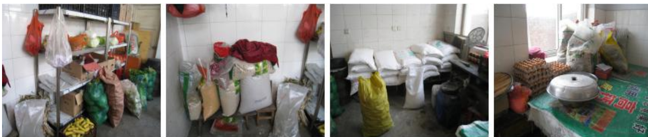
图4 食材储存情况组图