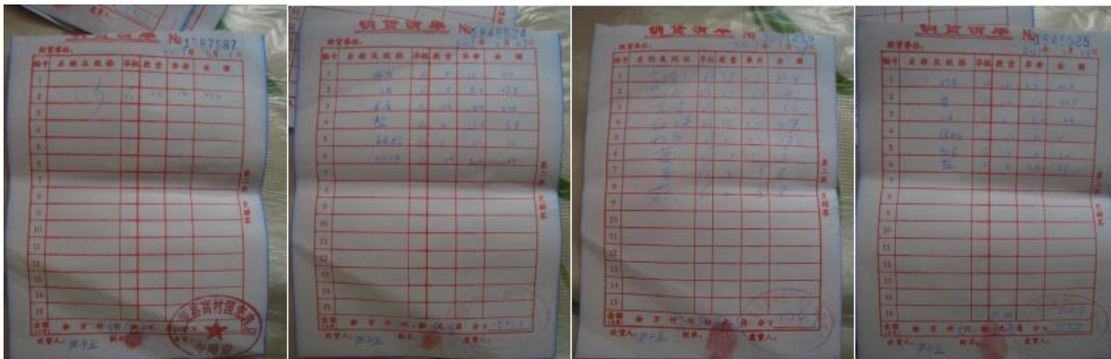
图 10 原始凭证组图 (无审核人签字信息)