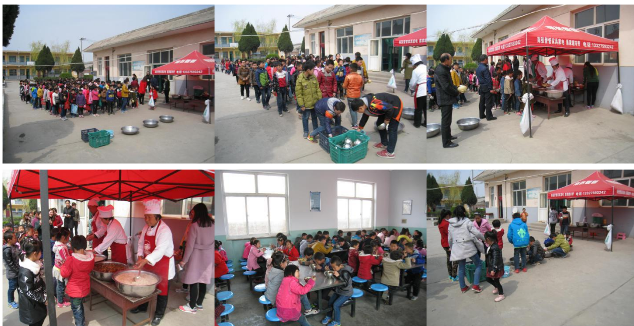
图 9 就餐情况组图