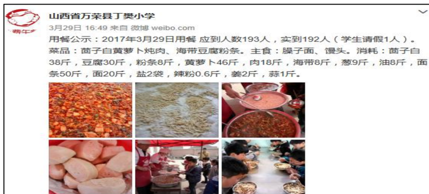
图 6 学校微博公示截图