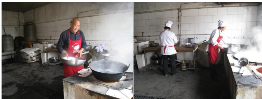
图2 厨师卫生情况组图 (备餐期间, 其中一位未着完整工作服)