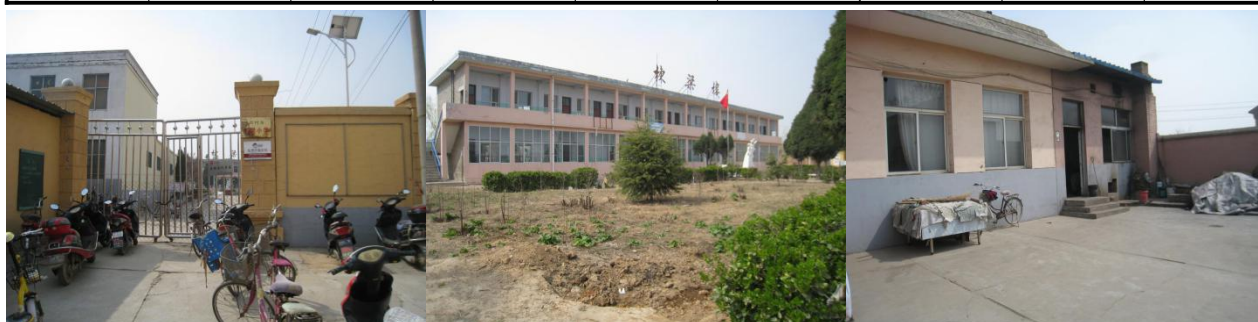
图 1 学校情况组图