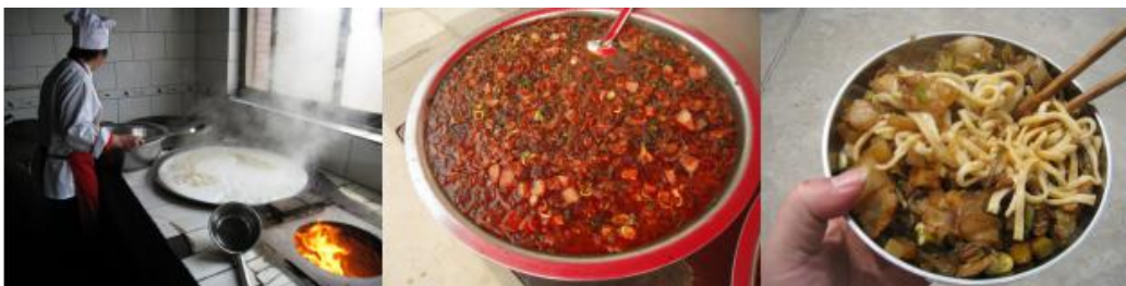
图 5 学校午餐食品情况组图