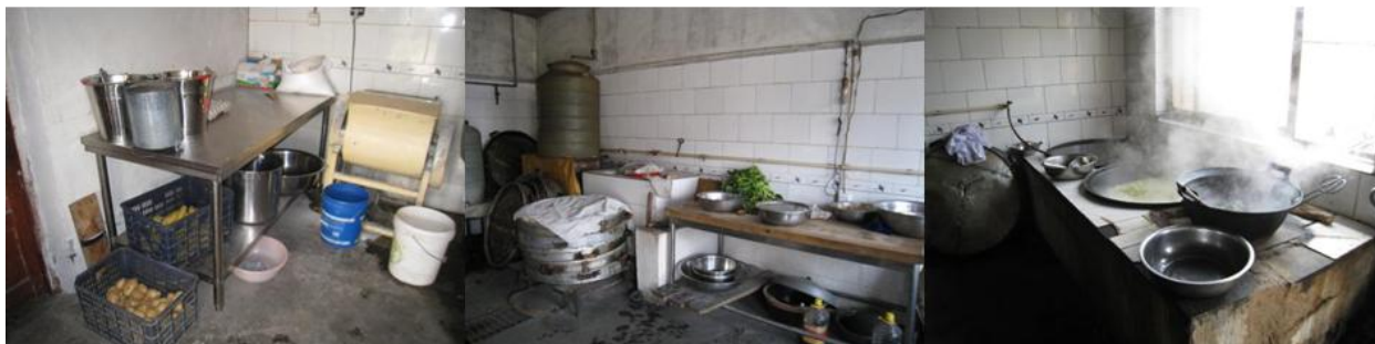
图3 厨房卫生情况组图