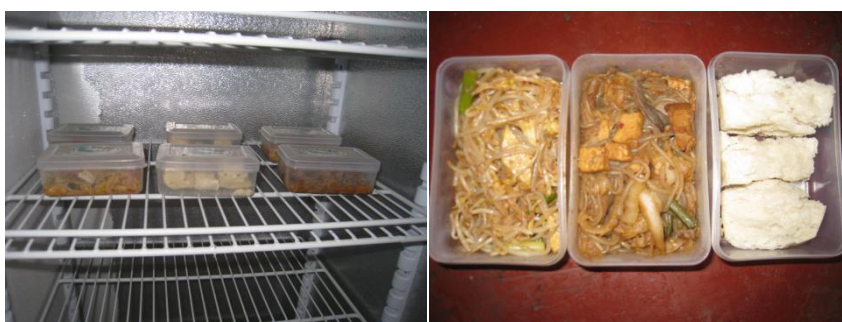
图 8 食品留样及留样记录表组图 (在消毒柜中保存, 且菜品留样未贴标签、未见菜品留样记录)