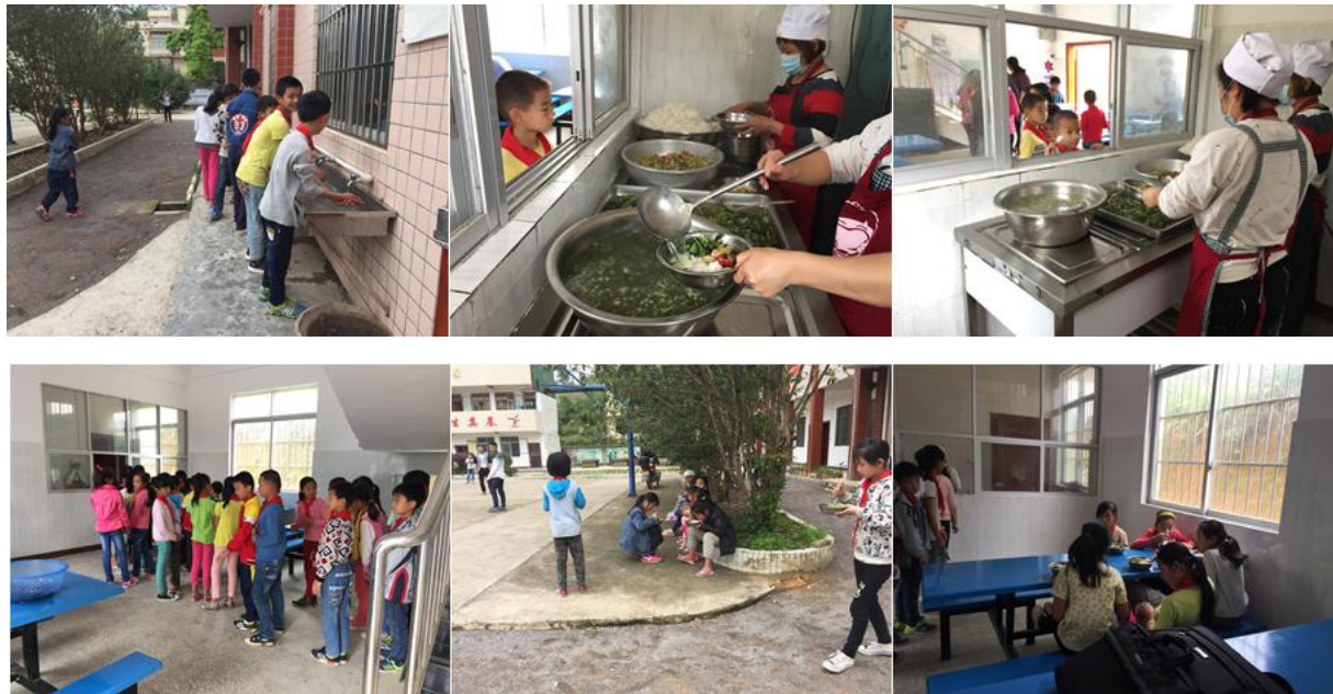
图 11 就餐情况组图