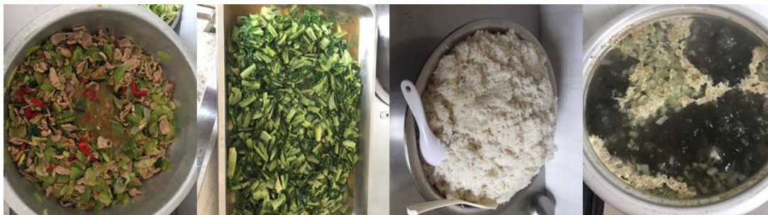
图 7 学校午餐食品情况组图