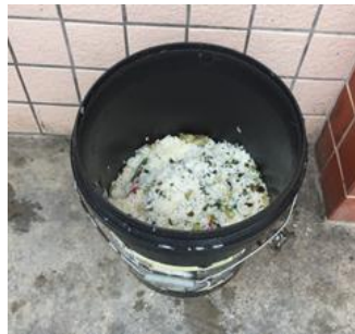
图 12 餐后厨余情况图