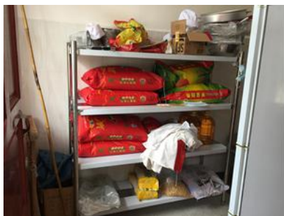
图 5 食材储存情况图