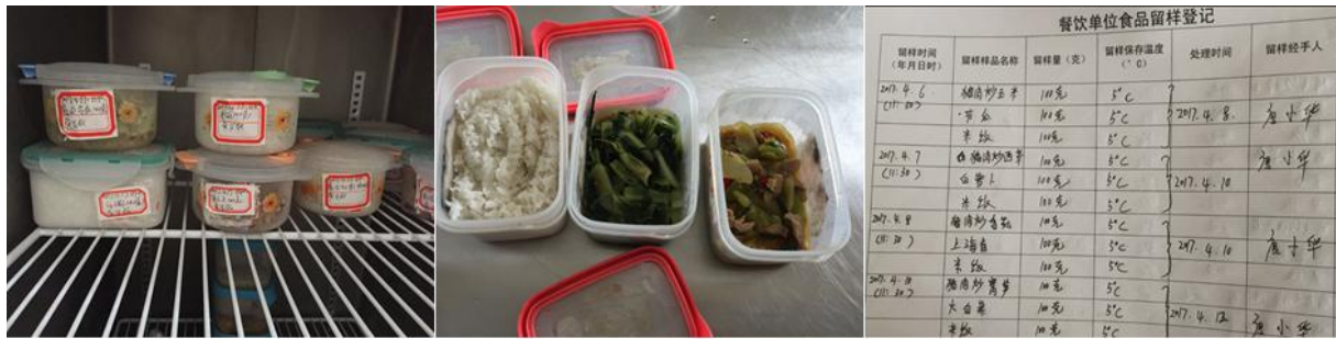
图 10 食品留样组图