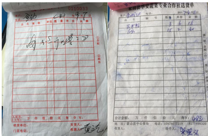
图 13 原始凭证组图