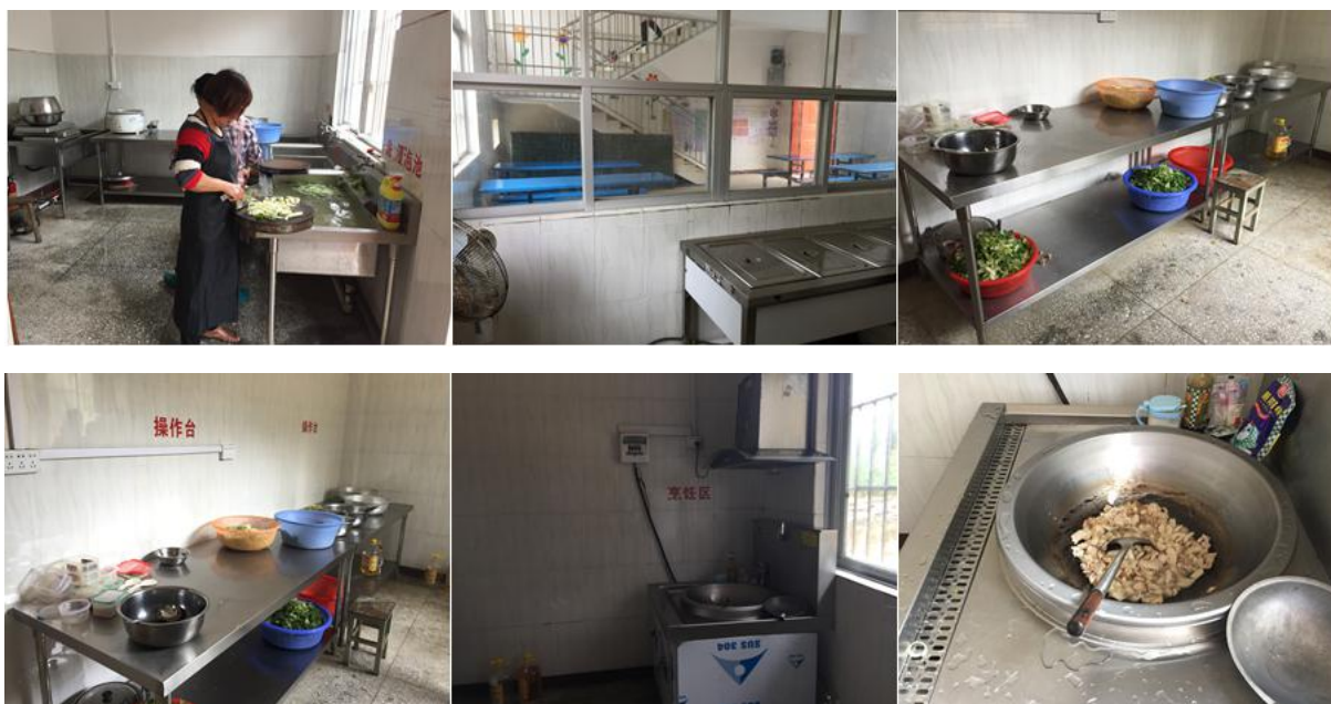
图 4 厨师及厨房卫生情况组图