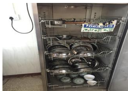
图 6 用餐卫生情况图