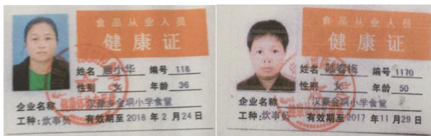
图 9 厨师健康证组图