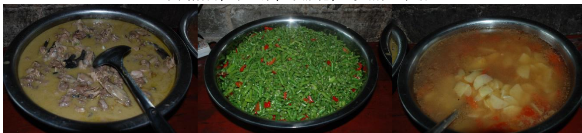
图 11 幼儿班校区午餐食品组图 (炖土鸡肉、炒豇豆、土豆汤)

新晃侗族自治县黄雷学校 3月3日 13:13 来自 OPPO R9 Plus #【新晃】县国家营养改善计划#黄雷学校2017.3.3用餐, 总人数585人, 营改人#【新晃】县国家营养改善计划#黄雷学校2017.3.2用餐, 总人数585人, 营改人数468人, 免午人数117人, 菜单: 米饭, 肉炒胡萝卜, 炒土豆, 炒白萝卜, 煮鸡蛋468人, 免午人数117人, 菜单: 米饭, 炒牛肉, 炒土豆, 炒包菜, 冻菌汤, 消耗蛋。消耗大米150斤, 猪肉78斤, 土豆45块, 胡萝卜50斤, 白萝卜40斤, 鸡蛋 大米150斤, 牛肉80斤, 土豆52块, 包菜40斤, 冻菌20斤, 干辣椒2斤, 盐8包, 560个, 盐8包, 油2瓶。共计1879.18元, 其中营改金额1503.34元, 免午金额 油2瓶。共计1737.1元, 其中营改金额1389.68元, 免午金额347.42元, 免午余额 375.84元, 免午余额3456.45元。 怀化·新晃侗族自治县 收起全文 ^ 3832.29元。 怀化·新晃侗族自治县 收起全文 ^