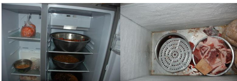
图 7 中心校区熟食未密封隔离冷藏、冰箱内欠干净