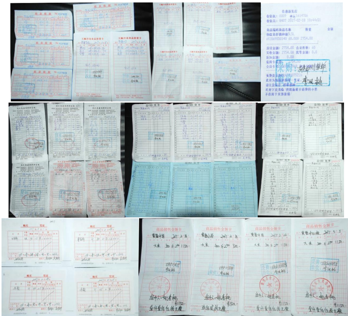
图 19 原始凭证组图