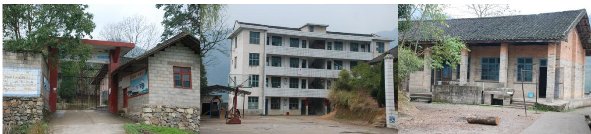
图 2 幼儿班校区环境组图