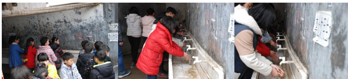
图 9 中心校区学生餐前自觉洗手、但幼儿班校区学生餐前未洗手