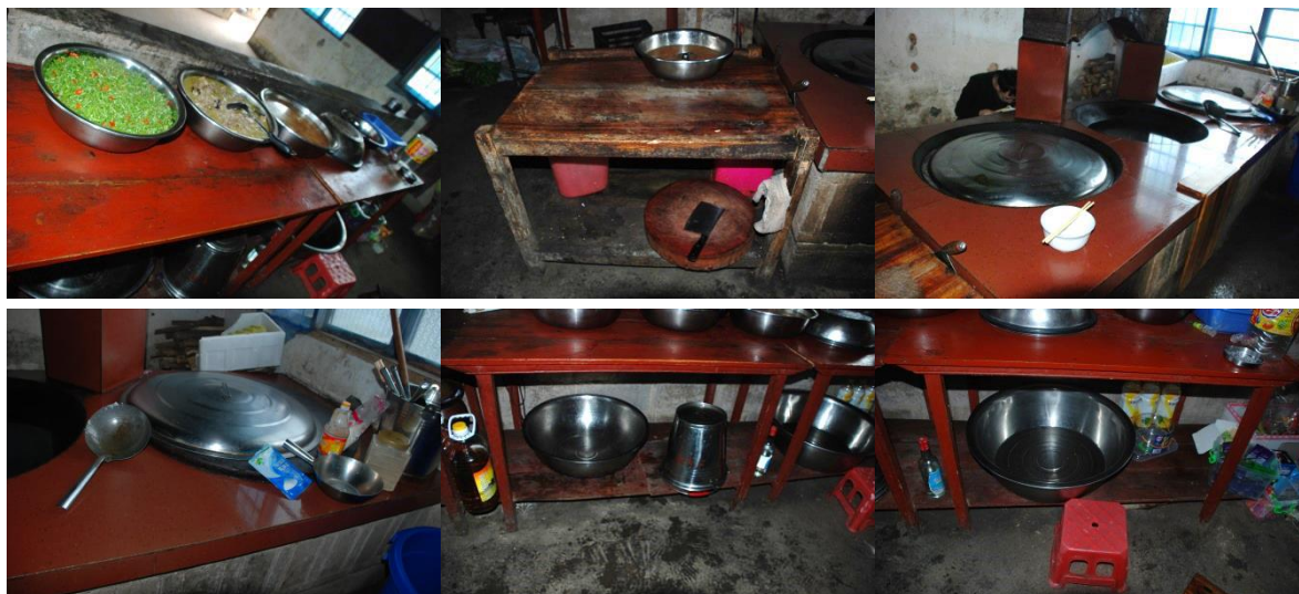
图4 幼儿班厨房情况组图