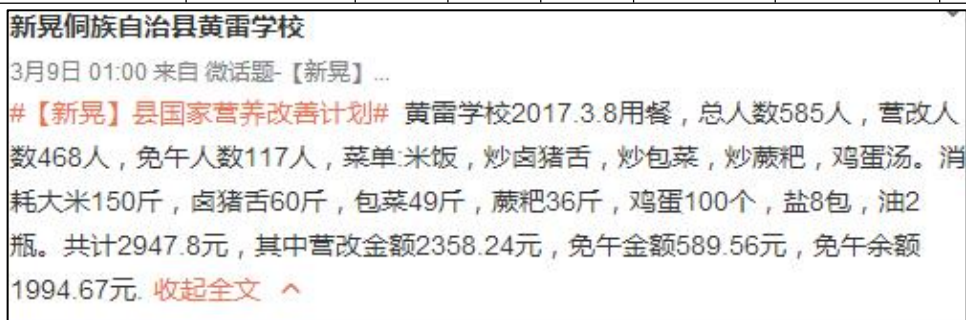
图 2 调查当天学校微博公示截图