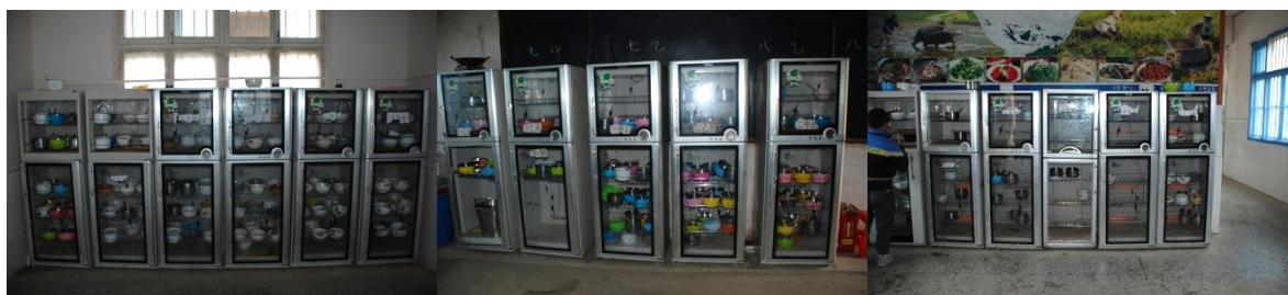
图 8 部分消毒柜已坏