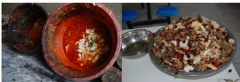
图 16 餐后剩饭菜图 (在正常范围) (倒掉一大盆几乎都是卤猪舌, 可见学生不喜欢吃这道菜)