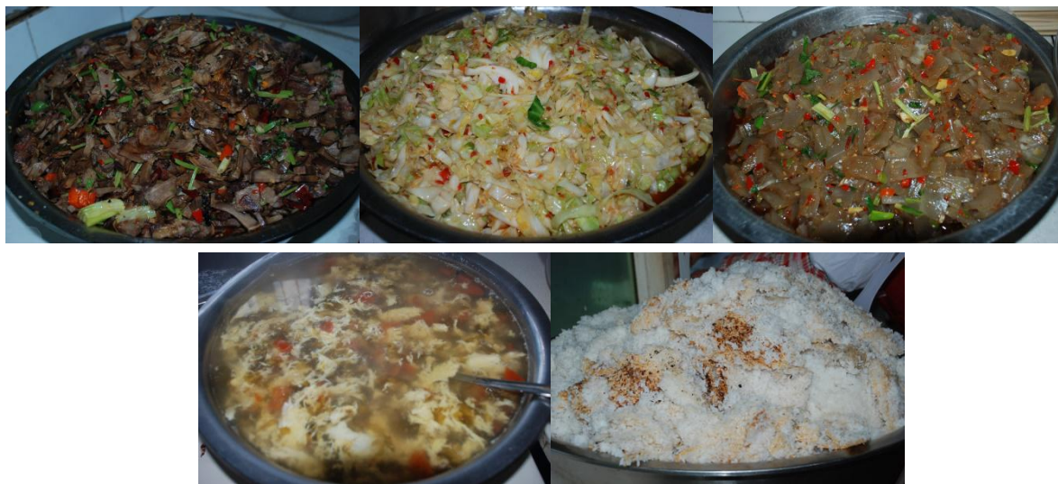
图 10 中心校区午餐食品组图 (炒卤猪舌, 炒包菜, 炒蕨粿, 鸡蛋汤、米饭)