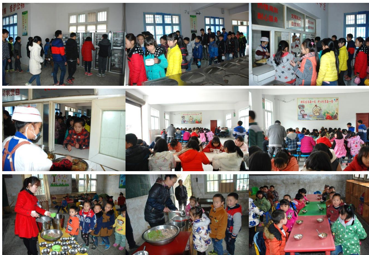
图 15 就餐情况组图 (有序就餐)