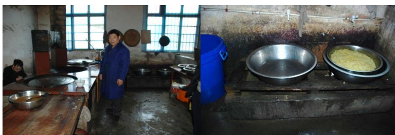
图5 幼儿班校区厨师未戴工作帽、洗菜池有明显卫生死角