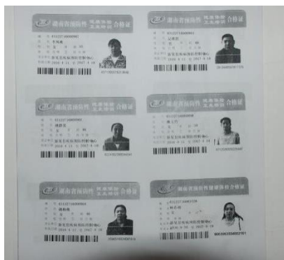
图 13 厨师健康证图 (均在有效期内)