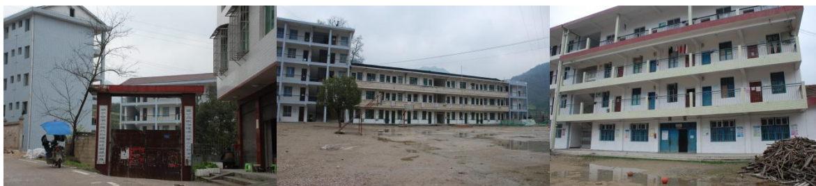
图 1 中心校区环境组图