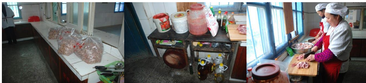
图3 中心校区厨房、厨师情况组图