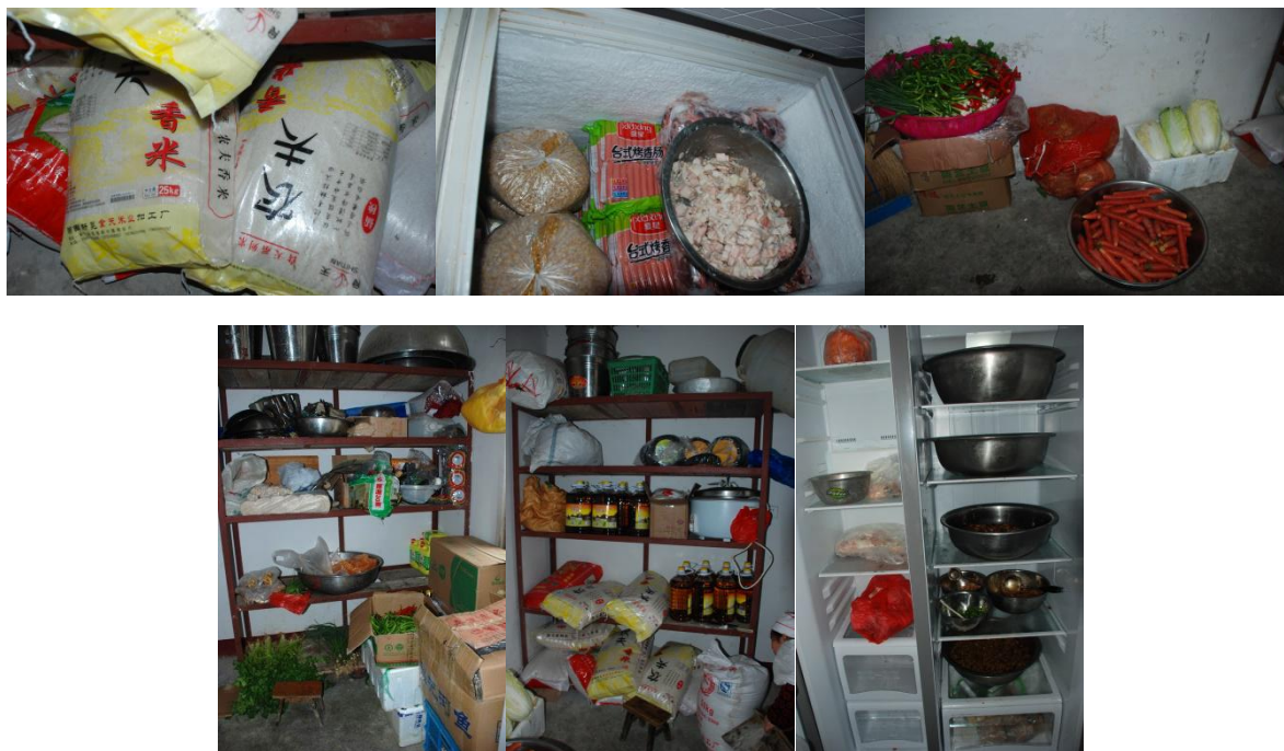
图 6 食材储存情况组图